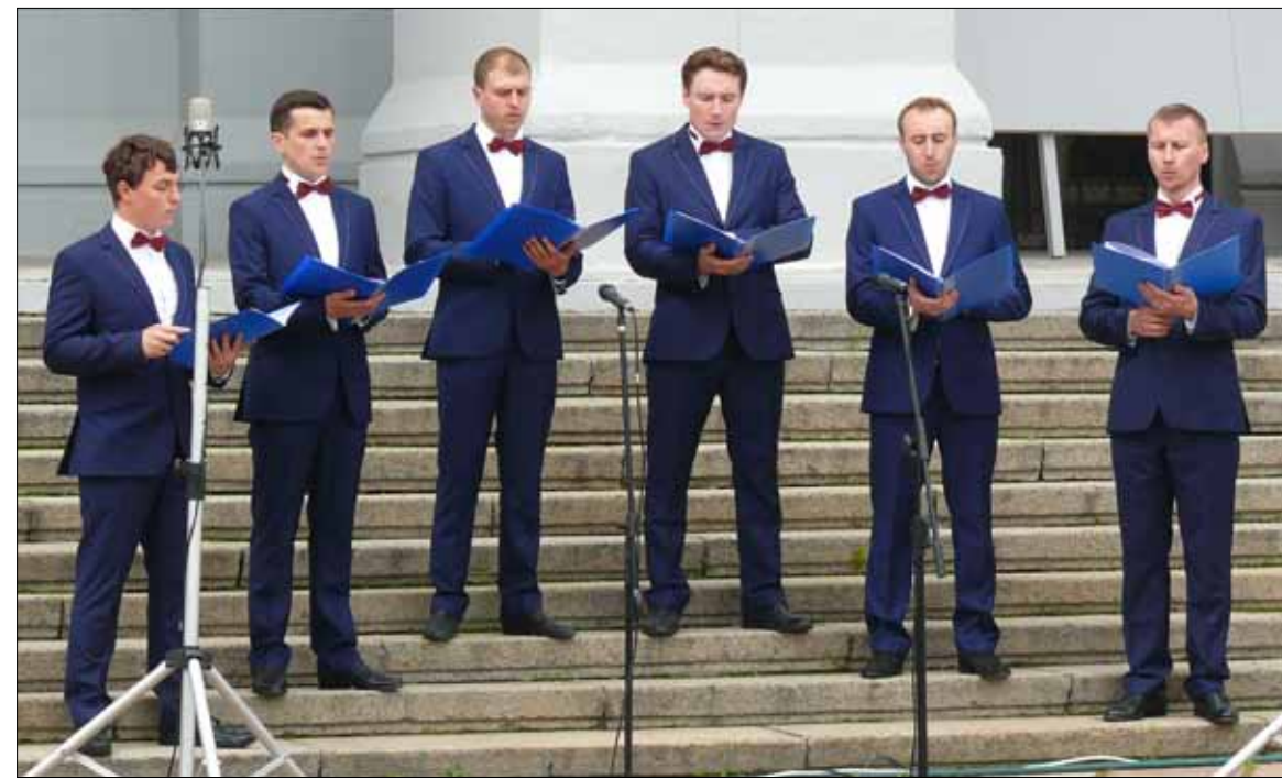
Виступає чоловічий вокальний ансамбль «Perfectum».