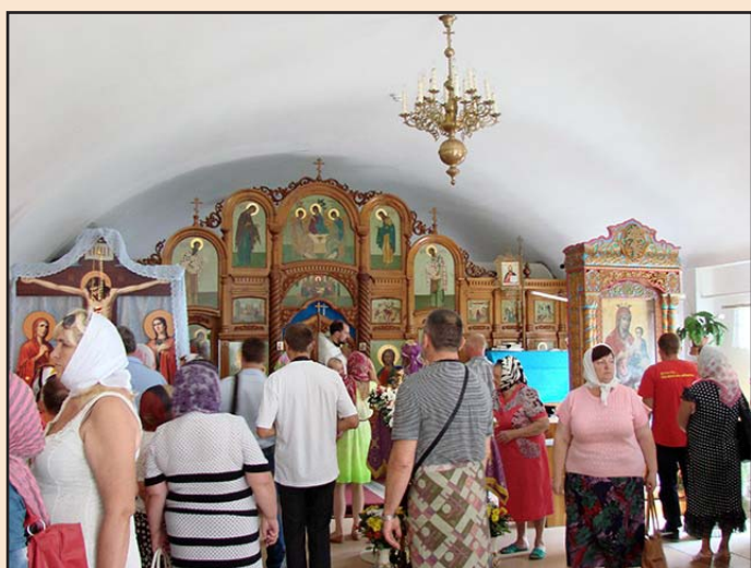
Ил. 7. Группа паломников в храме

вершают богомольное путешествие – в составе группы или индивидуально), интересуется прежде всего непосредственное участие в религиозных культурах. Паломники в основном исповедуют ту религию, святым местам которой они приехали поклониться. Как следствие этого: социально-психологическая база паломничества уже, чем у религиозного туризма; экскурсии, посещение музеев и выставок – цель для паломников вторичная, сопутствующая, а зачастую вообще малоинтересная.