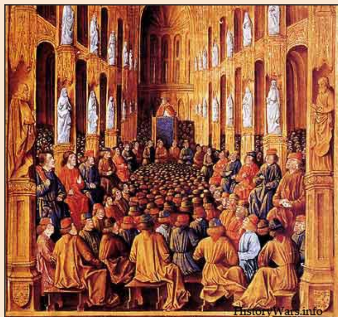
Ил. 2. Клермонский собор. 1095 г. Миниатюра

ства, а в более широком понятии – истории паломнического движения в целом, необходимо вспомнить, что именно Папа Урбан обосновал необходимость такой войны против мусульман, обещал участникам отпущение грехов, благословил паломников с мечом идти в Иерусалим и Палестину, чтобы отвоевать христианские святыни у неверных, освободить их от владычества сарацин, тем самым Святой престол благословил «освобождение» святых мест.