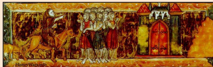
Ил. 1 Пётр Пустынный указывает крестоносцам путь на Иерусалим. Миниатюра

С конца XI в. в Западной Европе зарождается новое явление: христиане с оружием решаются на далёкие походы, в священный город Иерусалим. В католическом мире распространяются идеи религиозной войны, освобождения Гроба Господня и христианских святынь. Государи и крупные сеньоры, вместе с рыцарями, выступают в экспедиции под эгидой церковной власти, что, в итоге, оборачивается войнами и даже приводит к образованию новых государств.