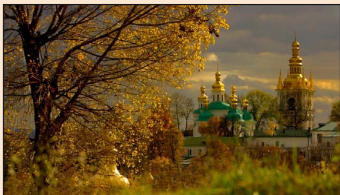
Ил. 9 Святая Киево-Печерская лавра