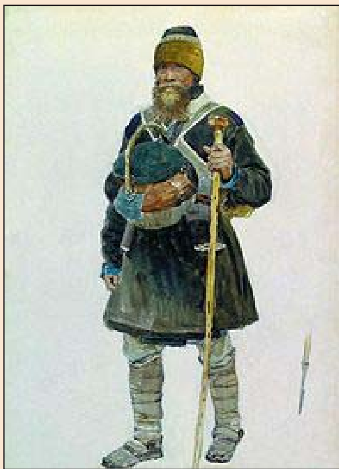
Ил. 6. И. Репин. «Паломник»

В паломничество обычно отправлялись в теплое время года. Это объясняется тем, что настоящим паломникам полагалось идти к святым местам пешком.