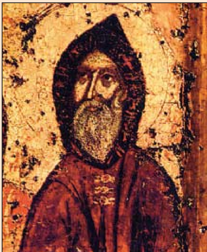
Ил. 4 Преподобный Антоний Печерский (конец X – начало XI вв.)

из русских богомольных путешествий в Грецию, на Святую гору Афон. Туда ходил основатель Киево-Печерской лавры преподобный Антоний Печерский (конец X – начало XI вв.).