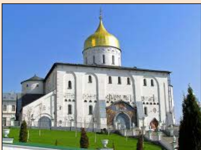
Ил. 11 Успенская Почаевская лавра

териум отбора был и остается достаточно длительный срок пребывания в лоне Православной церкви, т. е. воцерковленность. Образование, возраст, опыт работы с людьми – критерии второго или даже третьего плана, они, как правило, применяются при подборе руководящего звена. Возникает вопрос: если так обстоят дела с сопровождающими в больших паломнических отделах, кто же тогда сопровождает в поездках группы из небольших населенных пунктов страны? Ответ однозначен – приходской священник или, в лучшем случае, если приход городской, то воспитанник духовного учебного заведения (при наличии такого).