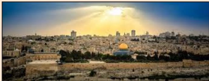
Ил. 8 Иерусалим