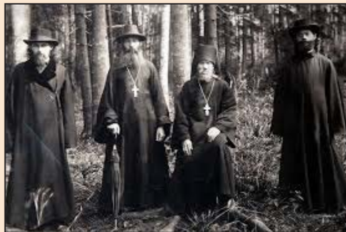
Ил. 5. Группа священников-паломников

Проблема Святых мест... В чем же состоит сама суть проблемы? При рассмотрении этой проблемы и ее решения необходимо выделить два момента. Во-первых, в узком смысле это связано с борьбой между мусульманами и христианами за обла-