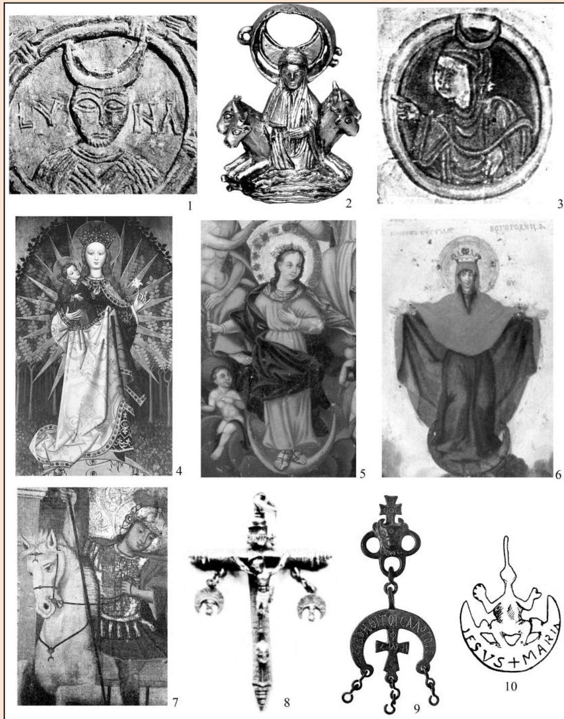
Пл. 2. Зображення півмісяця та підвіски-лунниці у християнській іконографії та культовій пластиці:

1 – фрагмент барельєфу з каплиці Санта-Марія, відома як Квінтанілла де лас Вінас, пров. Бургос, Іспанія, VII–VIII ст.; 2 – долина Маас, Франція, друга половина XII ст.; 3 – фрагмент мініатюри Каталонського манускрипту, Іспанія, XII ст.; 4 – Мадонна, одягнена в сонце (польський майстер), середина XV ст.; 5 – з ікони «Коронування Богородиці», Городне Волинської обл., середина XVIII ст.; 6 – з ікони «Покрова Богородиці», Дорогиничі Волинської обл., перша половина XVIII ст.; 7 – з ікони «Юрій Змієборець», Волинь, XVII ст.; 8, 10 – Іспанія, XIX ст.; 9 – Мала Азія, VIII–IX ст.