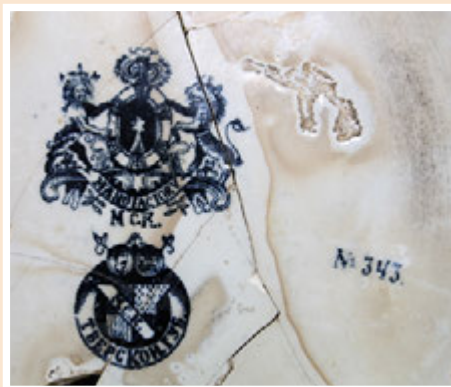
Ил. 4. Фаянсовый ночной горшок, изготовленный на Тверской фабрике М.С. Кузнецова