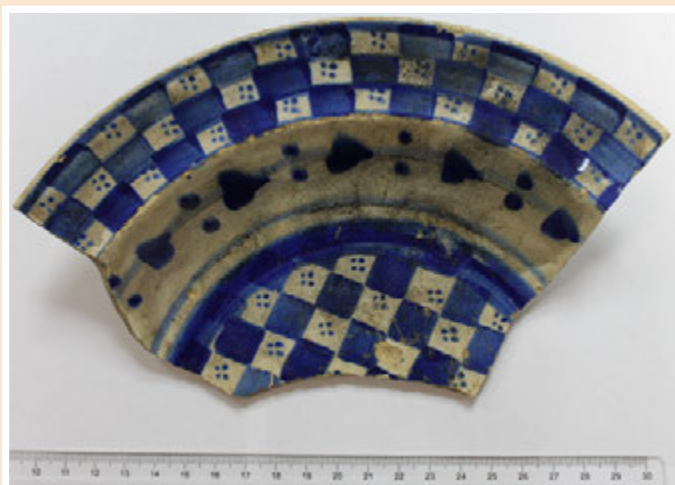
Ил. 2. Фрагмент тарелки с гжельской росписью с геометрическим орнаментом