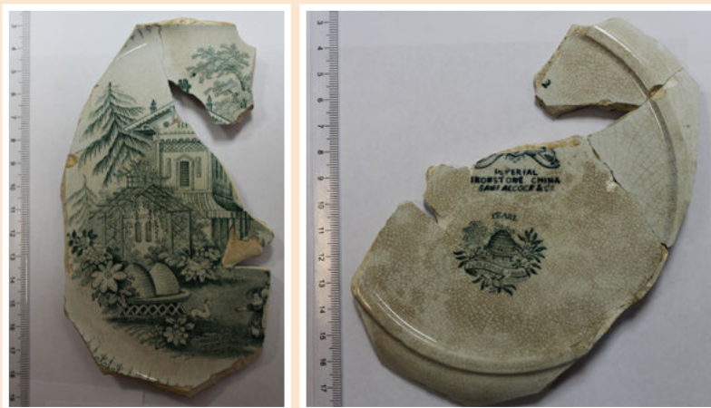
Ил. 10. Фрагмент тарелки английского производства Самуэля Алкока