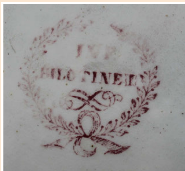
Ил. 14. Тарелка в «китайском стиле»

Выполнены рисунки подглазурно в технике печати кобальтом. По кобальту надглазурно красной краской нанесена графика. С обратной стороны на доньшке стоит печатное подглазурное фиолетовое клеймо на тему западноевропейских клейм с надписью в две строчки «МАНУФАКТУРА МСК», ниже – круглая марка с надписями «М.С.К.», «ТВЕРСКОЙ ГУБ.». Датируется после 1889 года [3, с. 112, 187].