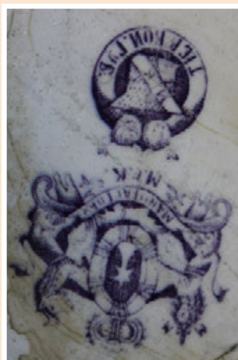
Ил. 3 Таз фаянсовый для умывания, изготовленный на Тверской фабрике М.С. Кузнецова