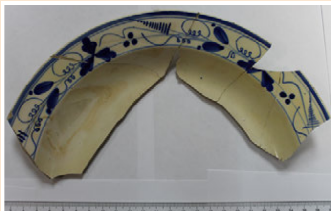
Ил. 1. Фрагмент тарелки с гжельской росписью с растительным орнаментом

Знаємо стільки, скільки пам'ятаємо Знаем столько, сколько помним Tantum scimus, quantum memoria tenemus