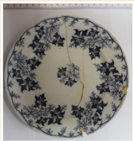
Ил. 9. Тарелка немецкой фирмы «Villeroy & Boch»

Знаємо стільки, скільки пам'ятаємо Знаем столько, сколько помним Tantum scimus, quantum memoria tenemus