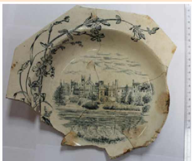
Ил. 11. Фрагмент тарелки с изображением английского замка Алтон ТOVERC