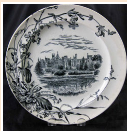
Ил. 13. Тарелка с изображением замка Алтон ТOVERC. Частная коллекция. США