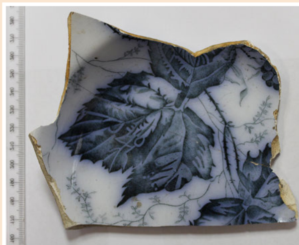
Ил. 7. Фрагмент тарелки с клеймом, изготовленной в с. Буды, Т-во М.С. Кузнецова