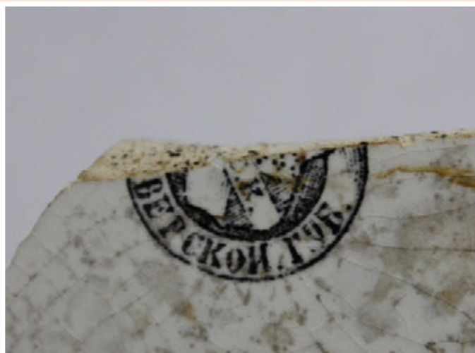
Ил. 5. Фрагмент клейма на тарелке, изготовленной на Тверской фабрике М.С. Кузнецова

Знаємо стільки, скільки пам'ятаємо Знаем столько, сколько помним Tantum scimus, quantum memoria tenemus