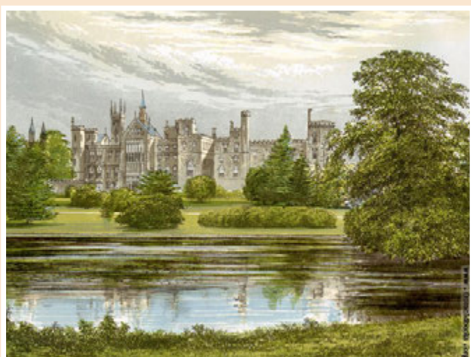
Ил. 12. Уилмот Пилсбури. Акварель. Конец XIX в.