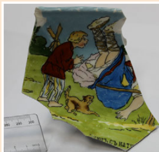
Ил. 6. Фрагмент фарфоровой посуды неизвестного производителя