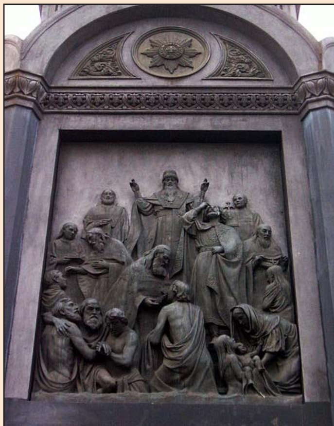
Іл. 3. Горельєф «Хрещення Русі» на постаменті пам'ятника великому князю Володимирі Святославичу в м. Києві

28 вересня (10 жовтня) 1853 року пам'ятник було урочисто відкрито [8]. У церкві не було традиції освячувати пам'ятники, тому відкриття монумента поєднали з відкриттям Ланцюгового мосту через Дніпро 15 жовтня 1853 року. Церковні ієрархи пам'ятник не визнали. Особливо жорстку позицію відстоював владика Філарет (Амфітеатров), який прослужив на київській кафедрі з 1837 року до самої своєї смерті у 1857 році. Про ставлення митрополита Філарета до нового пам'ятника писав архімандрит Сергій Василевський: «Св. равноапостольный князь Владимир разрушал идолов и воздвигал святые храмы, а в честь его хотят воздвигнуть статую, почти что-то идолообразное. Кто же будет освящать такое сооружение?! По крайней мере, я не соглашусь совсем».