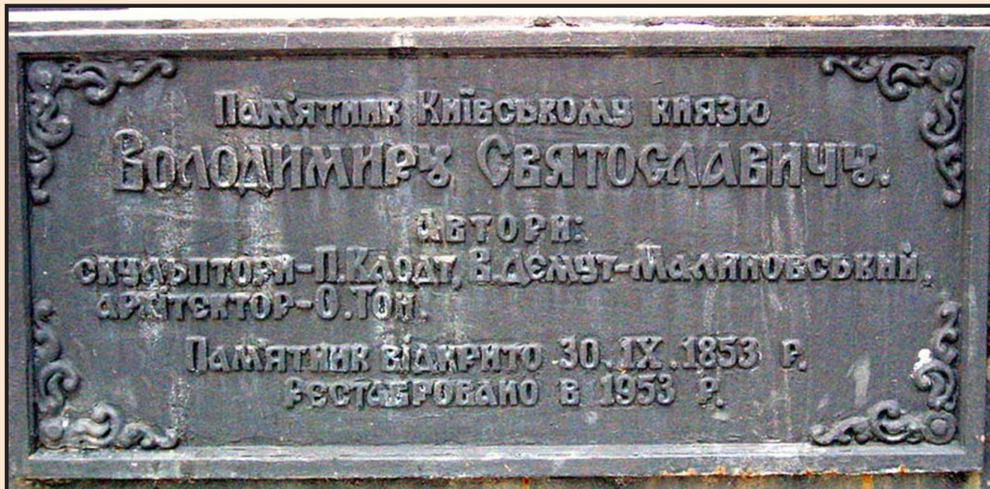
Іл. 4. Дошка, встановлена на пам'ятнику великому князю Володимирі Святославичу в м. Києві під час реконструкції 1953 року

и находили по его свету водяной путь в Город, к его пристаням. Зимой крест сиял в черной гуще небес и холодно и спокойно царил над темными пологими далями московского берега, от которого были перекинuty два громадных моста».