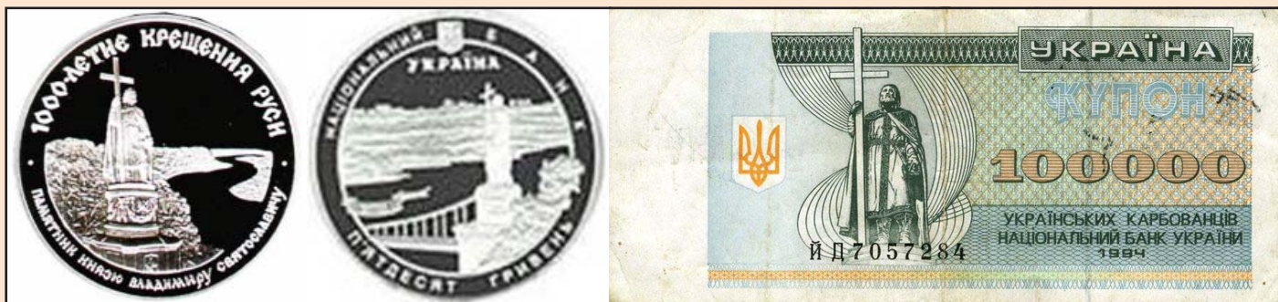
Іл. 5. Зображення пам'ятника князю Володимирі на радянській та українській ювілейних монетах та купоно-карбованці