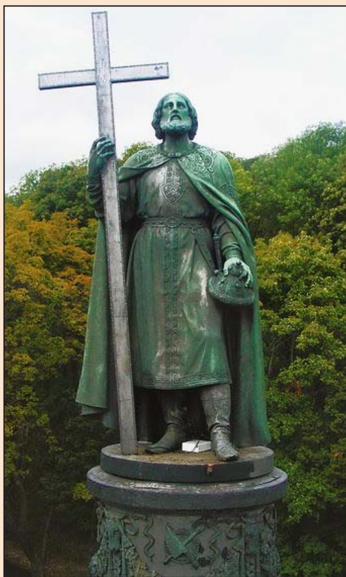
Іл. 2. Пам'ятник великому князю Володимирі Святославичу в м. Києві

Статую князя Володимира відлив особисто Петро Клодт у своїй майстерні в Санкт-Петербурзі, а чавунний постамент було відлито коштом купця Новікова на Лугненському заводі неподалік Калуги. На одному з барельєфів зірки російського ордена Святого Володимира літери «СРКВ» (Святий Рівноапостольний Князь Володимир) перевернуті, що є, на думку дослідників, просто помилкою ливарників.