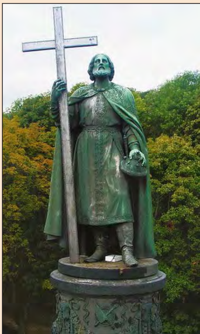
Іл. 2. Пам'ятник великому князю Володимирі Святославичу в м. Києві

Статую князя Володимира відлив особисто Петро Клодт у своїй майстерні в Санкт-Петербурзі, а чавунний постамент було відлито коштом купця Новікова на Лугненському заводі неподалік Калуги. На одному з барельєфів зірки російського ордена Святого Володимира літери «СРКВ» (Святий Рівноапостольний Князь Володимир) перевернуті, що є, на думку дослідників, просто помилкою ливарників.