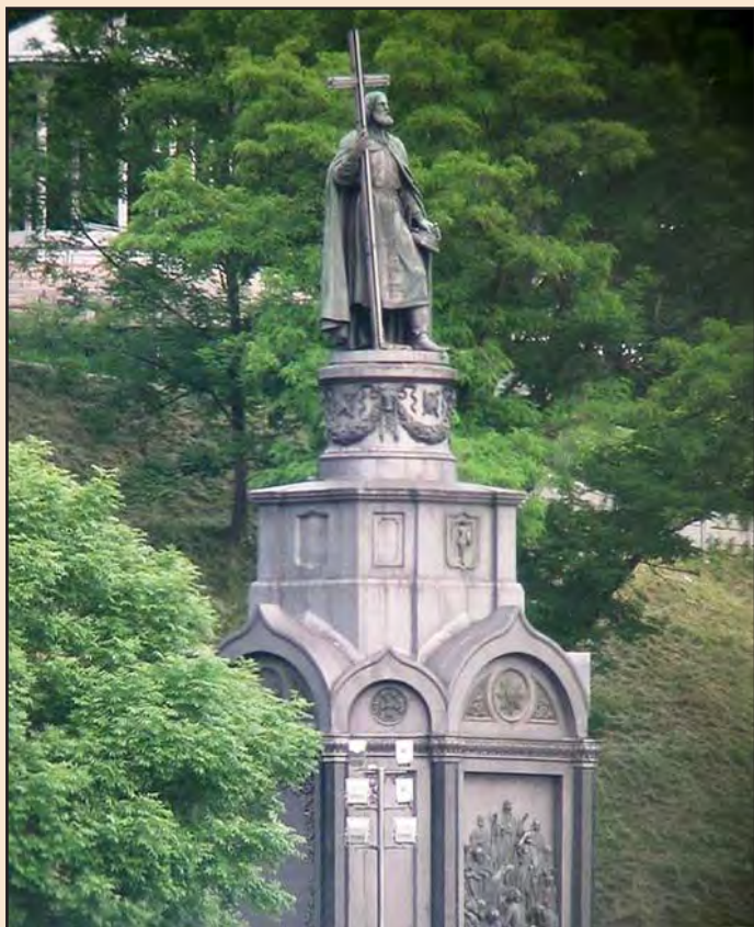
Іл. 1. Пам'ятник великому князю Володимирі Святославичу в м. Києві

Щодо того, який хрест має тримати князь, велося листування між Академією мистецтв, Святішим Синодом та Міністерством Імператорського двору. Проте імператор Микола I розпорядився, щоб хрест стояв вертикально, а спеціальне засідання Святішого Синоду постановило, що Володимир має тримати латинський хрест.