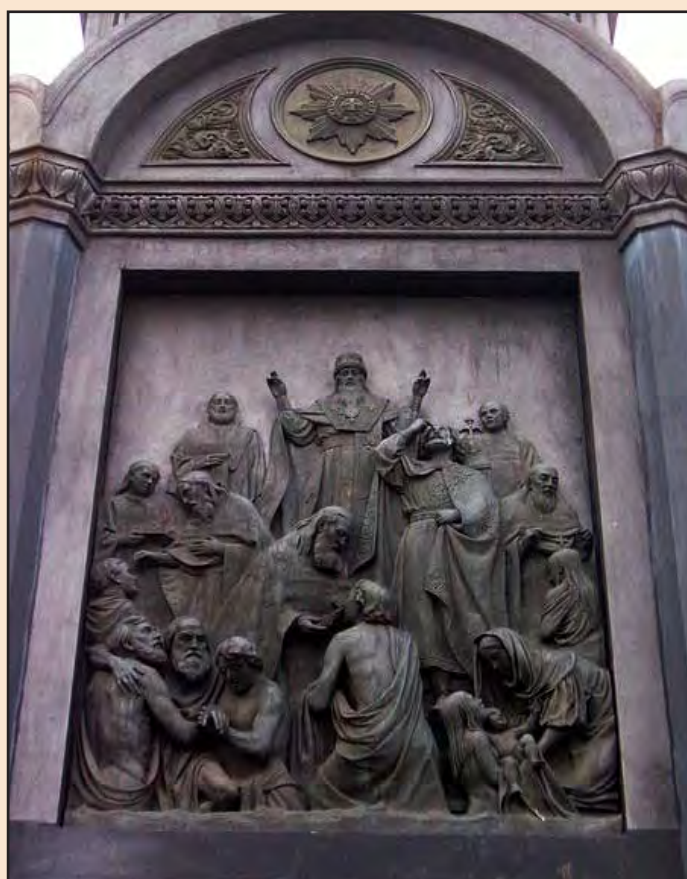
Іл. 3. Горельєф «Хрещення Русі» на постаменті пам'ятника великому князю Володимирі Святославичу в м. Києві

28 вересня (10 жовтня) 1853 року пам'ятник було урочисто відкрито [8]. У церкві не було традиції освячувати пам'ятники, тому відкриття монумента поєднали з відкриттям Ланцюгового мосту через Дніпро 15 жовтня 1853 року. Церковні ієрархи пам'ятник не визнали. Особливо жорстку позицію відстоював владика Філарет (Амфітеатров), який прослужив на київській кафедрі з 1837 року до самої своєї смерті у 1857 році. Про ставлення митрополита Філарета до нового пам'ятника писав архімандрит Сергій Василевський: «Св. равноапостольный князь Владимир разрушал идолов и воздвигал святые храмы, а в честь его хотят воздвигнуть статую, почти что-то идолообразное. Кто же будет освящать такое сооружение?! По крайней мере, я не соглашусь совсем».