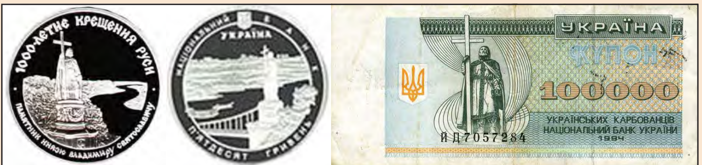
Іл. 5. Зображення пам'ятника князю Володимирі на радянській та українській ювілейних монетах та купоно-карбованці

Проекти монумента князю Володимирі розроблялися й іншими скульпторами. Так, М.С. Піменов (син скульптора С.С. Піменова) у 1850 році запропонував проект,