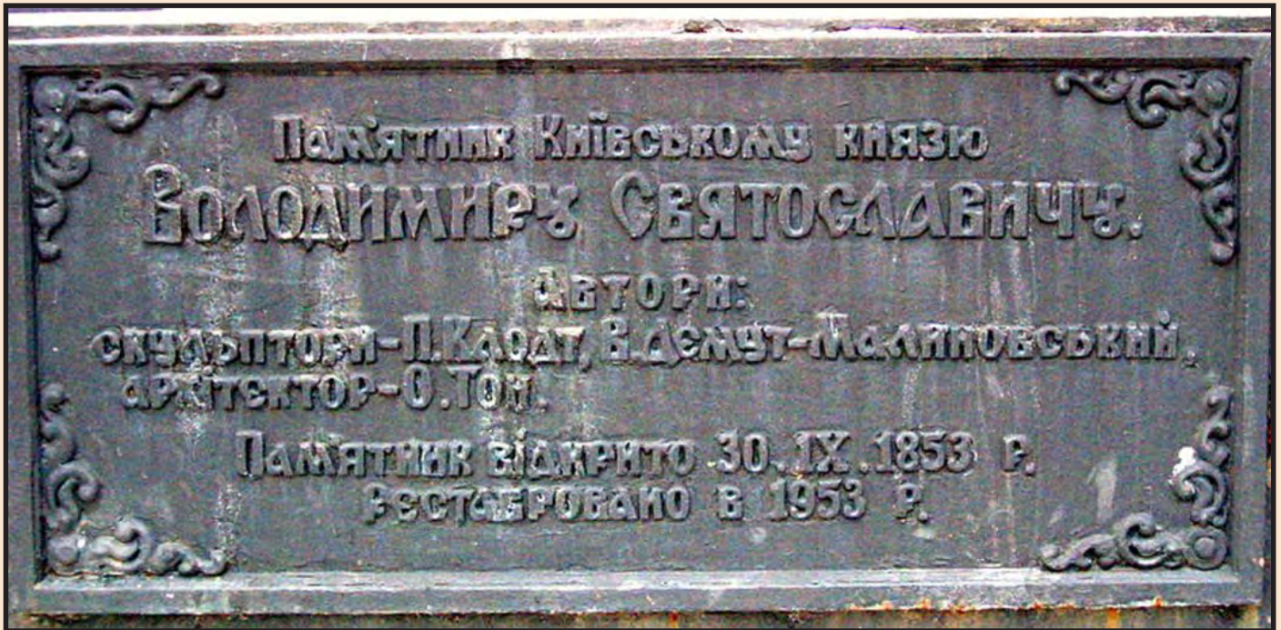
Іл. 4. Дошка, встановлена на пам'ятнику великому князю Володимирі Святославичу в м. Києві під час реконструкції 1953 року

и находили по его свету водяной путь в Город, к его пристаням. Зимой крест сиял в черной гуще небес и холодно и спокойно царил над темными пологими далями московского берега, от которого были перекинuty два громадных моста».