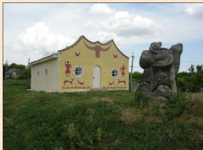
Іл. 6. Консерваційний павільйон над залишками будівлі трипільського часу

Крім окремих нерухомих архітектурних пам'яток, об'єктом музеєфікації в ДКЗ «Буша» став культурний ландшафт з унікальним наскельним рельєфом – дохристиянський скельний храм (іл. 4). Пам'ятку законсервовано (іл. 5). Головно Бушанський скельний комплекс з кінця XIX та протягом XX ст. досліджували В.Б. Антонович, В.М. Даниленко та І.С. Винокур. Повну