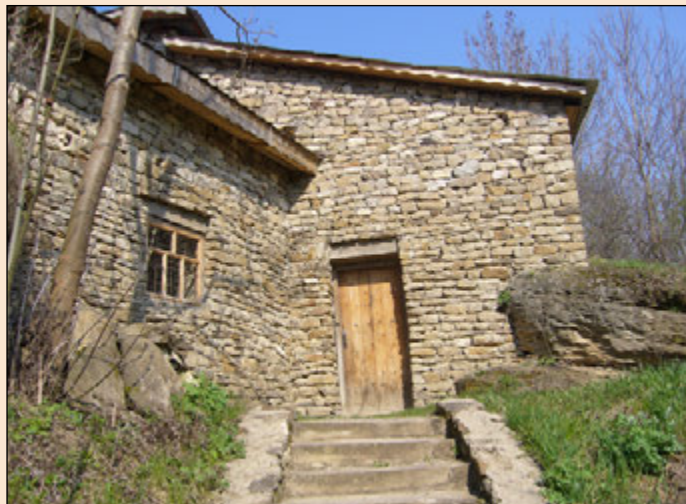
Іл. 5. Захисний павільйон над приміщенням скельного храму

І. Винокур робить припущення, що це була прямокутна в плані споруда площею 0,5 га. Замок мав шість веж, що сполучалися між собою підземними переходами. Одна з таких веж збереглася до нашого часу. Вона була квадратна в плані, побудована з каменю-пісковика, поклада якого досить значні в цій місцевості. У XIX ст. її частково реконструювали й використовували як дзвіницю. Під баштою зберігся склепінчастий льох, який, очевидно, сполучався з льохами інших замкових веж та з містом. Дослідник дійшов висновку, що кам'яні оборонні стіни замку, вежі з бійницями відповідали всім вимогам тодішньої військової техніки та способам ведення вогнепального бою. Недаремно польські офіцери називали Бушу «Малим Кам'янцем», прирівнюючи її укріплення до фортифікацій Кам'янця-Подільського [6, с. 105].