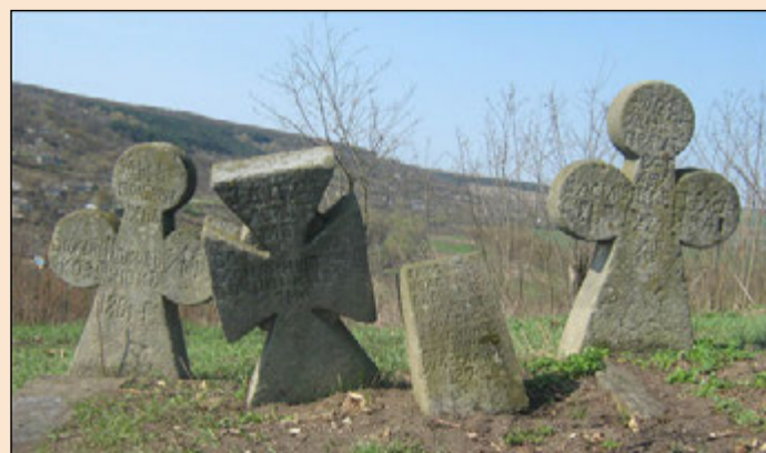
Іл. 2. Кам'яні хрести з кладовища кінця XVIII – XIX ст.

Найдавнішим культурним шаром Буші є поселення трипільської культури. Їх тут виявлено три: в урочищах Підмета, Причепилівка та в місці злиття річок Бушанки і Мурафи. Перші два поселення займали високий корінний берег річок. На площі близько 280 × 110 м траплялося багато підйомного матеріалу, який чітко відноситься до Трипілля: крем'яні знаряддя праці, фрагменти кам'яних зернотерок та типова ліпна кераміка. Третє поселен-