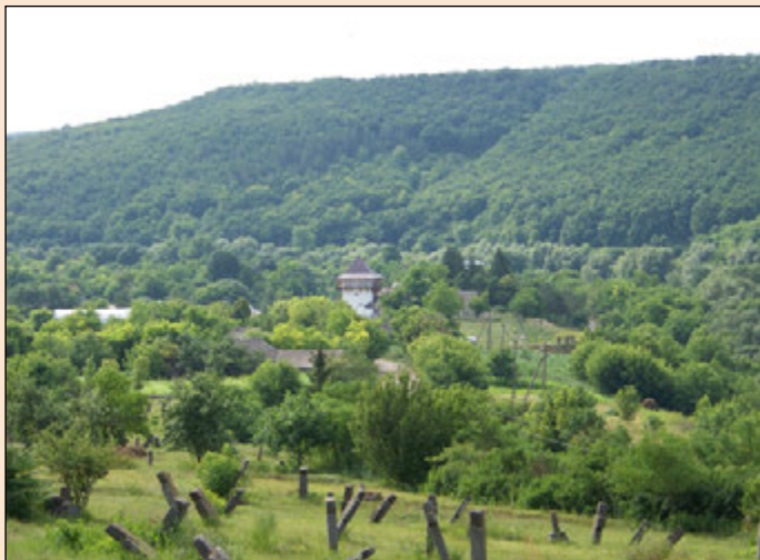
Іл. 3. Вигляд на територію пізньосередньовічного замку з території кладовища

ня розташовувалося на мисі, утвореному злиттям двох річок. Тут на площі в кілька гектарів виявлено набагато виразніший матеріал: уламки глиняної обмазки від жител, кераміка, антропоморфні та зооморфні статуетки, прясла для веретен та відтяжки до ткацького верстата. Варто зазначити, що в пізньому середньовіччі на цьому місці розташовувався замок [6, с. 99]. Саме це поселення доби розвиненого Трипільля розкопували С.М. Рижов, М.В. Потупчик та В.А. Косаківський [10].