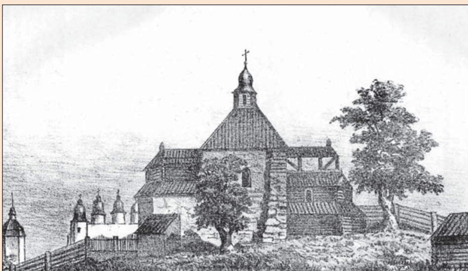
Рис. 1. Десятинна церква в Києві, відбудована Петром Могилою (за літографією середини ХІХ ст.)

Серединою ХІХ ст. датується літографія, на якій зображено малу Десятинну церкву в ім'я Різдва Пресвятої Богородиці. Як відомо, відбудова цього храму була ініційована Київським митрополитом свт. Петром Могилою у 1635 році, а освячення відбулося 1654 року [2, с. 63]. На літографії зображено двоповерхову споруду, що нагадує башту зі стрілчастим вікном, прибудовану до кам'яної стіни Десятинного храму (рис. 1). На задньому фоні розташовані прибудови незрозумілого призначення, у яких, особливо розташованій праворуч для глядача, можна побачити риси фортифікаційної споруди. Емпірично можна припустити, що літографія схематично передає риси однодільного одноверхого храму, характерного для