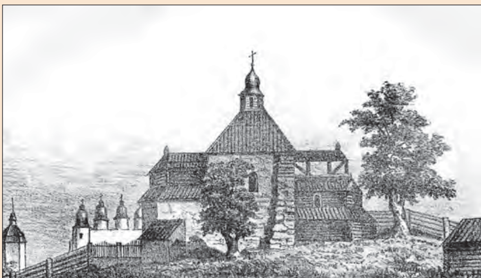
Рис. 1. Десятинна церква в Києві, відбудована Петром Могилою (за літографією середини ХІХ ст.)

Серединою ХІХ ст. датується літографія, на якій зображено малу Десятинну церкву в ім'я Різдва Пресвятої Богородиці. Як відомо, відбудова цього храму була ініційована Київським митрополитом свт. Петром Могилою у 1635 році, а освячення відбулося 1654 року [2, с. 63]. На літографії зображено двоповерхову споруду, що нагадує башту зі стрілчастим вікном, прибудовану до кам'яної стіни Десятинного храму (рис. 1). На задньому фоні розташовані прибудови незрозумілого призначення, у яких, особливо розташованій праворуч для глядача, можна побачити риси фортифікаційної споруди. Емпірично можна припустити, що літографія схематично передає риси однодільного одноверхого храму, характерного для