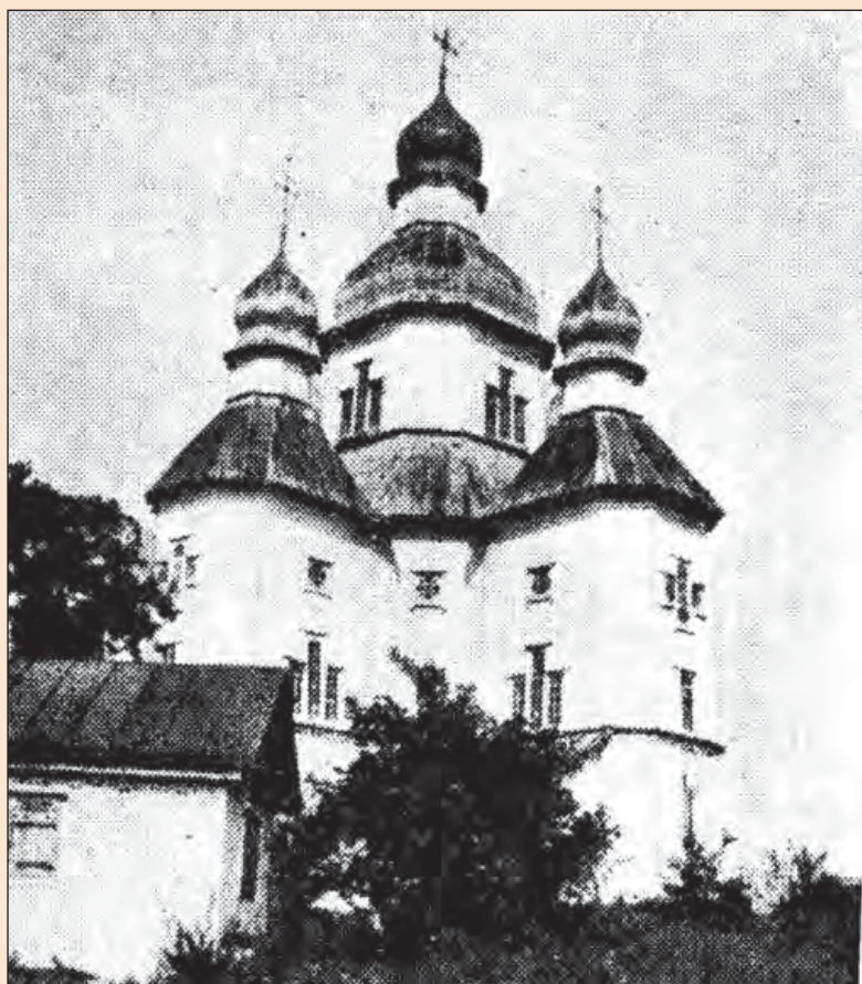
Рис. 4. Церква Покрови Пресвятої Богородиці. с. Білики (Полтавщина). Фото початку XX ст.

За межами фортеці, на Подолі, містилася Покровська церква, яка через свою віддаленість була також відома під назвою «Лісова» [10]. На плані В.Г. Ляскоронського її передано у вигляді п'ятидільної та одноверхої (рис. 2). Однак на відомих фотографіях (Г. Павлуцького, до 1889 р. та початку XX ст.) зображено п'ятидільний п'ятиверхий храм (рис. 4). Припускається, що її збудовано на рубежі XVII–XVIII ст., перша ж писемна згадка датована 1722 роком [10]. В.В. Вечерський роком будівництва церкви називає 1751 рік [2, с. 196]. Однак В.О. Мокляк відмічає, що 1751 року коштом білицького сотника Петра Тройницького та нехворощанського – Каленика Прокопієва – на місці вже існуючого храму збудовано новий – тридільний [10]. У 1781 та 1791 роках церкву перебудували. За останньої перебудови до західної дільниці храму було прибудова-