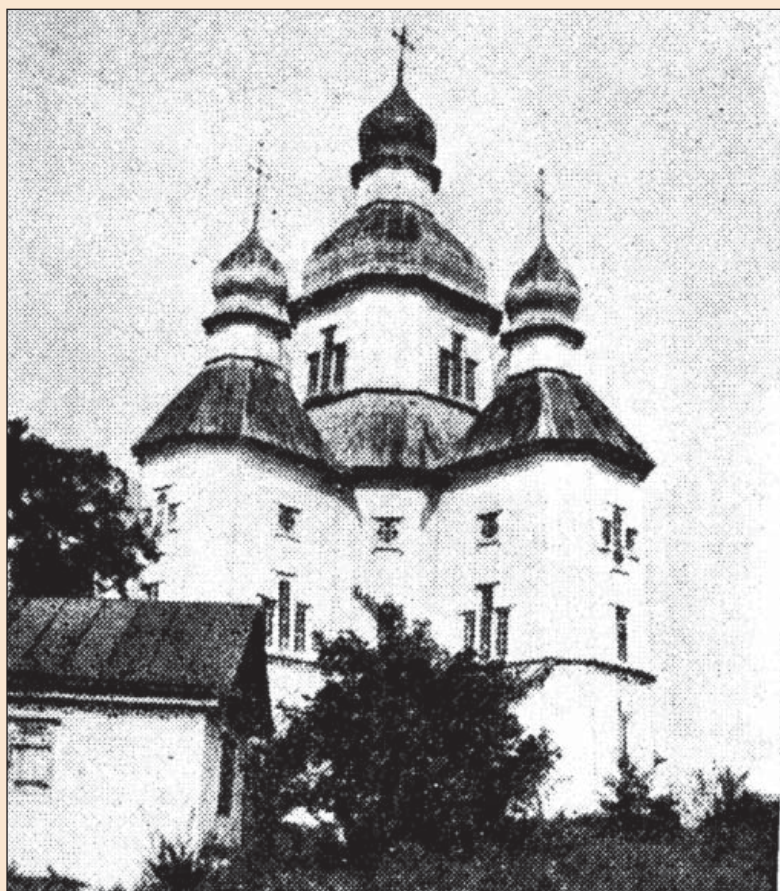
Рис. 4. Церква Покрови Пресвятої Богородиці. с. Білики (Полтавщина). Фото початку XX ст.

За межами фортеці, на Подолі, містилася Покровська церква, яка через свою віддаленість була також відома під назвою «Лісова» [10]. На плані В.Г. Ляскоронського її передано у вигляді п'ятидільної та одноверхої (рис. 2). Однак на відомих фотографіях (Г. Павлуцького, до 1889 р. та початку XX ст.) зображено п'ятидільний п'ятиверхий храм (рис. 4). Припускається, що її збудовано на рубежі XVII–XVIII ст., перша ж писемна згадка датована 1722 роком [10]. В.В. Вечерський роком будівництва церкви називає 1751 рік [2, с. 196]. Однак В.О. Мокляк відмічає, що 1751 року коштом білицького сотника Петра Тройницького та нехворощанського – Каленика Прокопієва – на місці вже існуючого храму збудовано новий – тридільний [10]. У 1781 та 1791 роках церкву перебудовували. За останньої перебудови до західної ділянки храму було прибудова-