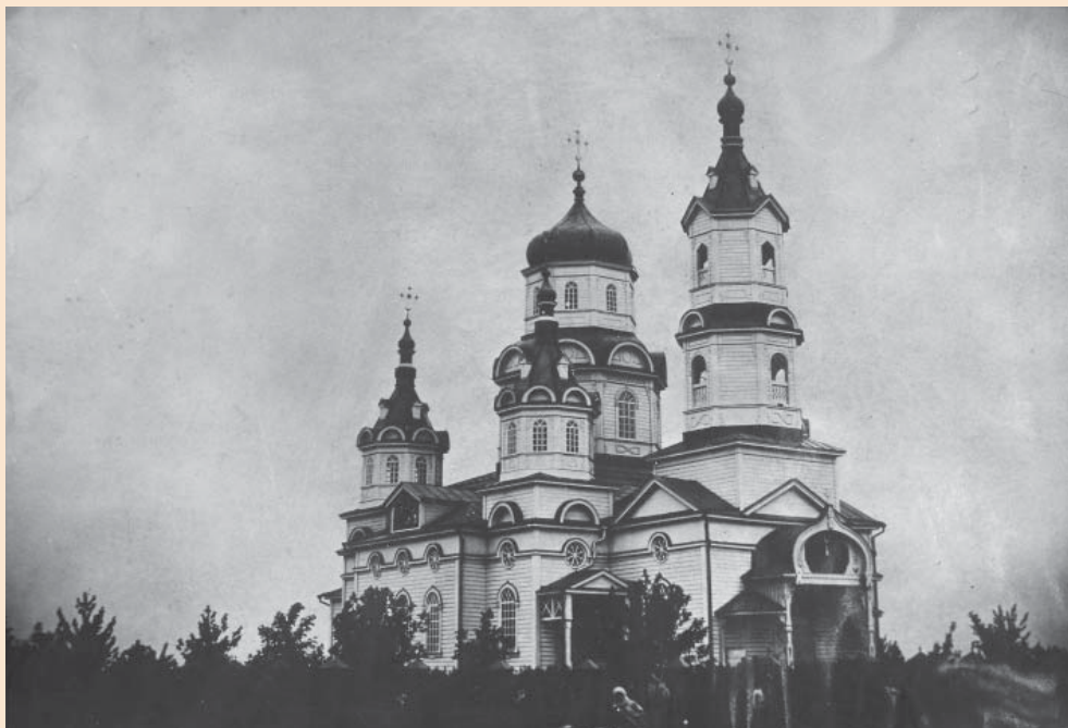
Рис. 3. Церква Святителя Миколи Мирлікійського. с. Білики (Полтавщина). Фото початку ХХ ст.

Південніше від каплиці на плані В.Г. Ляскоронського зображено однодільний одноверхий храм з підписом «Новая церков» [6, рис. 43]. На нашу думку, «Новою» могли називати церкву Святителя Миколая (з боковими приділами на честь Преображення Господнього і св. Феодосія), яку було збудовано 1750 року. Є відомості, що при перебудові її було зведено на місці Преображенської церкви, розібраної у 1868 році [7, с. 531]. В енциклопедичній замітці 1992 року Миколаївську церкву віднесено до п'ятиверхих, хрещатих у плані [7]. Однак у фондах Білицького художнього музею зберігається фото цього храму (од. зб. БХМ № 494, 26.01.86) 1 . На ньому зображено однодільну триверху церкву (два верхи над приділами) із прибудованою дзвіницею (рис. 3). У 1883 році церкву було перебудовано і в 1902–2003 роках збудовано нову – дерев'яну, холодну, з прибудованою дзвіницею [9]. Виходячи з останнього спостереження, можемо припустити, що до перебудови Миколаївський храм був однодільним та одноверхим, як і зображено на плані В.Г. Ляскоронського. У 1934 році церкву було зруйновано [7, с. 531].