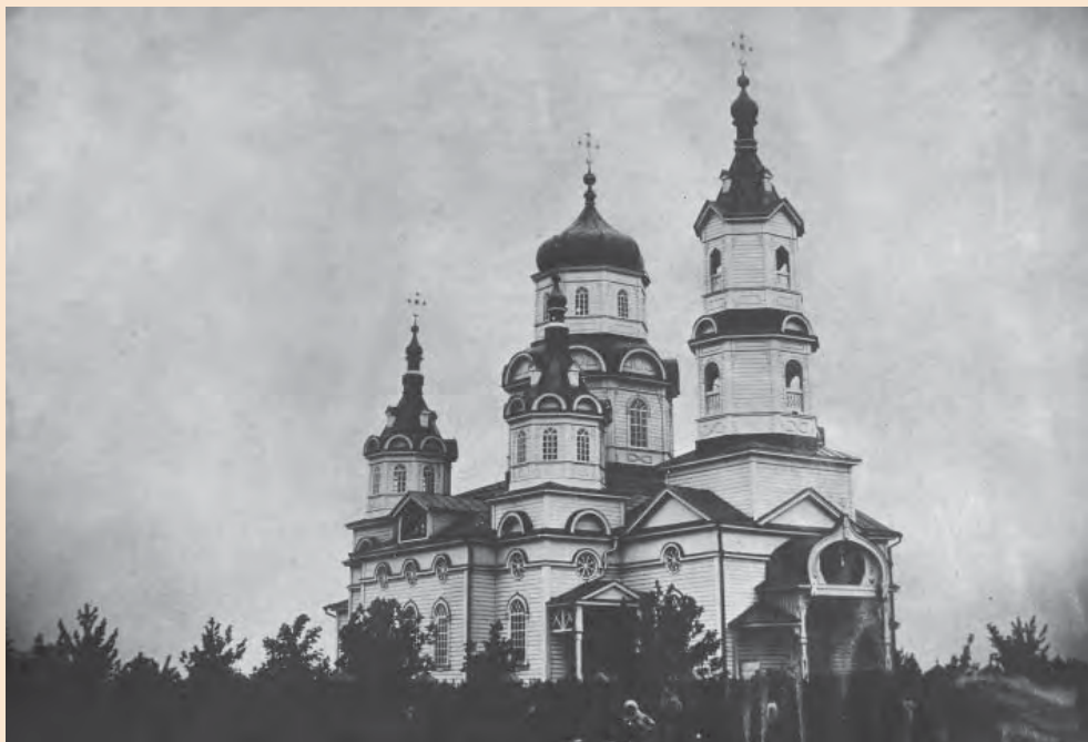
Рис. 3. Церква Святителя Миколи Мирлікійського. с. Білики (Полтавщина). Фото початку ХХ ст.

Південніше від каплиці на плані В.Г. Ляскоронського зображено однодільний одноверхий храм з підписом «Новая церков» [6, рис. 43]. На нашу думку, «Новою» могли називати церкву Святителя Миколая (з боковими приділами на честь Преображення Господнього і св. Феодосія), яку було збудовано 1750 року. Є відомості, що при перебудові її було зведено на місці Преображенської церкви, розібраної у 1868 році [7, с. 531]. В енциклопедичній замітці 1992 року Миколаївську церкву віднесено до п'ятиверхих, хрещатих у плані [7]. Однак у фондах Білицького художнього музею зберігається фото цього храму (од. зб. БХМ № 494, 26.01.86) 1 . На ньому зображено однодільну триверху церкву (два верхи над приділами) із прибудованою дзвіницею (рис. 3). У 1883 році церкву було перебудовано і в 1902–2003 роках збудовано нову – дерев'яну, холодну, з прибудованою дзвіницею [9]. Виходячи з останнього спостереження, можемо припустити, що до перебудови Миколаївський храм був однодільним та одноверхим, як і зображено на плані В.Г. Ляскоронського. У 1934 році церкву було зруйновано [7, с. 531].