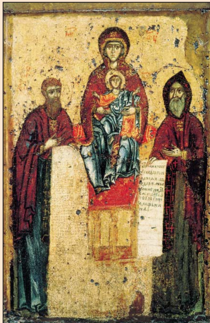
Ил. 2. Печерская-Свенская икона Пресвятой Богородицы

В конце XVII в. были составлены две «Службы» – святым Ближних и Дальних пещер [16]. В первой из них, вместе с прп. Николой Святошей – первым князем, принявшим на Руси постриг, – упоминались св. Владимир и его сыновья св. Борис и Глеб (под крестильными именами Роман и Давид) [37]. Хотя в Дальних пещерах