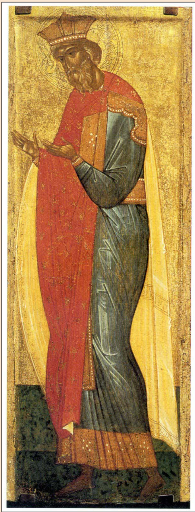
Ил. 1. Святой Владимир. Икона XV в.

(созданного в XIII–XV вв. из произведений XI–XIII вв. сборника житий древних Киево-Печерских святых) в состав одной из них – т. н. Феодосиевской (XV в.) – было включено сказание о крещении свв. равноапостольных князей Ольги и Владимира [7, с. 267–268].