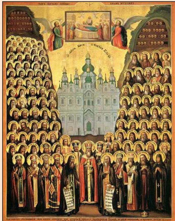
Ил. 4. Собор Киево-Печерских святых. Икона

кой церковью. В наши дни, при восстановлении Великой церкви (1998–2000), в ее новом иконостасе была установлена копия описываемой иконы [22].