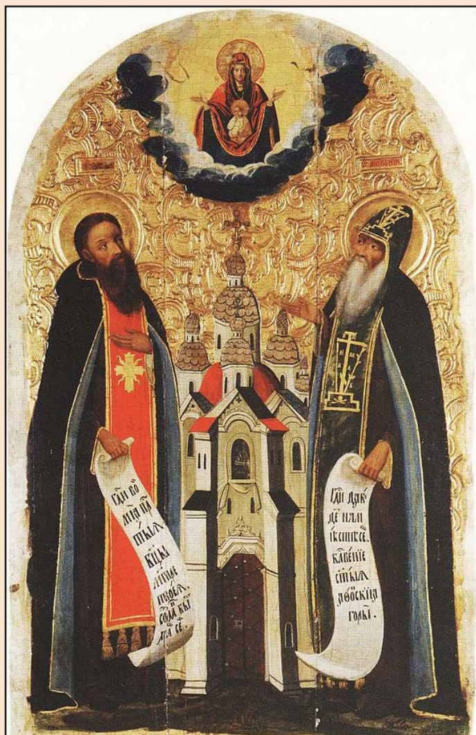
Ил. 3. Печерская-Свенская икона Пресвятой Богородицы

собраны в этом лабиринте [9, с. 204–245]. Служба святым Ближних пещер упоминает и других нелаврских подвижников, включая даже таких, чьи мощи никогда не переносили в лавру (в числе примеров – Киевские митрополиты XIV–XV вв. Петр, Алексий, Киприан, Фотий, Иона, Макарий, великомученица Варвара) [37].