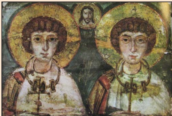
Святі Сергій та Вакх

матір з немовлям» і «Мученик та мучениця» – найбільш давні з усіх відомих християнських ікон, які збереглися до наших днів. Вони були створені задовго до розділення церков, тому їх духовний зміст є об'єднуючим для всього християнського світу. А оскільки доля решти колекції ікон архімандрита Порфирія, що залишалися в музеї Києво-Печерської лаври, невідома, ці експонати мають надзвичайну цінність для вивчення не лише візантійського живопису, а й діяльності самого Порфирія Успенського.