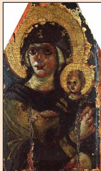
Богоматір з немовлям