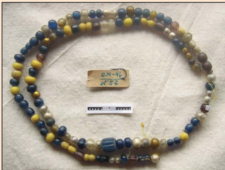
Іл. 4. Намисто з кургану середини X ст. Шестовиця.