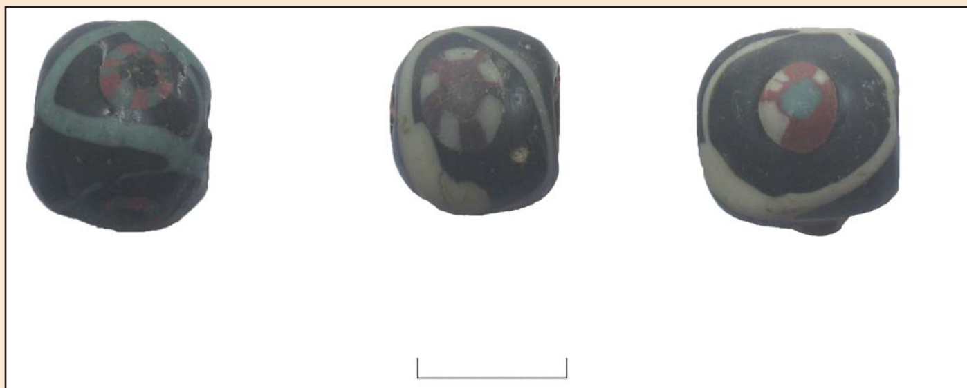
Іл. 2. Намистини з поховань Чернігівського могильника XI–XII ст. Розкопки 1988 р.

вічками чи складними вічками з війками, що складаються з розрізаних упоперек циліндрів, навколо вічок – опуклі скляні смужки, які утворюють петелькоподібний орнамент, що зафіксовані в поховальних комплексах Києва та Чернігова (іл. 2) [4, с. 109; 6, с. 140; 9, с. 81]. Припускають використання цих намистин як апотропеїв [3, с. 289]. Такі намистини не були широко розповсюджені так, як, наприклад, багаточастинні намистини з трубочок. Менша їхня кількість у намисті виокремлювала їх, робила більш цінними [7, с. 247].