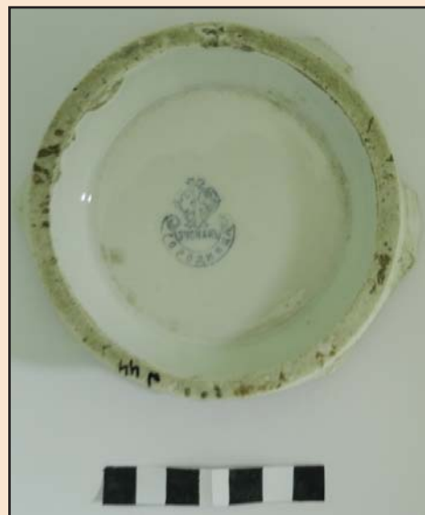
Ил. 17. Клеймо на изделии производства А.Ф. Зуссмана в Городнице