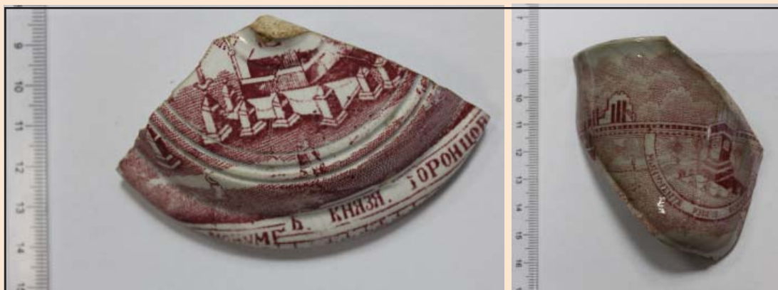
Ил. 14. Фрагменты посуды с архитектурно-топографической композицией

На фрагменте фаянсовой тарелки сохранилась растительная ассиметричная, темно-синего цвета композиция, выполненная в технике печати. На обратной стороне – кобальтовое клеймо с изображением кленового листа, в середине которого – надпись «FLORE», под листком – «F. SUSSMANN». Также на доньшке находится клеймо «1 SUSSMANN», вдавленное в тесто (ил. 15).