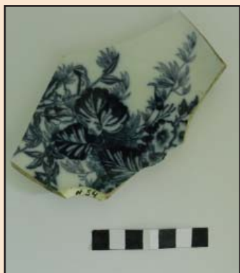
Ил. 8. Фрагмент фаянсовой тарелки, изготовленной в Будах «Т-ва М.С. Кузнецова»