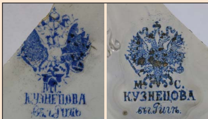
Ил. 5. Клейма Рижского завода «Т-ва М.С. Кузнецова»