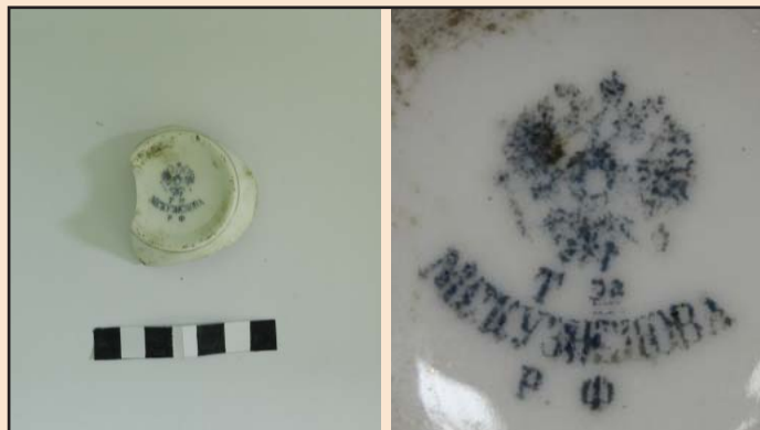
Ил. 3. Доньшко кофейной чашки с клеймом Рижского завода «Т-ва М.С. Кузнецова»