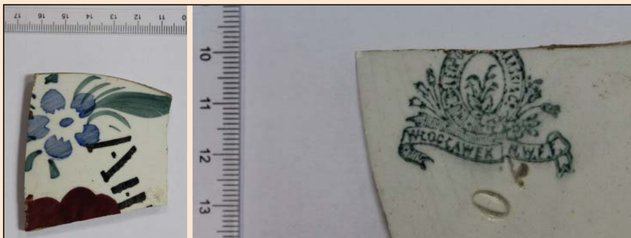
Ил. 20. Фрагмент фаянсового изделия с клеймом завода Л.Чаманского в г. Влацлавске