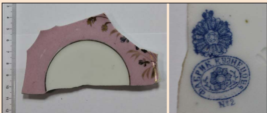
Ил. 13. Блюдце, изготовленное на фабрике И.Е. Кузнецова