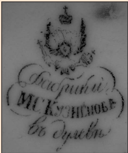
Ил. 1. Клеймо на чашке фабрики М.С. Кузнецова в Дулеве

ное клеймо – двуглавый орел с надписью в три строчки: «фабрики М.С. Кузнецова в Дулеве» (ил. 1). Такой тип клейма наносился на изделия завода в 1854–1864 годах.