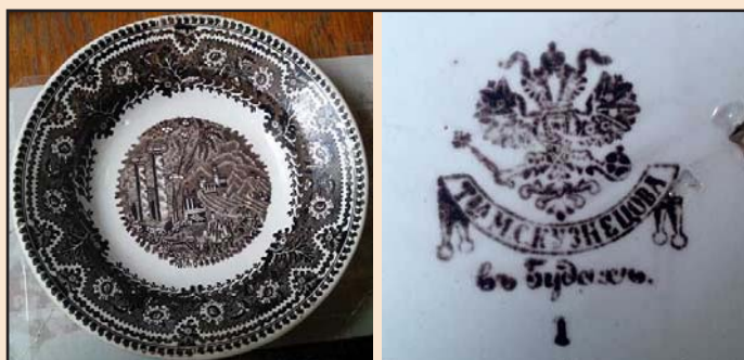
Ил. 10. Тарелка с архитектурно-городской композицией из Феодосийского музея древностей, изготовленная в Будах