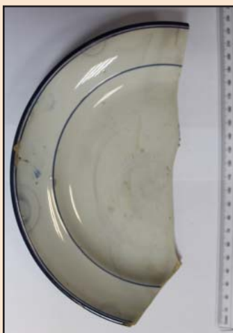
Ил. 4. Фрагмент фаянсовой тарелки, изготовленной на Рижском заводе «Т-ва М.С. Кузнецова»