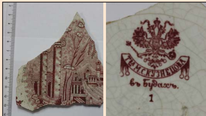
Ил. 9. Фрагмент тарелки с архитектурно-городской композицией, изготовленной в Будах «Т-ва М.С. Кузнецова»