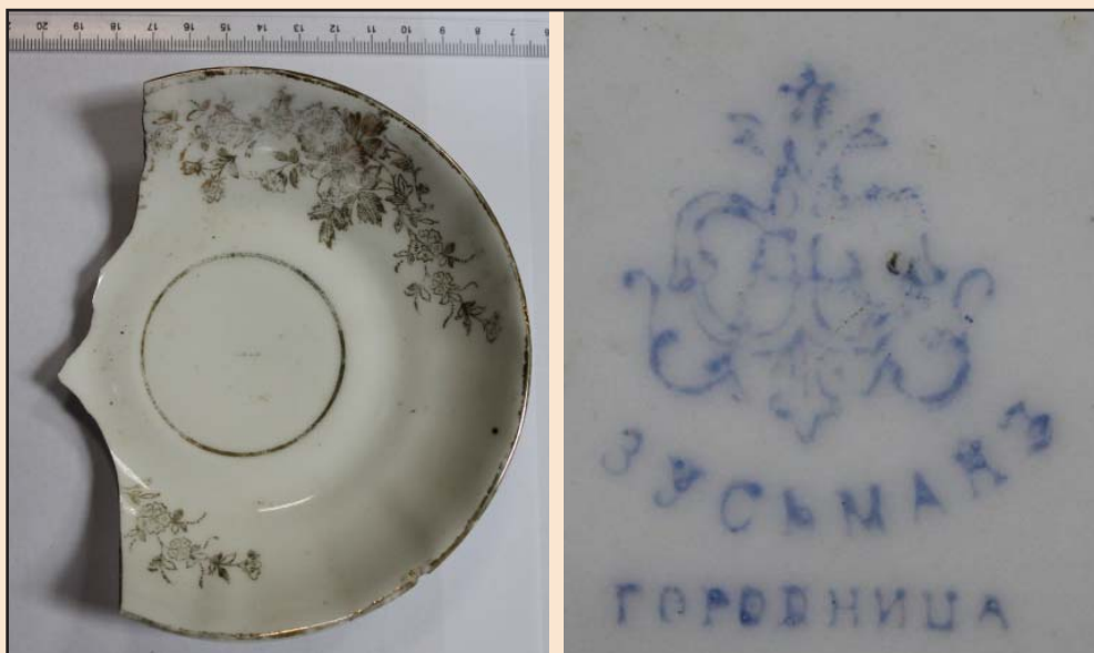
Ил. 18. Блюдце, изготовленное на производстве А.Ф. Зуссмана в Городнице

Еще один производитель представлен фрагментом фаянсового изделия (МІДЦ, НДФ, № 45) с клеймом завода Л. Чаманского (основан 1880 году в г. Влацлавске в Польше). На сохранившемся фрагменте – часть растительной композиции, расписанной тремя красками – голубой,