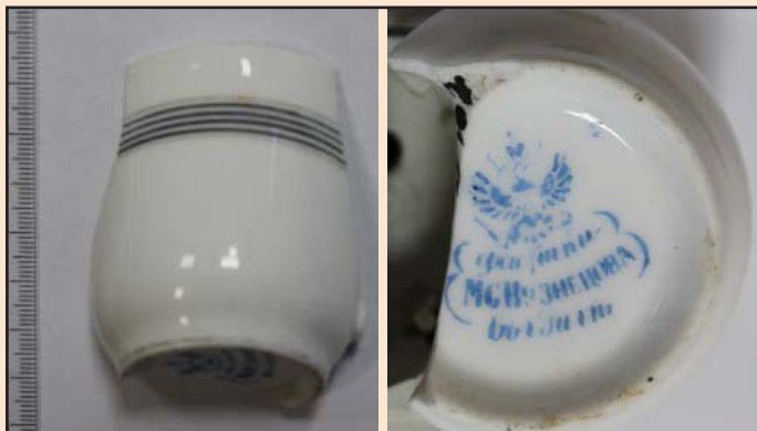
Ил. 2. Фрагмент чашки кофейной с клеймом, изготовленной на Рижском заводе «Т-ва М.С. Кузнецова»