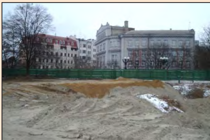
Лл. 14. Консерваційне засипання розкопу піском зверху. 26 грудня 2011 р.