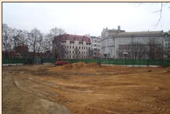
Лл. 15. Консерваційне засипання розкопу глиною зверху. 26 грудня 2011 р.