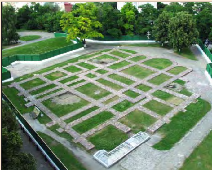
Іл. 1. Загальний вигляд викладки плану фундаментів Десятинної церкви. На передньому плані під склом – експонування частини збережених фундаментів. Видно місця перших шурфів. Липень 2005 р.