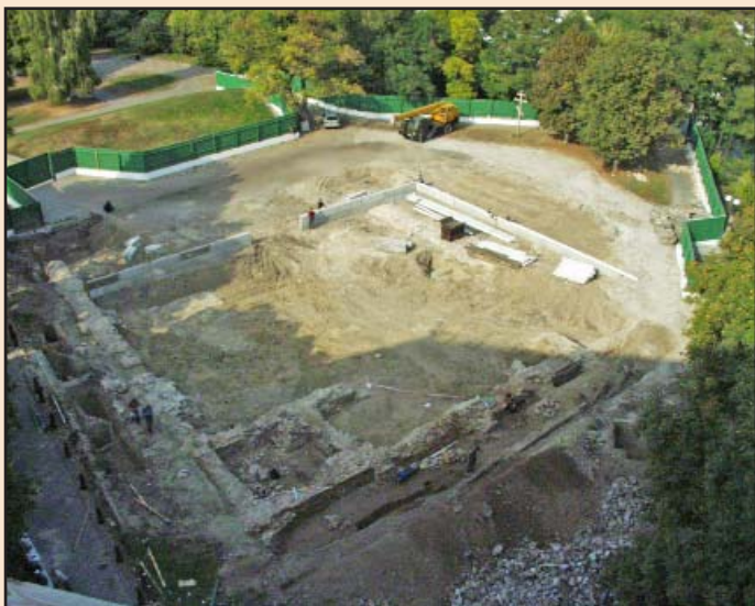
Іл. 3. Місце Десятинної церкви після зняття верхнього баласту. Видно збережені фундаменти X ст. Уже встановлено бетонні блоки підмурків майбутнього павільйону. Паркан ліворуч вже пересунуто. Вересень 2005 р.