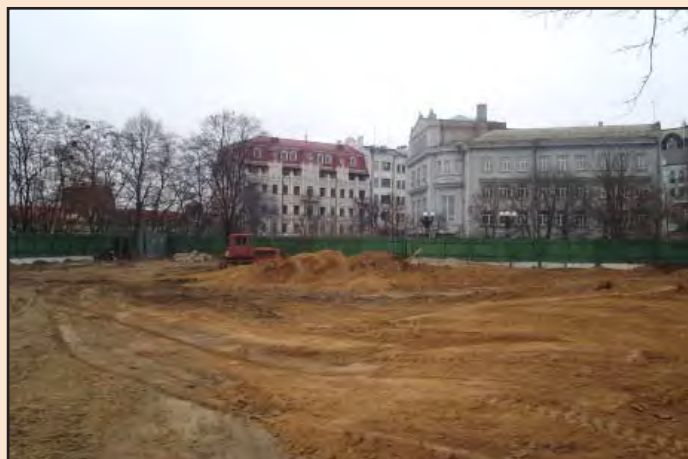
Лл. 15. Консерваційне засипання розкопу глиною зверху. 26 грудня 2011 р.