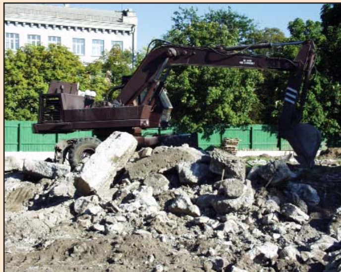
Іл. 2. Екскаватор прибирає бетонну заливку, що розташовувалася в основі викладки 1982 р. плану Десятинної церкви. Серпень 2005 р.