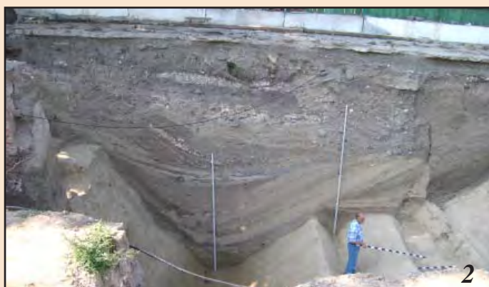
Лл. 10. Найглибша ділянка рову. Рейки біля стінок мають висоту 4 м. 1 – О. Комар, О. Манігда і В. Івакін; 2 – В. Козюба