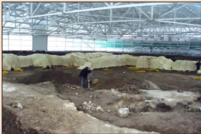
Лл. 5. Утеплювання давніх фундаментів на зиму. Листопад 2005 р.

Знаємо стільки, скільки пам'ятаємо Знаєм стільки, скільки помним Tantum scimus, quantum memoria tenemus