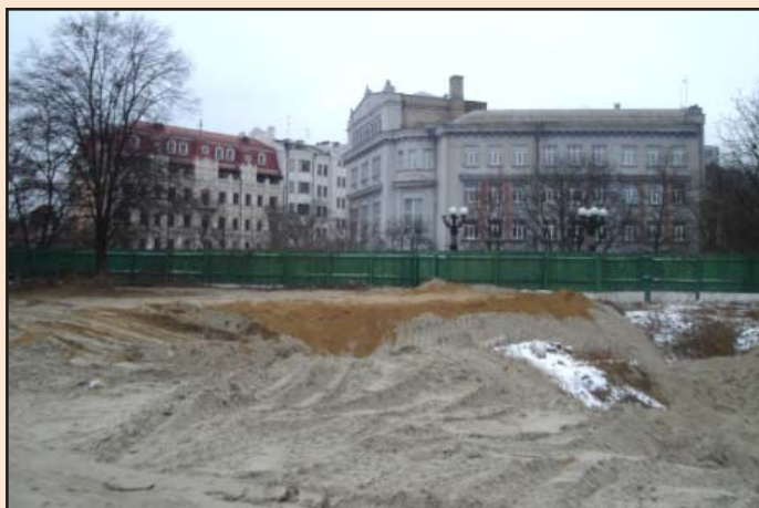
Лл. 14. Консерваційне засипання розкопу піском зверху. 26 грудня 2011 р.