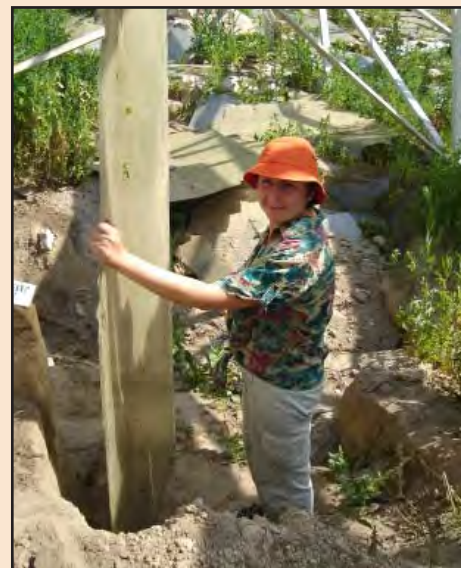
Лл. 9. Початок досліджень на одній з ділянок усередині зруйнованого павільйону. Червень 2010 р.