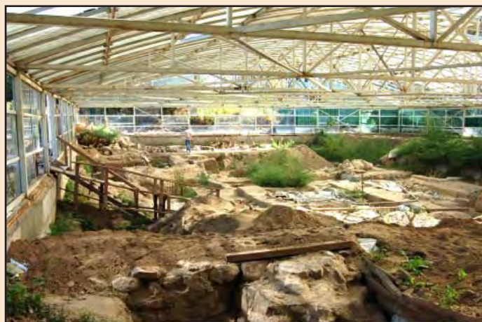
Лл. 6. Початок засипання фундаментів всередині павільйону. 2009 р.