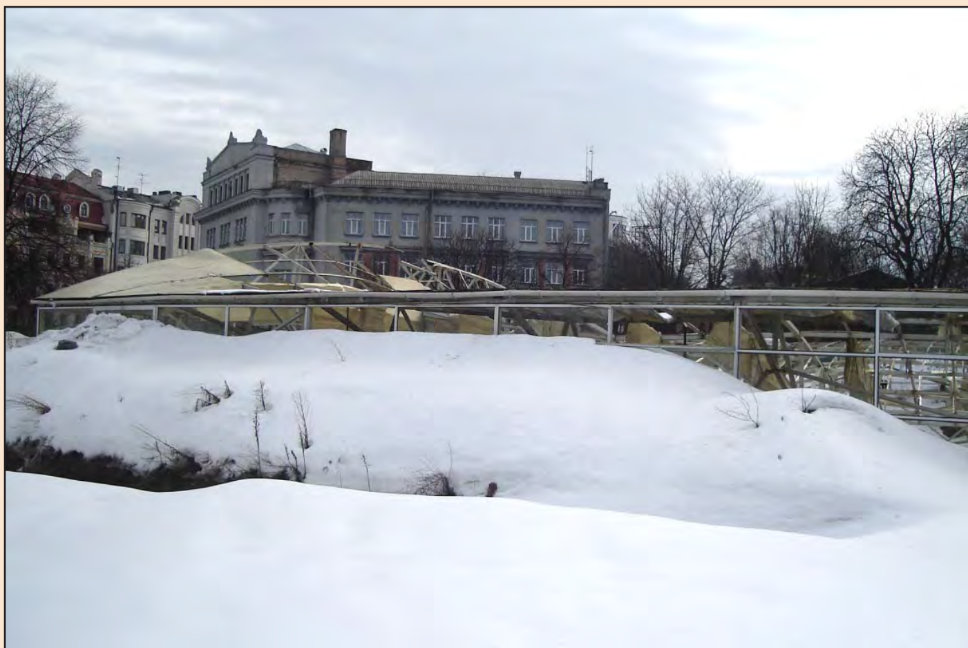
Лл. 7. Снігові замети біля павільйону. Лютий 2010 р.