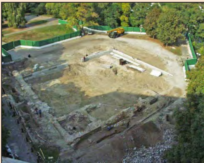
Іл. 3. Місце Десятинної церкви після зняття верхнього баласту. Видно збережені фундаменти X ст. Уже встановлено бетонні блоки підмурків майбутнього павільйону. Паркан ліворуч вже пересунуто. Вересень 2005 р.