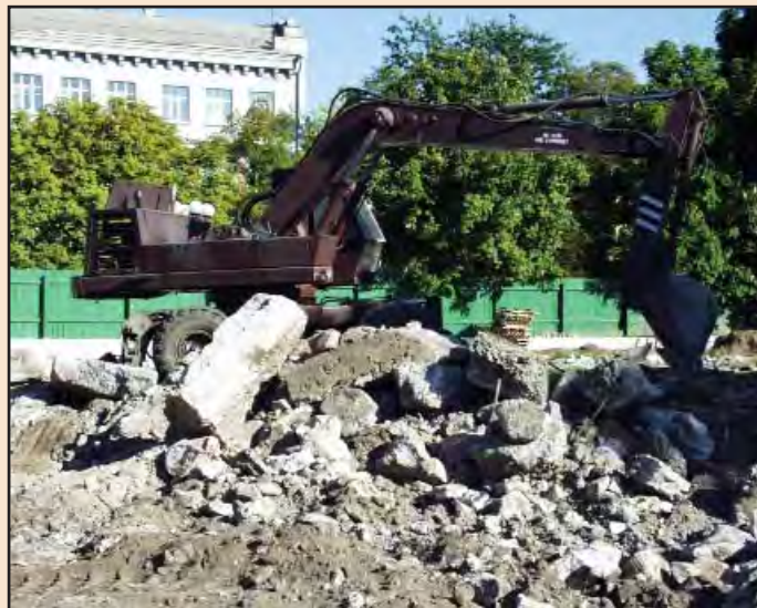
Іл. 2. Екскаватор прибирає бетонну заливку, що розташовувалася в основі викладки 1982 р. плану Десятинної церкви. Серпень 2005 р.