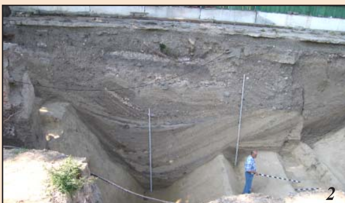
Лл. 10. Найглибша ділянка рову. Рейки біля стінок мають висоту 4 м. 1 – О. Комар, О. Манігда і В. Івакін; 2 – В. Козюба