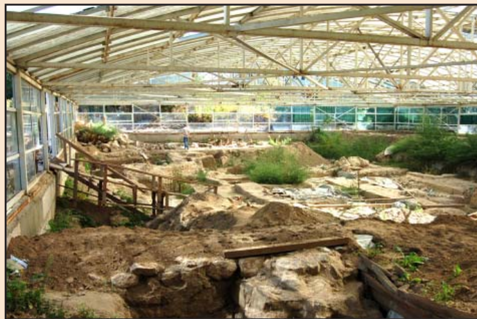
Лл. 6. Початок засипання фундаментів всередині павільйону. 2009 р.