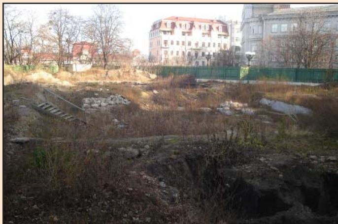
Лл. 12. Загальний вигляд місця розкопок після їх завершення. 2 грудня 2011 р.