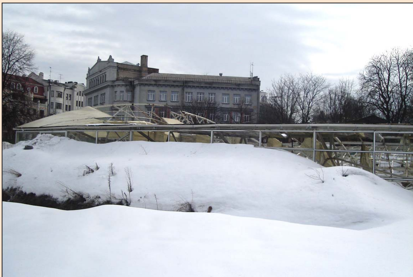
Лл. 7. Снігові замети біля павільйону. Лютий 2010 р.