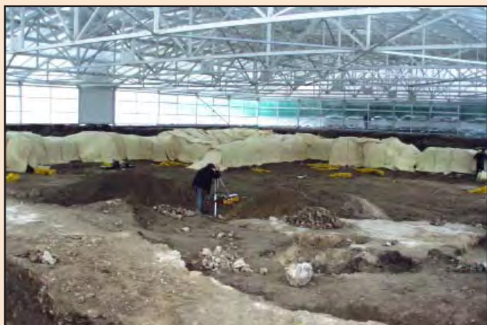
Лл. 5. Утеплювання давніх фундаментів на зиму. Листопад 2005 р.

Знаємо стільки, скільки пам'ятаємо Знаем столько, сколько помним Tantum scimus, quantum memoria tenemus