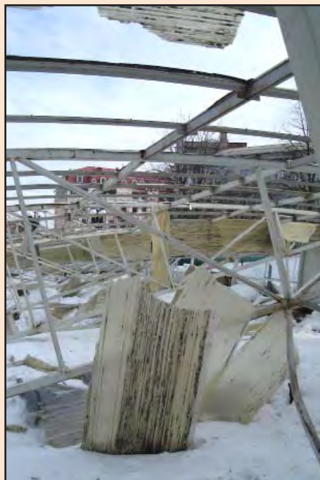
Лл. 8. Внутрішній простір павільйону після руйнації даху. Лютий 2010 р.