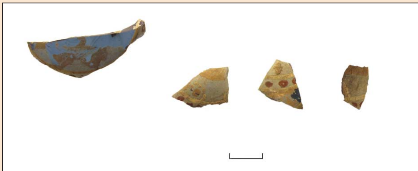
Іл. 2. Уламки посудини візантійського виробництва.

Браслети (табл. 1) складають найчисленнішу групу прикрас (87 екземплярів) і представлені різноманітними типами: круглі гладкі (виготовлені з круглого в перерізі скляного джгута), круглі перевиті (на гладкий джгут браслета накладалася смуга із жовтого непрозорого скла), кручені (виготовлявся з квадратного в перерізі джгута, який