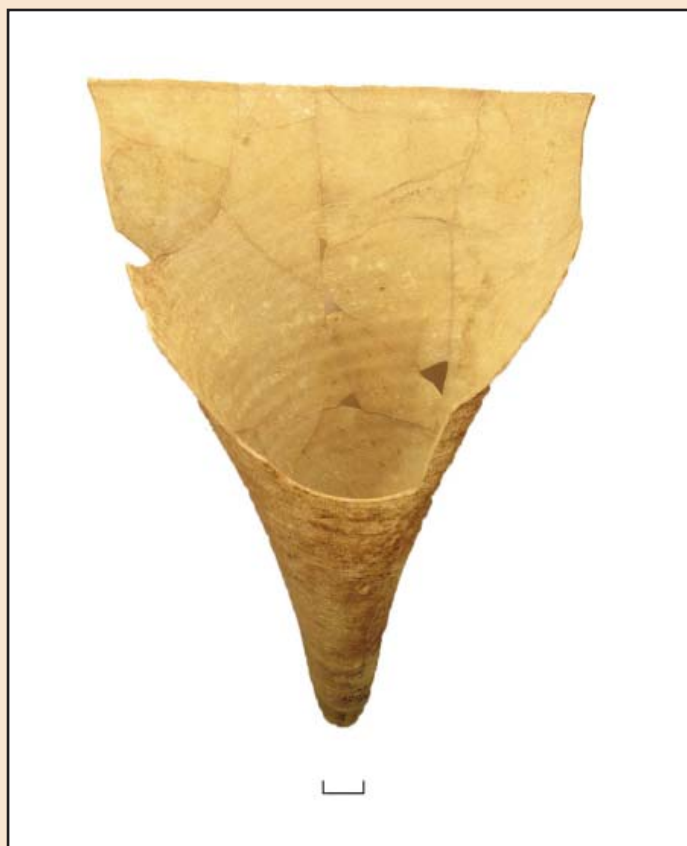
Іл. 1. Реставрована лампа.

але більш вірогідним дослідники вбачають їхнє використання як лампад, які вставляли у хорос [9, с. 102]. Одна з таких посудин реставрована (іл. 1). Цей тип посудин