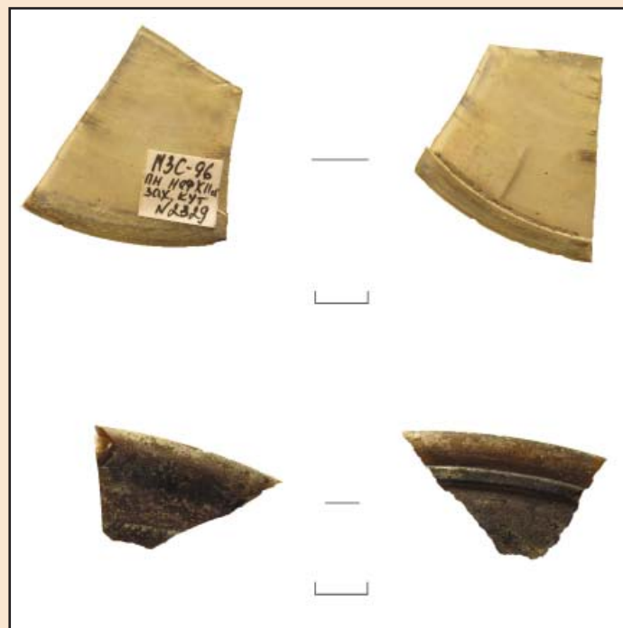
Іл. 4. Фрагменти віконниць.

імовірно, частина віконниці або вітражу [5, с. 201]. Загалом знайдено 5 екземплярів, які походять з об'єктів XII та кінця XII – середини XIII ст. Виготовлення віконниць відбувалося кількома способами: шляхом швидкого обертання відкритого конусу