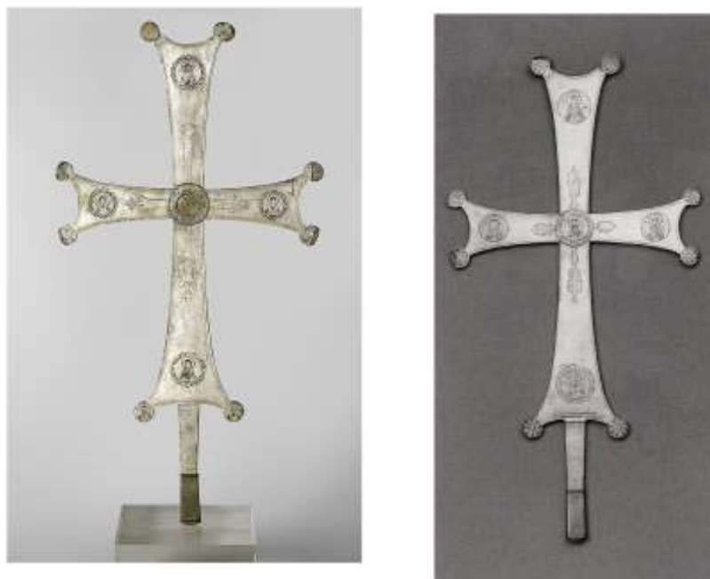
Срібний хрест з Адріанополя. Кінець X ст. Музей Бенакі в Афінах. [За: The Glory, 1997, no. 23]

у яких вони зберігалися (хрест із лаври Святого Афанасія на Афоні [Grabar, 1969, р. 99–125]).