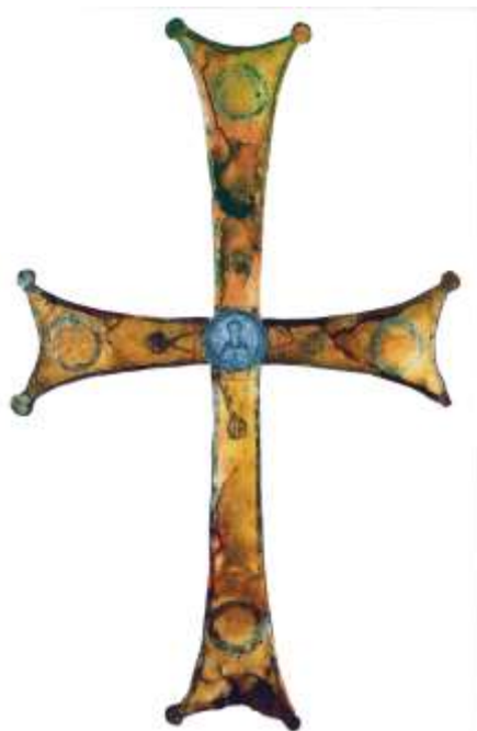
Реконструкція хреста з Десятинної церкви з медальйоном зі св. Феодором [За: Pekarska, 2011, pl. 9.9]

році до Австрії, а потім – до Німеччини 2 . Таким чином, медальйон і хрест нині існують окремо один від одного [Ross, 1962, p. 24–25, pl. XXIII; Пекарська, Павлова, 2004, с. 96–97; Pekarska, 2011, p. 236–238].