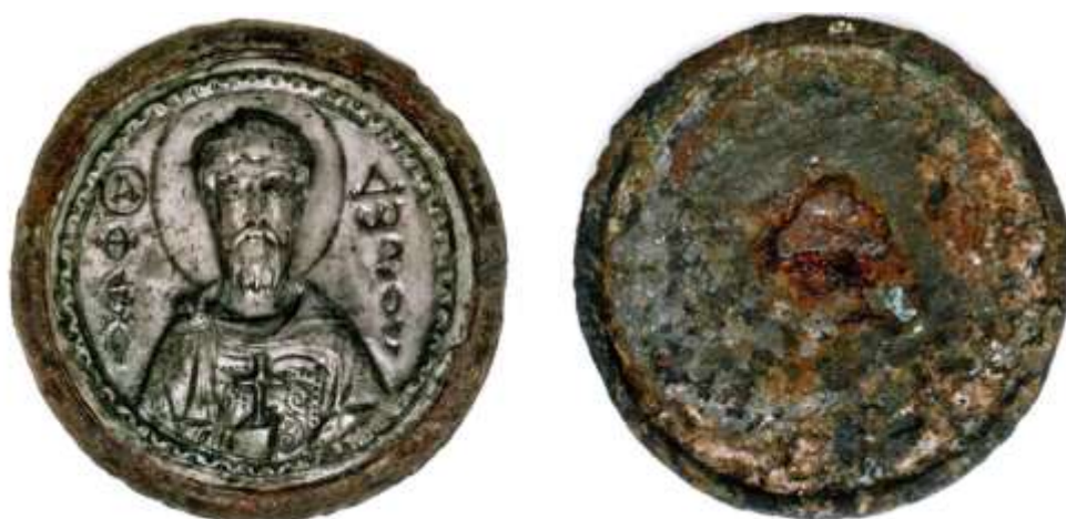
Срібний медальйон з карбованим рельєфним зображенням св. Феодора. [За: Дамбартон Окс, Асс. № 49.8; Пескова, Строкова, 2012, с. 163]

Медальйон виготовлено з дуже тонкого листового срібла і розміщено на бронзовій опуклій основі круглої форми, але дещо більшого діаметра. Розмір срібного медальйона –