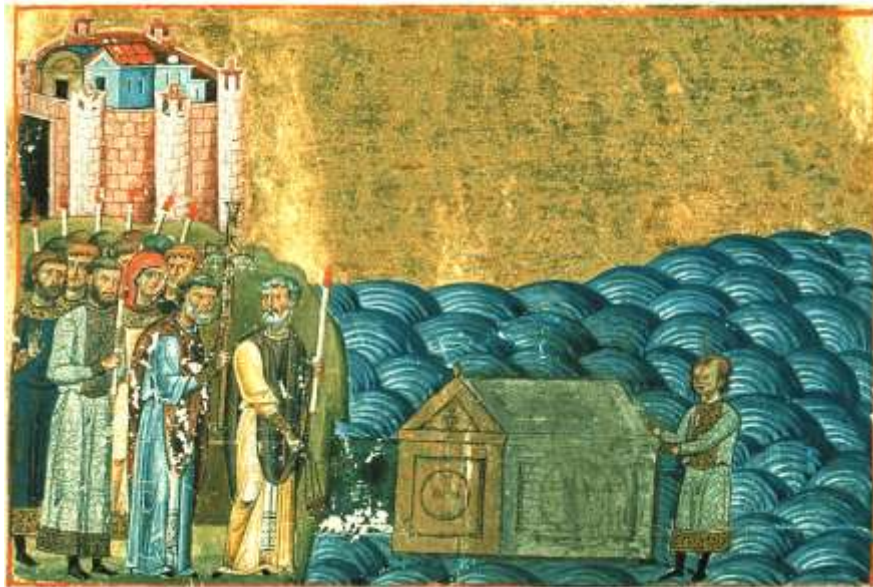
Набуття мощей Климента Римського. Мінологій Василя II. Кінець X – початок XI ст. (Vatic. Gr. 1613, fol. 14265)

Її зауваження не позбавлене логіки, адже храм Федорівського монастиря не зазнав такого ушкодження, як Десятинна церква, і поховати загиблих могли саме монахи цього монастиря. Водночас існуючі аналогії підтверджують датування хреста кінцем X – початком XI століття, а місце й умови знахідки вказують на його відношення до Десятинної церкви [Пескова, Строкова, 2012, с. 52].