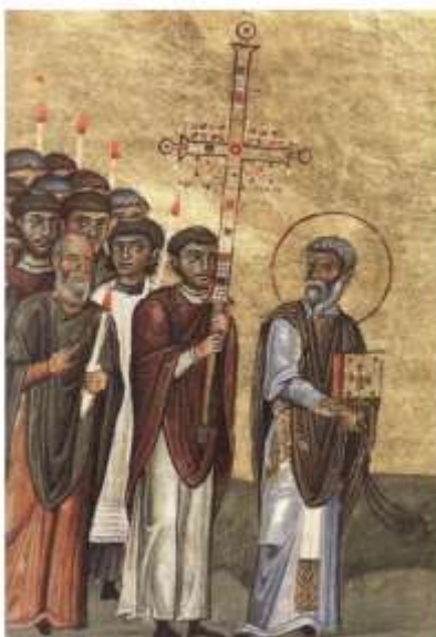
Щорічна процесія 26 жовтня в Константинополі на спогад про землетрус 740 року. Мінологій Василя II. Кінець X – початок XI ст. Vatic. Gr. 1613, fol. 14265

Звичайно, подібні візантійські процесійні хрести з лицьового боку оздоблювали медальйонами з Деїсусом. По горизонталі розміщували зображення Христа – у середохресті, обабіч – Богоматір та Іоанна Хрестителя, по вертикалі – архангелів Михаїла і Гаврила. Саме так, найвірогідніше, було прикрашено й лицьовий бік хреста з Десятинної церкви. На зворотному боці найчастіше були зображені вибрані святі. Оскільки подібні процесійні хрести у Візантії використовували не тільки в богослужінні, а й під час імператорських церемоній і військових кампаній, серед вибраних святих зображували також воїнів (Новгородський хрест і хрест із лаври Святого Афанасія на Афоні, XI ст.). Тому зображення святого мученика Феодора в центральному медальйоні, найвірогідніше, прикрашало зворотний бік хреста з Десятинної церкви.