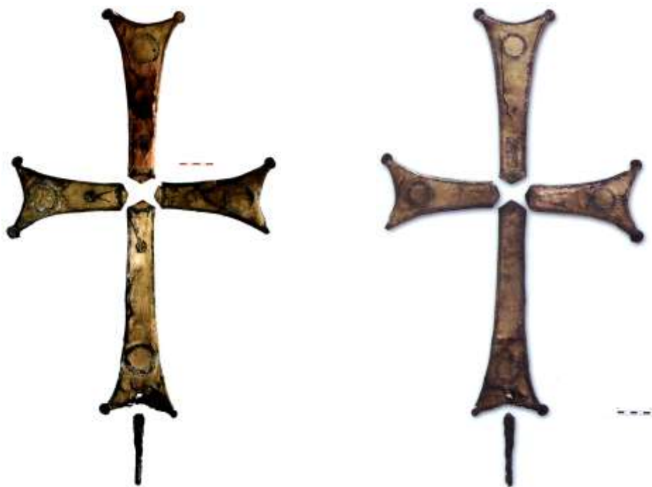
Лицьовий і зворотний боки процесійного хреста з Десятинної церкви [За: Пескова, Строкова, 2012, с. 160–161]

сліди припою. Виходячи із цих слідів, центральні медальйони були більшими, і до них примикали декоративні накладки, що утворювали хрестоподібні фігури з раменами різної форми: трапецієподібними (збереглися сліди від трьох, окрім нижнього) і видовженими трикутними, із шестипелюстковими розетками в колі на кінцях (збереглися дві – знизу й ліворуч). Такі самі розетки прикрашали диски на трикутних виступах перекладин самого хреста (збереглася одна).