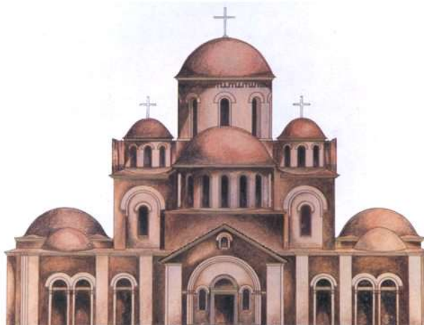
Західний фасад Десятинної церкви. Реконструкція М. Холостенка

відобразити її місіонерське значення, стали еталоном, а в деяких випадках взірцем для храмів Давньої Русі. На жаль, церква проіснувала тільки два з половиною століття – 1240 року, під час штурму Києва ханом Батием, коли під склепіннями Десятинної церкви кияни шукали порятунку, її було зруйновано. Але й після руйнування пам'ять про цю східнослов'янську святиню не була втрачена, а територія залишилася сакральною для віруючих.