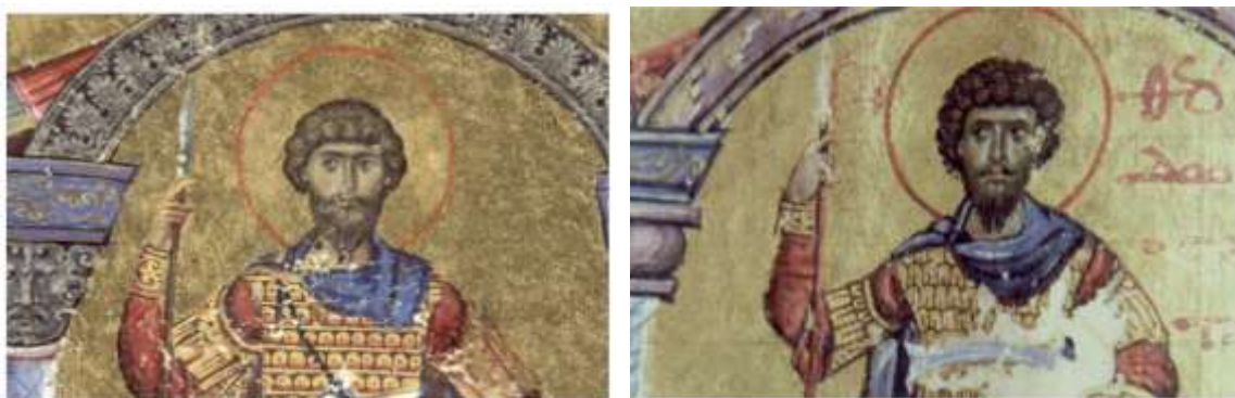
Святий Феодор Стратилат.

Святого зображено погрудно, фронтально, як мученика – з чотириконечним хрестом, якого він тримає перед собою зігнутою в лікті правицею. У святого видовжене обличчя, круглі, широко поставлені очі із заглибленими крапками зіниць, прямий ніс із тонким переніссям, розширений внизу трикутником, із трикутними заглибленнями ніздрів. Волосся коротке, кучеряве, великі локони майже круглої форми закривають половину лоба. Вуса довгі, невелика борода поділена на окремі пасма. Святий одягнений у хітон з довгими рукавами і хламиду, скріплену на правому плечі фібулою і прикрашену узорчастим табліоном, який вказує на високий соціальний статус св. Феодора.