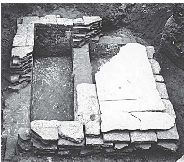
Іл. 2. Двокамерний плінфований саркофаг із храму Кловського монастиря XI ст.

Кловський храм, як і багато інших київських культових споруд, слугував усипальницею. Під час розкопок було відкрито кілька гробниць, серед яких і двокамерний саркофаг із плінфи (іл. 2). Про поховання в соборі свідчать і писемні джерела, зокрема, літописна стаття під 1112 роком повідомляє про поховання в Кловському храмі володимирського князя Давида Ігоровича.