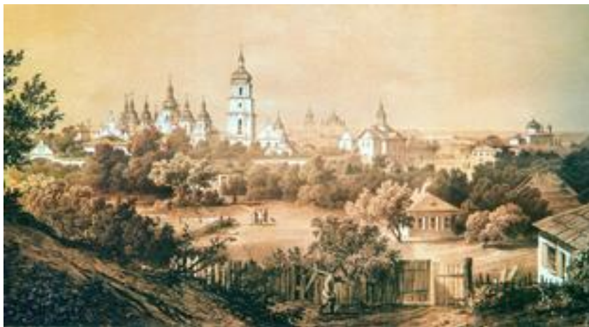
Вигляд на Старий Київ з Ярославового валу. З гравюри В. Тімма 1954 р.

окон. Через несколько минут раздался голос в комнатах дома: “Человек! окна затвори!” <...> Через несколько минут после сего раздается крик ямщика: “Пади!”, раздвигается толпа, к воротам подлетает тройка. Лошади в мыле и шатались. С телеги соскакивает офицер весь в пыли и грязи, эполет не видно, так как тогда они были висячие. На встречу ему выбежали придворные и военные из царской свиты. Ведут к государю. Через 10 минут возвращается приезжий, – и его обнимают и целуют военные и штатские. Кто бы это был такой? И за что целуют его, пыльного и грязного? – Через четверть часа узнаем: это – курьер из действующей армии, с ключами крепости Силистрии. Несколько окон растворилось в квартире государя. Выбежал военный и, согнувшись, пробежал по толпе с криком: ура! За ним грянула толпа, которой до сих пор запрещено было приветствовать государя этим криком, даже при подъезде его к Лавре). На другой день праздновано было взятие крепости Силистрии. На валах старого Киева (тогда эта часть города была обнесена крепостным валом, а на месте Крещатицкой улицы был луг, на котором паслись коровы; за Золотыми Воротами стлалась покатиная равнина с зеленою муравою; она оканчивалась ручьем Лыбедью; за Лыбедью – тоже равнина, оканчивалась митрополичьею рощею) – появились пушки, из которых дан был 101 выстрел». Микола I попрямував до Софійського собору, де його зустрівач клір на чолі з митрополитом Київським Євгенієм (Болховітіновим) і де було відслужено подячний молебень.