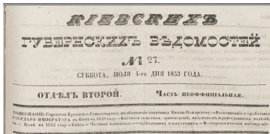
Газета «Киевские губернские ведомости» за 4 липня 1853 р.

Улітку 1853 року на сторінках «Киевских губернских ведомостей» було надруковано статтю, до якої додано листа: «В соборном храме Св. Софии хранятся трофеи победы: ключ покоренной крепости Силистрии и три знамени <...>, – нагадував автор статті. – Едва протекло четверть века от этого события [урочистої церемонії. – Т. А.], как уже многие личные свидетели этого торжества сокрылись в вечность и остается в памяти у немногих, когда и как эти трофеи поступили в древнейший храм, нашей древнейшей столицы Православной Руси».