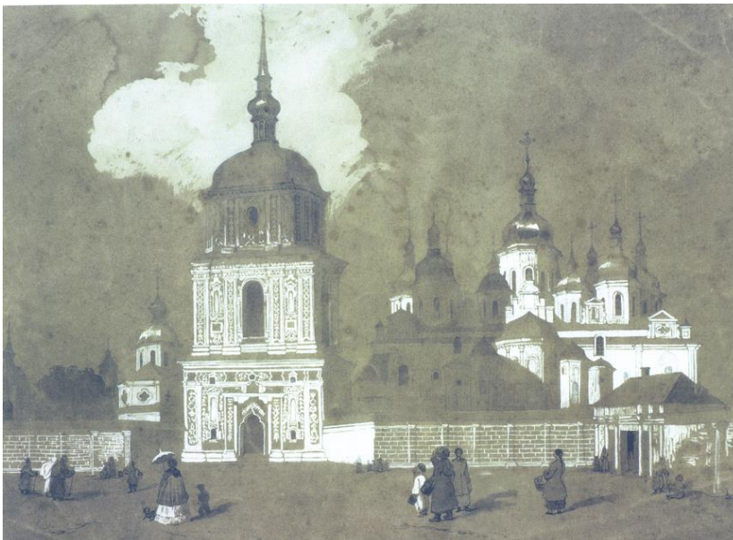
Софія Київська. З малюнка Т. Шевченка 1846 р.