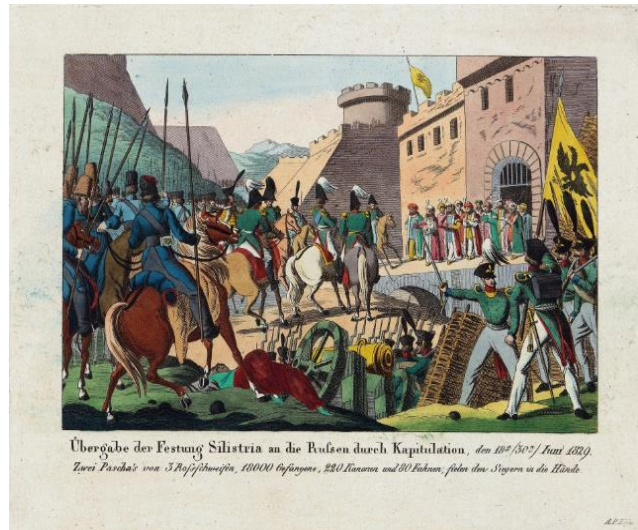
Капітуляція фортеці Сілістрія. З офорту 1829 р.

У літературі можна натрапити лише на короткі згадки про них, але історичні джерела – спогади, офіційні документи, газети – надають можливість дізнатися досить цікаві подробиці появи цих предметів у давньому соборі Києва. Йдеться про прапори та ключ фортеці Сілістрія, під якою була здобута перемога в 1829 році 3 .