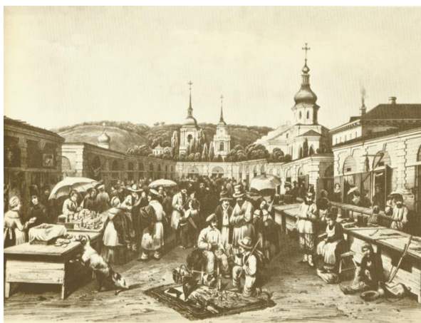
Товкучий ринок на Подолі. З літографії М. Сажина 1840-х рр

процесії охопив «головні вулиці міста» з урахуванням історично сформованого поліцентризму Києва: до нього ввійшли, крім печерських і старокиївських, цілий ряд вулиць і площ Подолу, які не мали адміністративної значущості, але були топографічними домінантами міста і традиційними місцями збору мешканців – ринкові площі, найбільш впорядковані вулиці, що проходили поблизу монастирів, будинків, які виділялися своїм архітектурним виглядом на тлі загальної забудови.