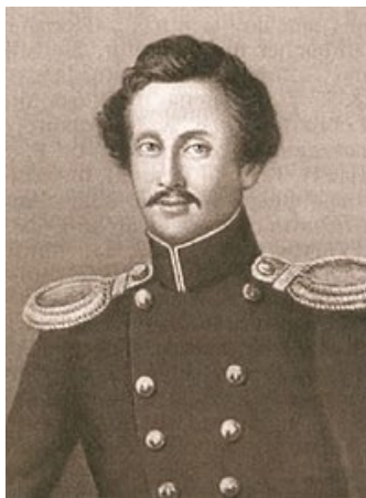
Барон Сгор Федорович Розен (1800-1860)

У вірші автор відтворює драматичні події грудня 1240 року, штурм Києва монголами та загибель Десятинного храму.