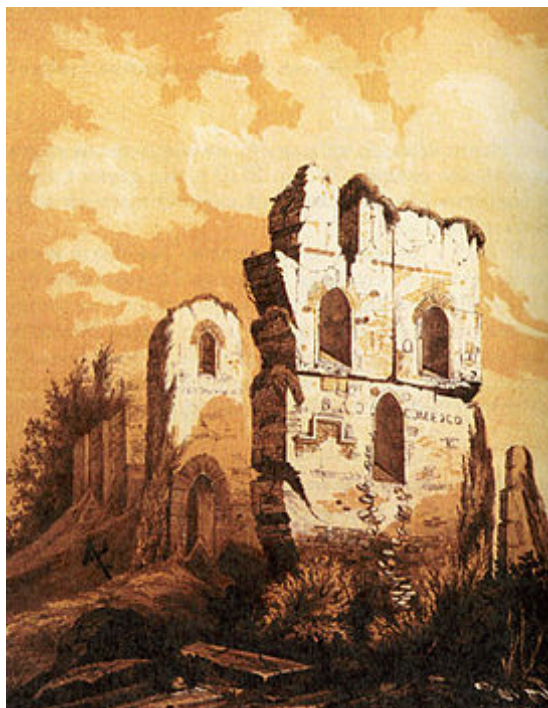
Е. Фабіянський. Малюнок руїн Десятинної церкви. 1857 р.

Поява твору барона Розена «Развалины Десятинной церкви» 1827 р. якраз припадає на період активних археологічних досліджень території храму ще за час існування на давньоруських фундаментах Десятинної церкви Петра Могили.