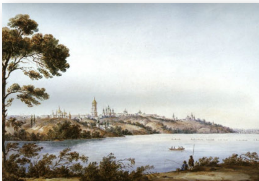
Ф. Солнцев. Вид на Києво-Печерську лавру. 1843 р.

Останні п'ятнадцять років життя митрополита пройшли в Києві та залишили глибокий слід в історії міста. Зокрема, дослідники практично одноставно визнають, що праці Євгенія стали відправною точкою наукового систематичного вивчення історії, сакральної топографії, святинь, писемних джерел, давніх археологічних пам'яток.