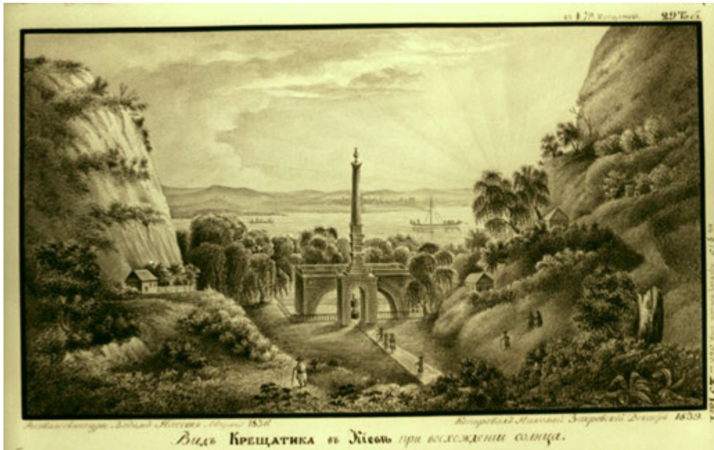
М. Закревський. Вид на Хрещатик. 1839 р.

Проте це фрагмент із листа митрополита Євгенія графу Н. П. Румянцеву, написаний якраз під час одного зі щорічних об'їздів єпархії. Наскільки нерозривними були для митрополита ці дві складові його життя – пастирське служіння та історія.