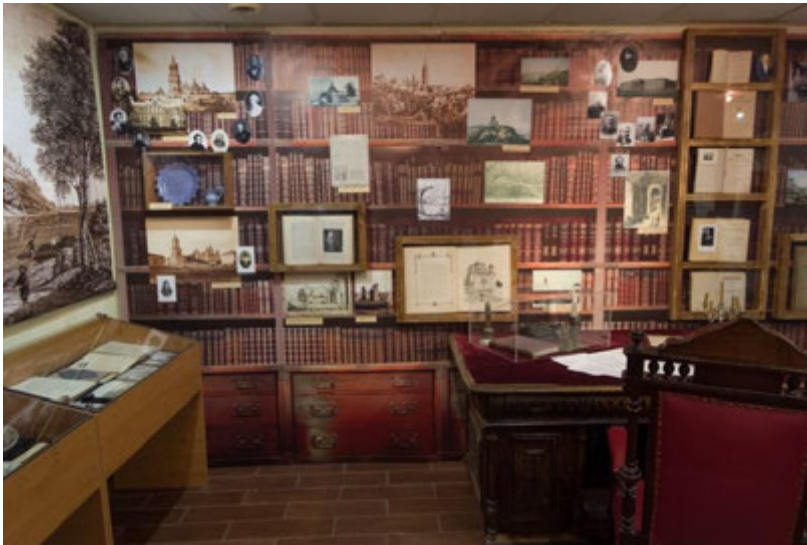
Експозиція виставки в Музеї історії Десятинної церкви до 250-річчя з дня народження митрополита Євгенія. 2017 р.

До його друкованих праць і рукописів звертаються не лише дослідники Київської Русі, слов'янознавці, історики Церкви. Допитливість та жага нових знань Євгенія не мали ні тематичних, ні географічних обмежень.