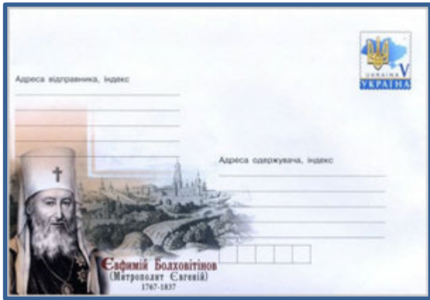
Конверт, випущений Укрпоштою до 250-річчя з дня народження митрополита Євгенія. 2017 р.