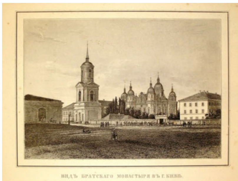
Вид на Братський монастир у Києві

Щопонеділка лаврський економ доповідав Євгенію про стан господарських справ у підвідомчих Лаврі закладах. За митрополита Євгенія велися великі будівельні та ремонтні роботи. Тільки в Києві збудовано новий академічний корпус, відновлено Братський та Катерининський грецький монастирі, влаштовувалися корпуси Флорівського монастиря, у Видубецькому збудовано кам'яну дзвіницю, у Лаврі – приміщення для братії та паломників. Андріївська церква наведена «в первобытную лепоту свою». У 1833 році в Синод було представлено кошторис на ремонт 79-ти та будівництво 14-ти сільських церков.