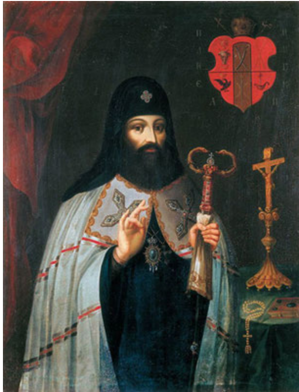
Іл. 1. Митрополит Київський Петро Могила. Портрет XVII ст.

У літературі обставини вступу Петра Могили (іл. 1) на Києво-Печерську архімандрію розглянуто досить ретельно, проте часто наводяться такі топоси. Після смерті 8 квітня 1626 року Печерського архімандрита Захарії Копистенського монастирська братія розділилася в думках щодо обрання нового архімандрита та, унаслідок цього, близько 2 років не мала його. Нарешті, хоч і не одногосно, а на вимогу окремих з-поміж братії, Київський митрополит Іов Борецький висвятив Петра Могилу в сан Києво-Печерського архімандрита [С. Р. 1877, с. 8; Костомаров; Евгений (Болховитинов) 1995, с. 361] у 1628-му або 1629 році [Самуил (Миславский)] 1795, с. 145].