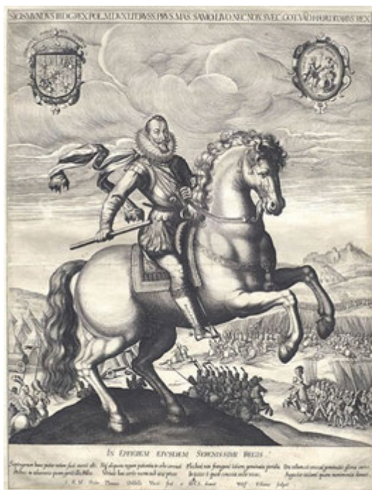
Іл. 3. Польський король Сигізмунд III. Кінний портрет на тлі Смоленська. Гравюра на міді до 1611 року

У свою чергу невдовзі після обрання Могили на сеймику в Житомирі 16 вересня 1627 року до короля Сигізмунда III (іл. 3) було надіслано прохання про затвердження. Паралельно, майже одразу – 24 вересня, Петро Могила пише листа