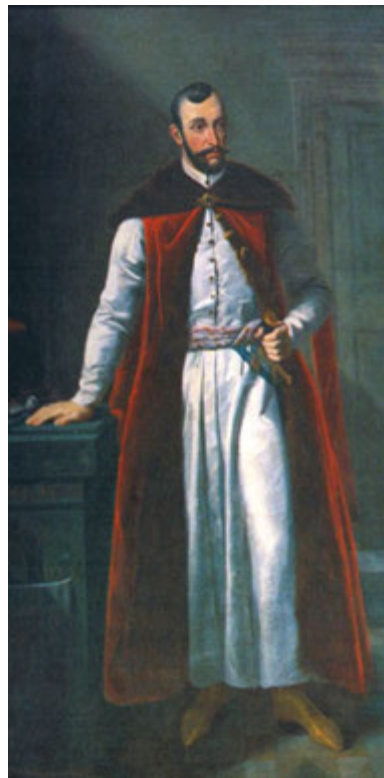
Іл. 4. Київський воєвода (1619–1628) Томаш Замойський. Картина першої половини XIX ст. з портрета 1630-х років

до Київського воєводи Томаша Замойського (іл. 4), з родиною якого він був з дитинства пов'язаний [Грушевський], з проханням поклопотатися перед королем, щоб той, із поваги до заслуг роду Могил та його власних, затвердив цей вибір [Лист... Петра Могили 2004, с. 302–303]. Це звернення мало успіх. У листі з Варшави, який датується 5 жовтня, до Київського уніатського митрополита Веніямина Рутського Якоб Маркарт повідомляє, що хтось налаштував короля на користь Могили, і йому, Маркарту, не вдається переконати його в легітимності обрання Тишкевича, опротестованого ченцями [Письмо Якова Маркарта... 1883, с. 294]. Пізніше, у 1631 році, Могила у посвяті до Цвітної Тріоди, виданої Печерською друкарнею, описав у ній усі благодіяння, які були надані йому, його родині та всій Православній церкві від родини Замойських [Триодион 1631, с. в-д]. 29 листопада 1627 року король Сигізмунд III підписав грамоту, яка затверджувала обрання Могили в сан архімандрита Києво-Печерського монастиря [Грамота польського короля 1883, с. 296–297].