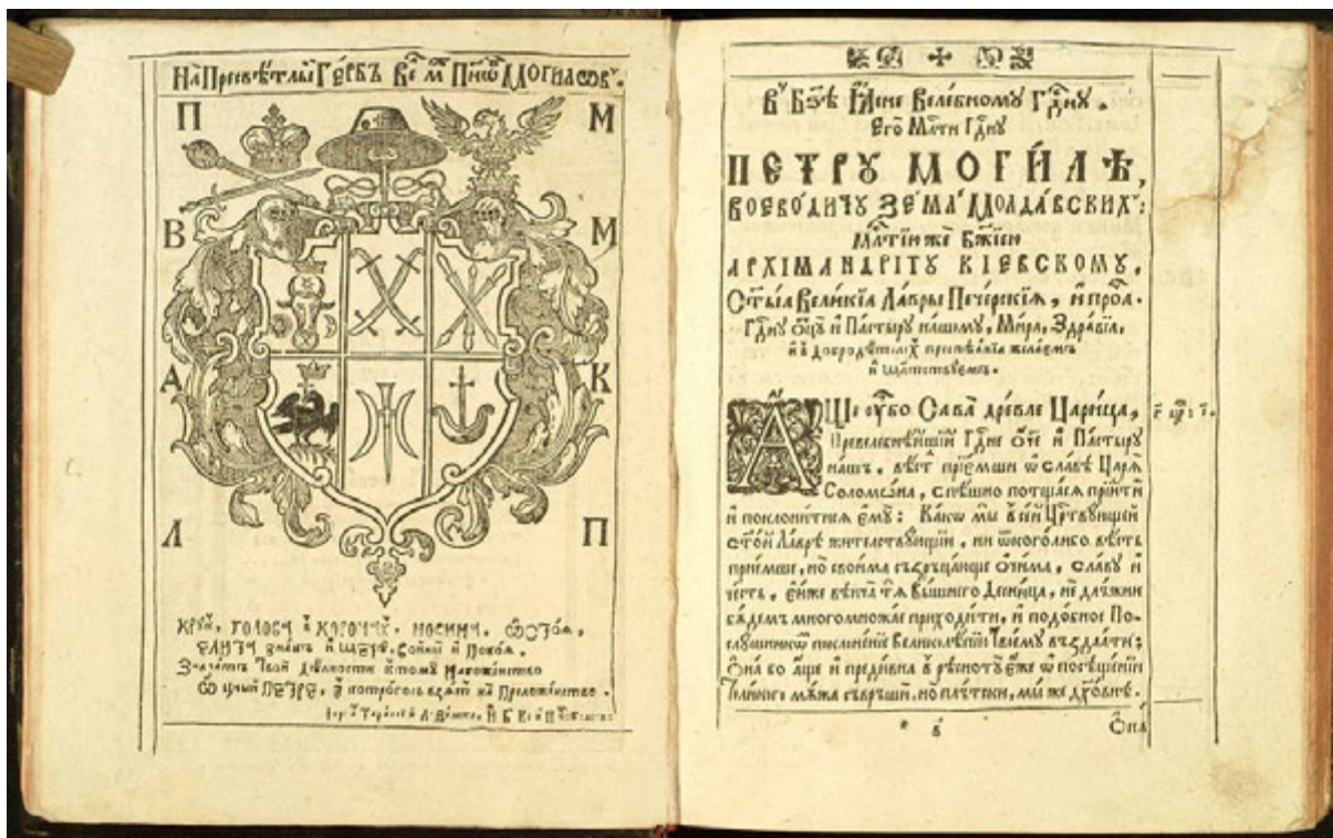
Іл. 6. Повчання авви Дорофія, видані на початку 1628 року, уже містять посвяту Петру Могилі як Києво-Печерському архімандритові

Водночас у виданих друкарнею також на самому початку 1628 року Повчаннях авви Дорофія вже є посвята Києво-Печерському архімандриту Петру Могилі (іл. 6), написана намісником монастиря Філофієм Кизаревичем [Преподобного отца ... 1628, с. в-г].