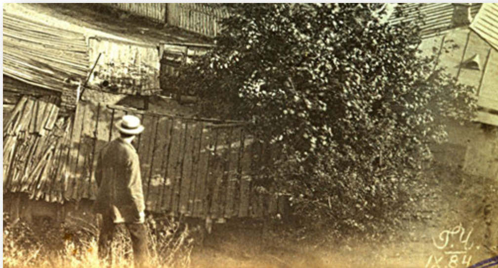
Фрагмент фото Г. Чугаєвича.

Чугаєвич не був професійним фотографом, а отже, не був пов'язаний з комерційним інтересом, не оцінював успіх зйомки кількістю проданих екземплярів та їх вартістю. Утім, він віддав фотографії багато років і досяг результатів, яким могли б позаздрити фотографи-професіонали. Не ставлячи перед фотографією комерційних завдань, він міг експериментувати, був вільний у виборі сюжетів.