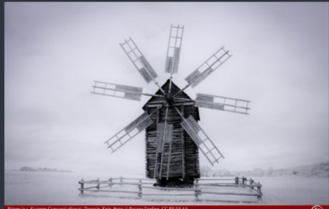
Вітряк II с. Кузьмів Сумської області. Паростів, Київ. Фото: © Руслан Грабін, CC BY-SA 4.0 2023 рік. Інформаційний центр. Микола Дупак 3, Зоря Діпан 1.1.40, Київ Інформац 400