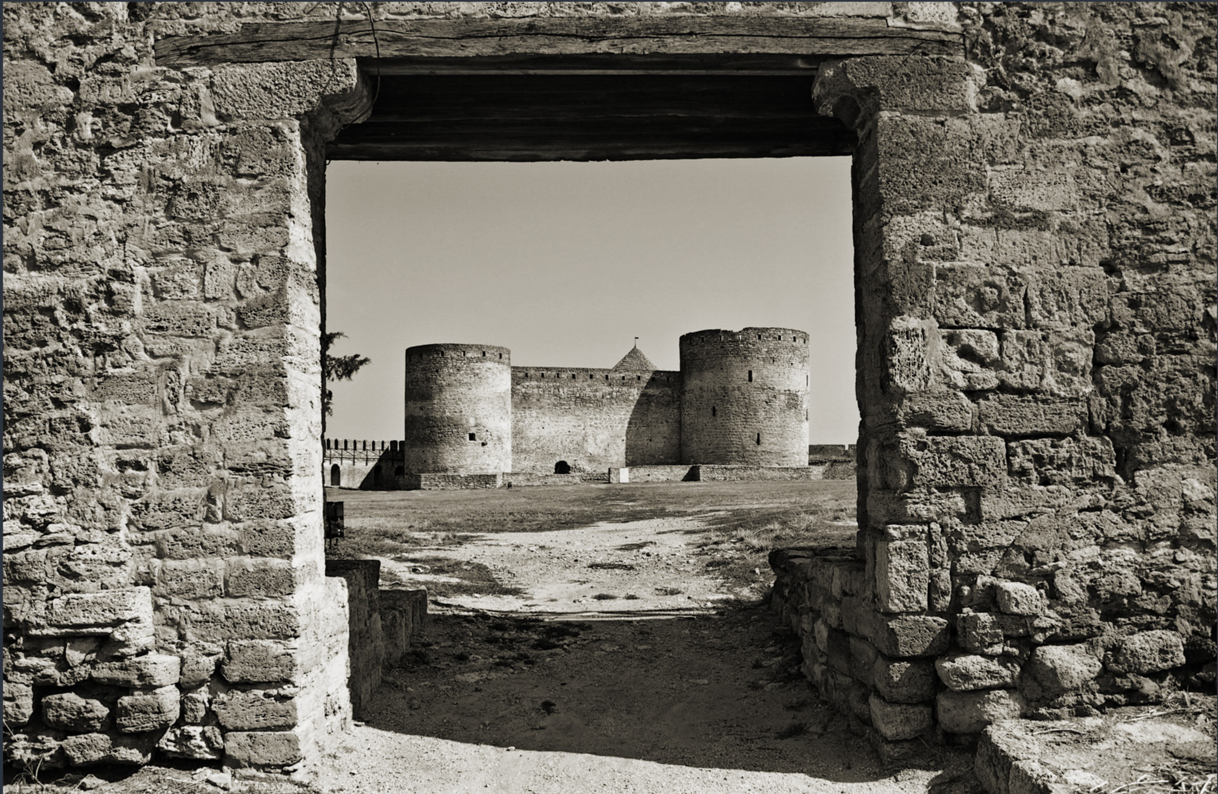
Генуезький замок. Білгород-Дністровський. Найкраще фото Одеської області «Вікі любить пам'ятки 2023»