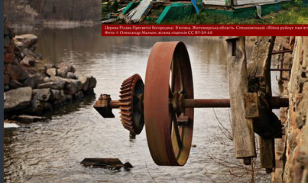
Водяний млин. Мокрошівка. Буковина. Київська область. Співомовляння «Вікі любить пам'ятки»