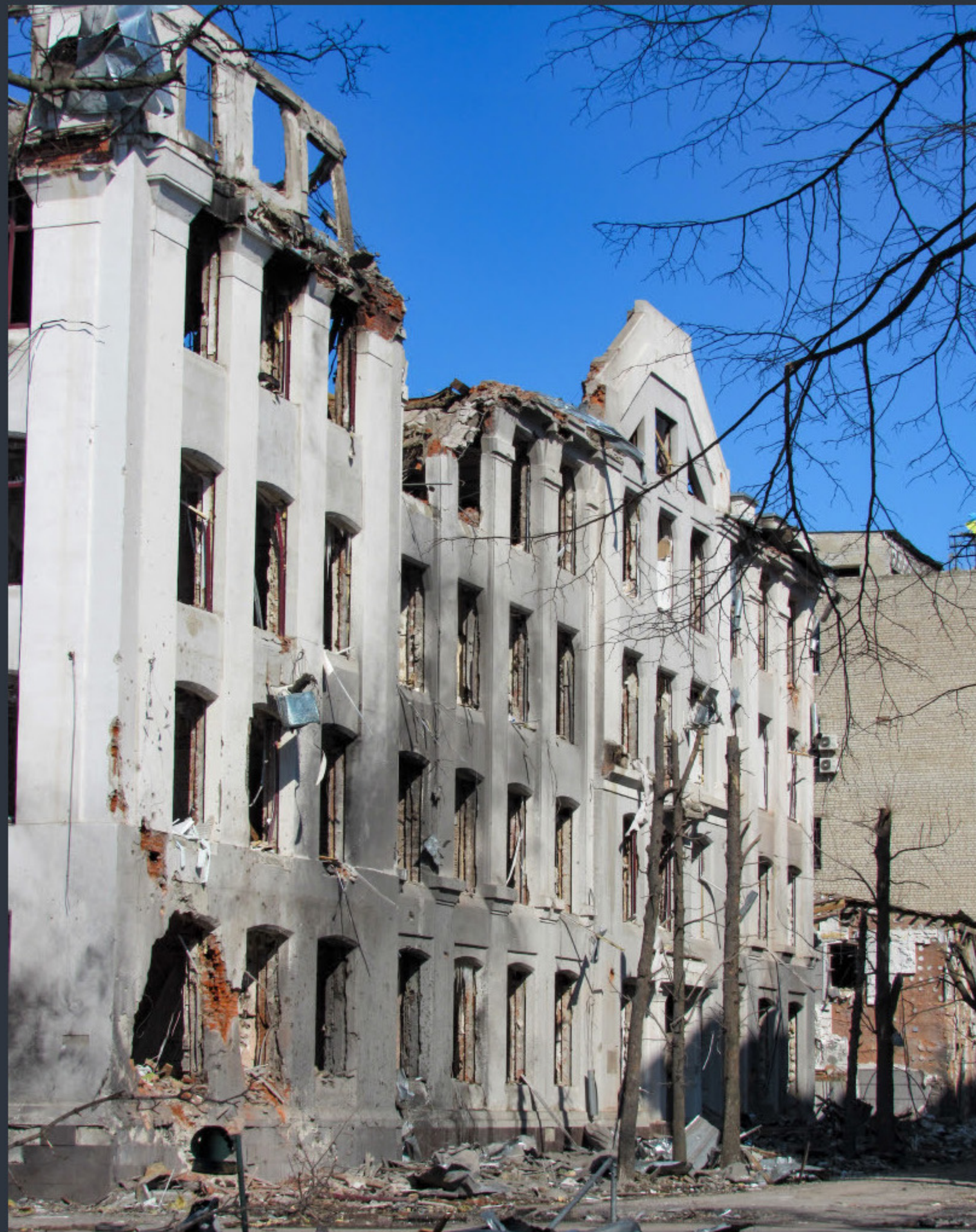
Будинок Наркомпраці. Харків. Спецномінація «Війна руйнує пам'ятки»