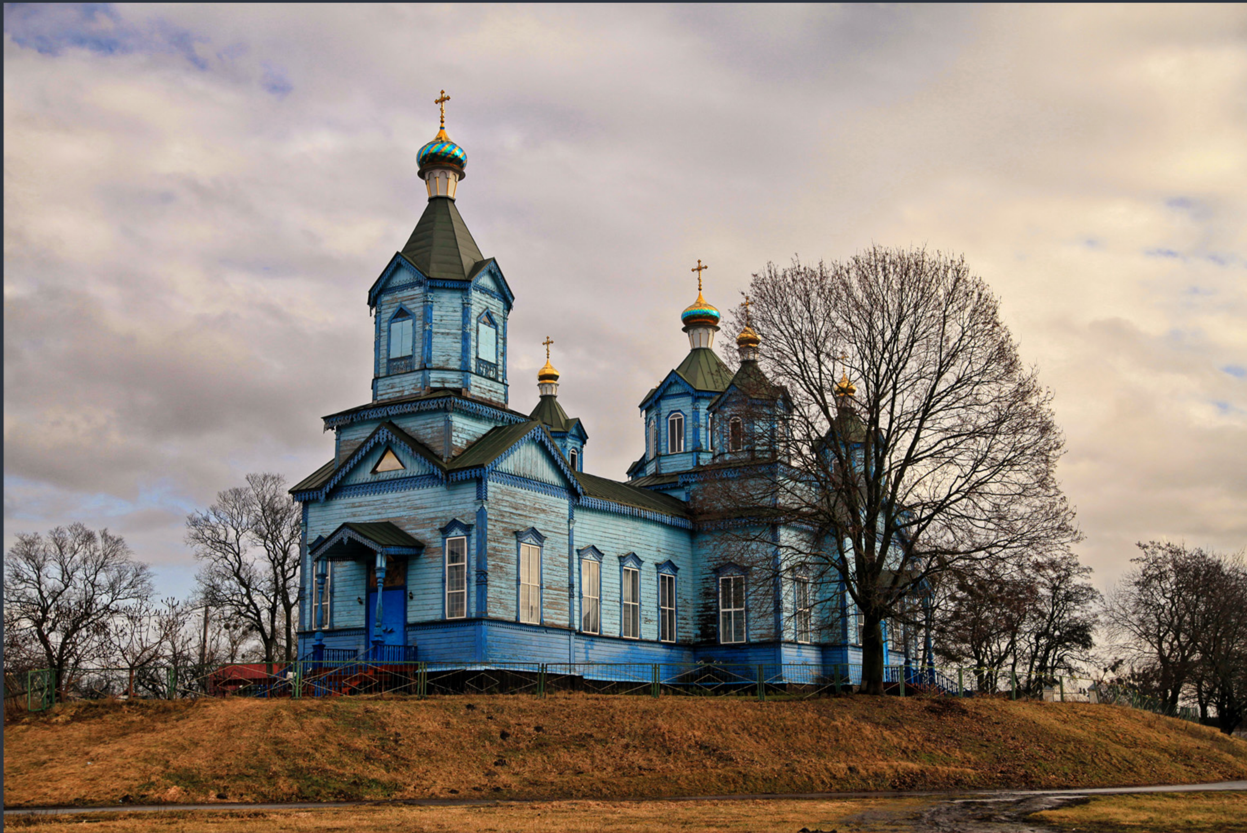
Свято-Миколаївська церква. Rogoziv. Найкраще фото Київської області «Вікі любить пам'ятки 2023» Фото: © Олександр Мальон, вільна ліцензія CC BY-SA 4.0