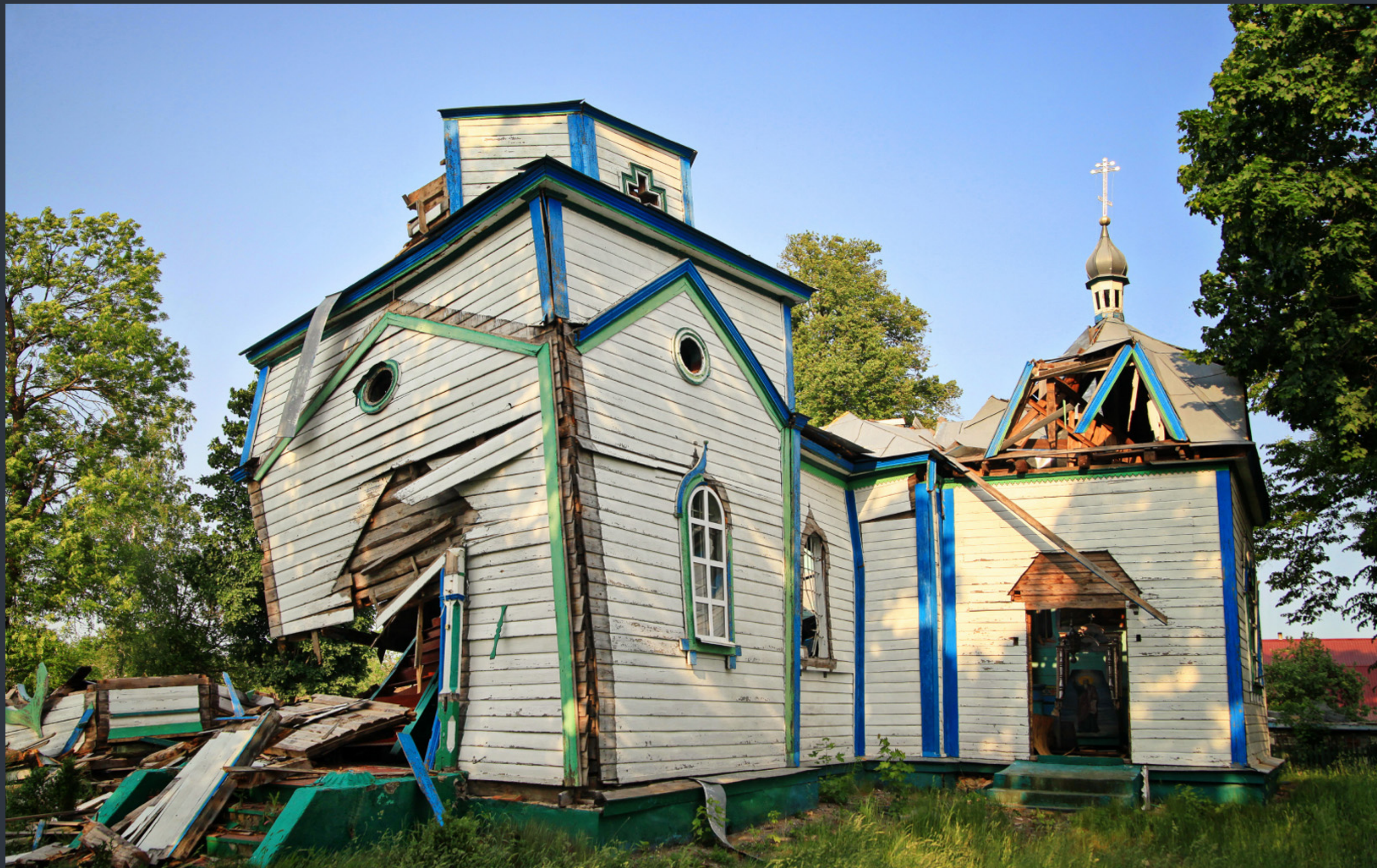
Церква Різдва Пресвятої Богородиці. В'язівка, Житомирська область. Спецномінація «Війна руйнує пам'ятки» Фото: © Олександр Мальон, вільна ліцензія CC BY-SA 4.0