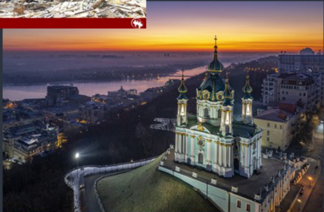
Андріївська церква. Найкраще фото Києва «Вікі любить пам'ятки 2023»