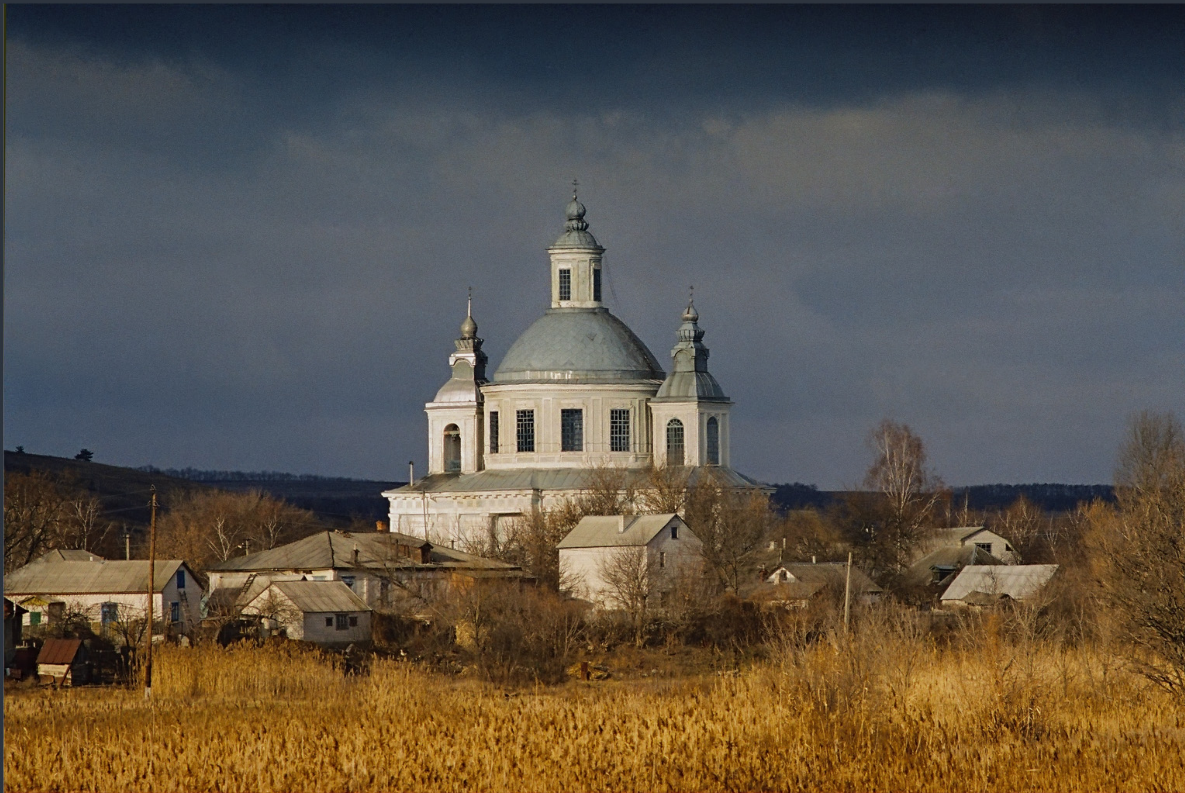
Успенська церква. Осинове. Найкраще фото Луганської області «Вікі любить пам'ятки 2023»