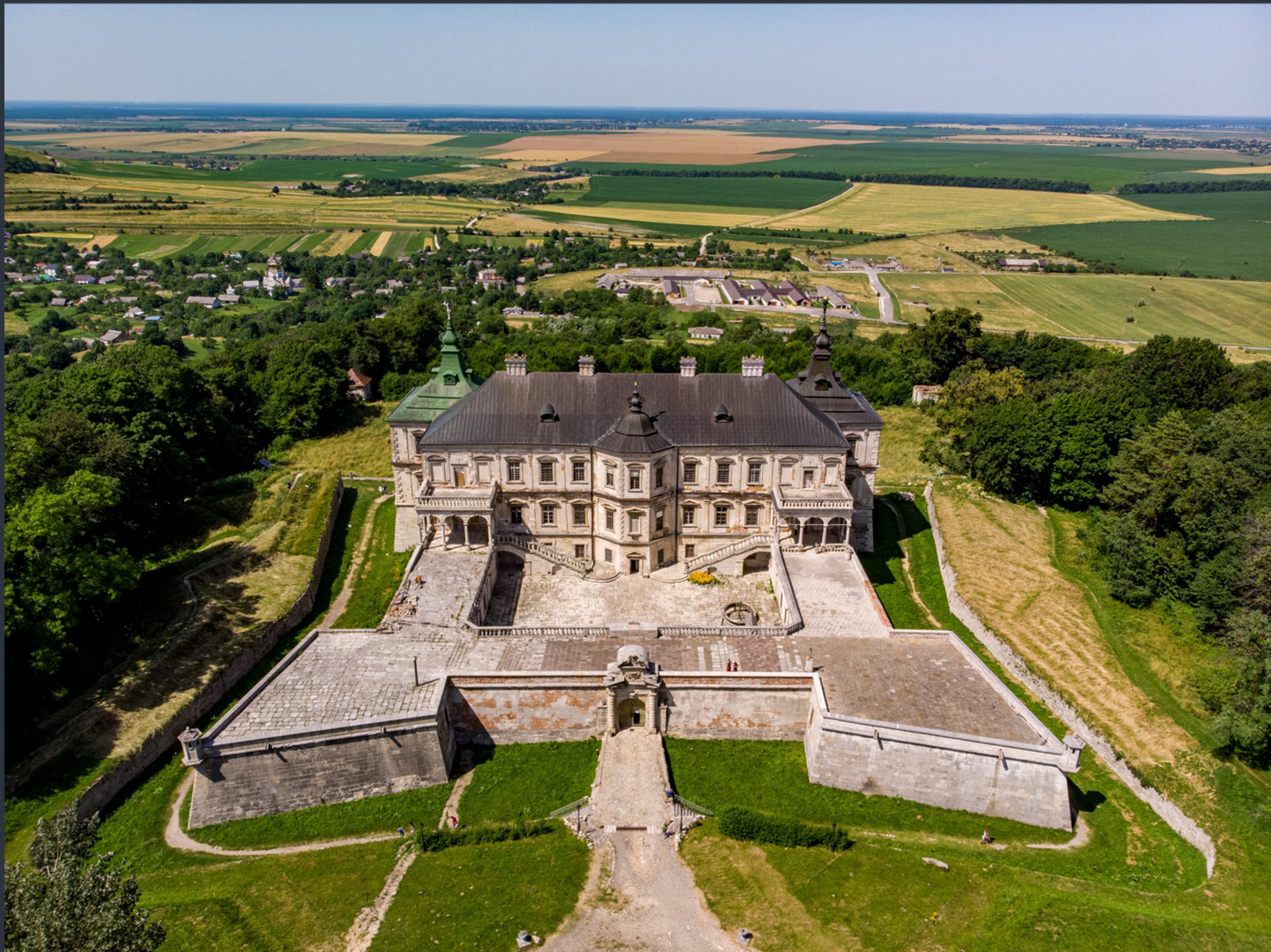
Замок Конецпольських. Підгірці. Найкраще фото Львівської області «Вікі любить пам'ятки 2023» Фото: © Роман Бекас, вільна ліцензія CC BY-SA 4.0