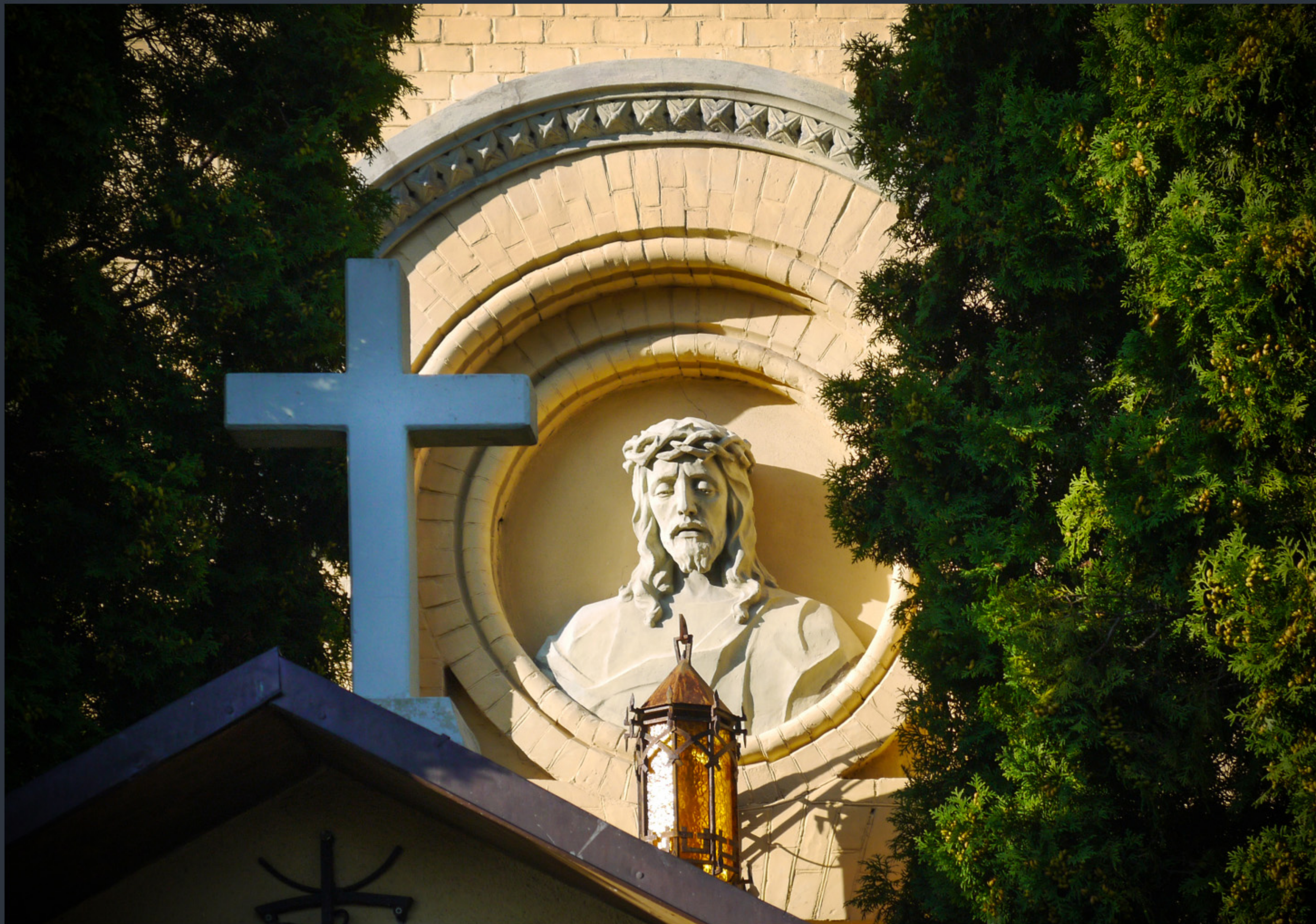
Костел Воздвиження Святого Хреста. Фастів, Київська область. Спецномінація «Елементи екстер'єру»