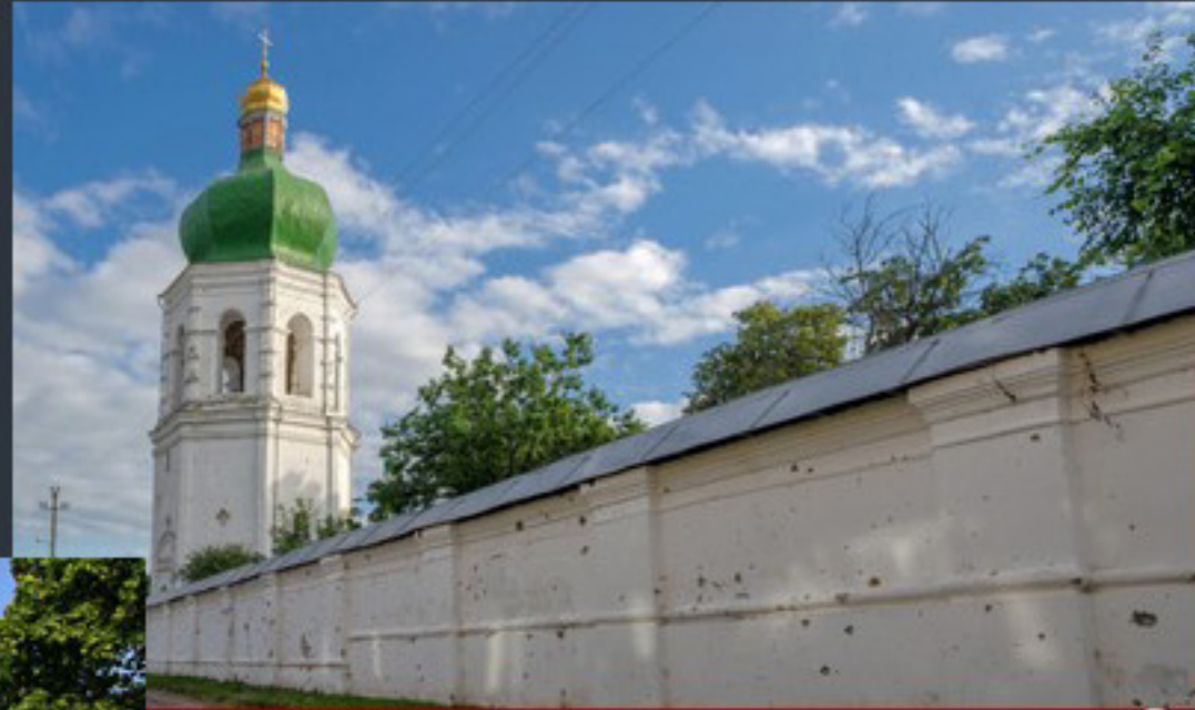
Співомовляння «Вікі любить пам'ятки» Київська область. Фото: Віктор Поліщук «Вікі любить пам'ятки 2023» Фото: © Ростислав Мельничук, вільна ліцензія CC BY-SA 4.0