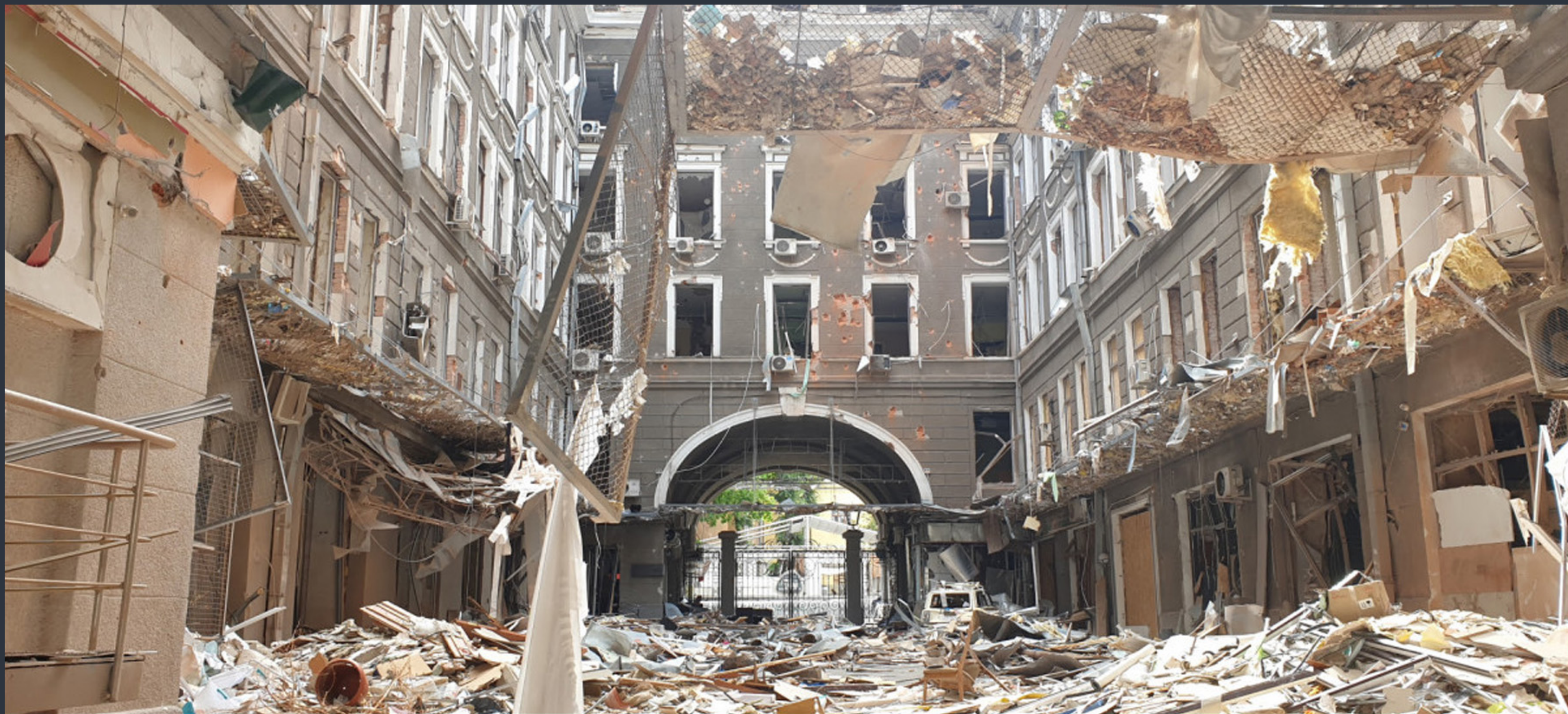
Палац праці. Харків. Спецномінація «Війна руйнує пам'ятки»