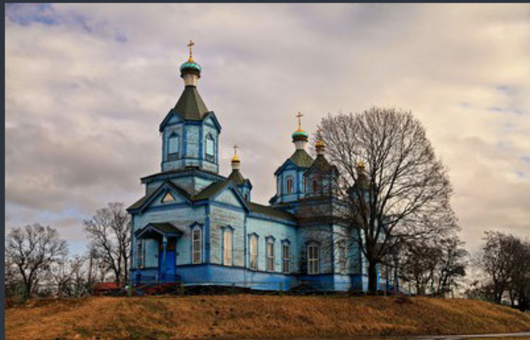
Свято-Миколаївська церква. Рогозів. Найкраще фото Київської області «Вікі любить пам'ятки 2023»