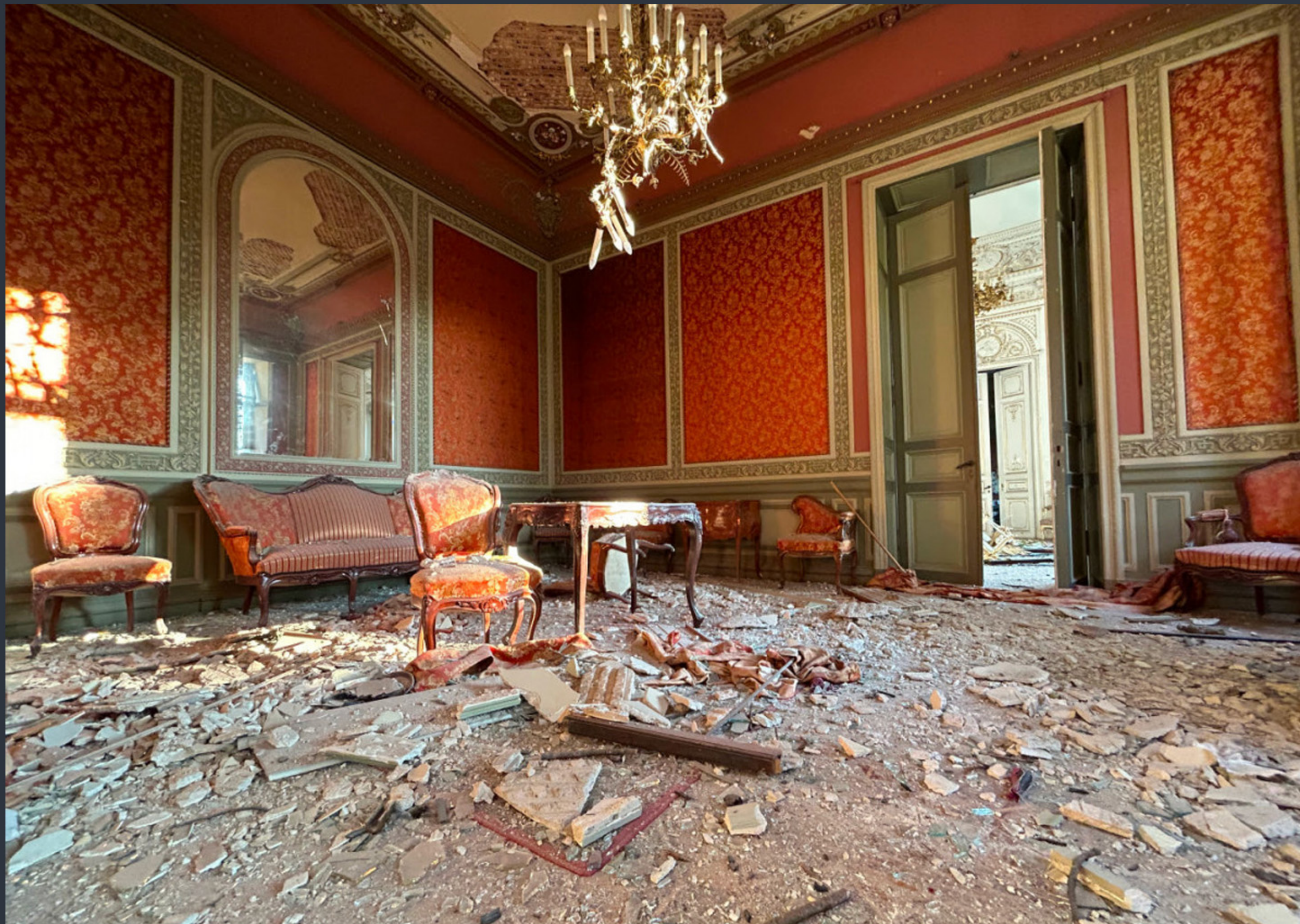
Будинок вчених. Одеса. Спецномінація «Війна руйнує пам'ятки» Фото: © Oleksandr Levytskyi, вільна ліцензія CC BY-SA 4.0