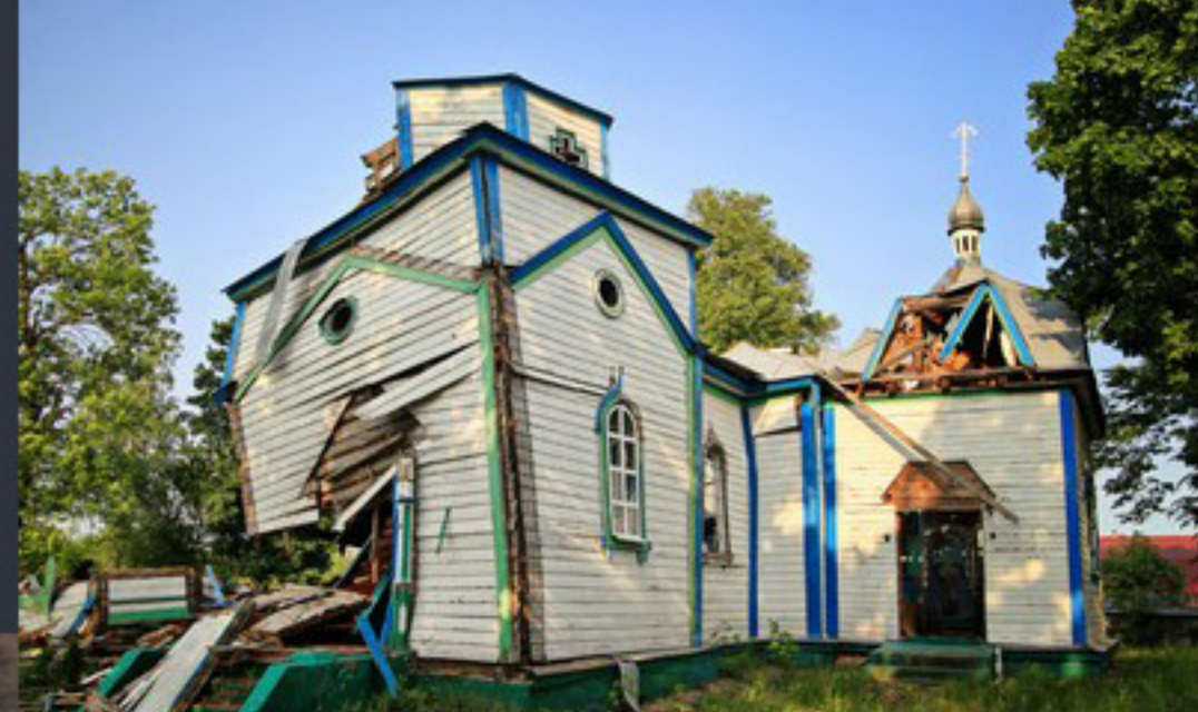
Церква Різдва Пресвятої Богородиці. Вільня. Житомирська область. Співомовляння «Вікі любить пам'ятки» Фото: © Олександр Малюк, вільна ліцензія CC BY-SA 4.0