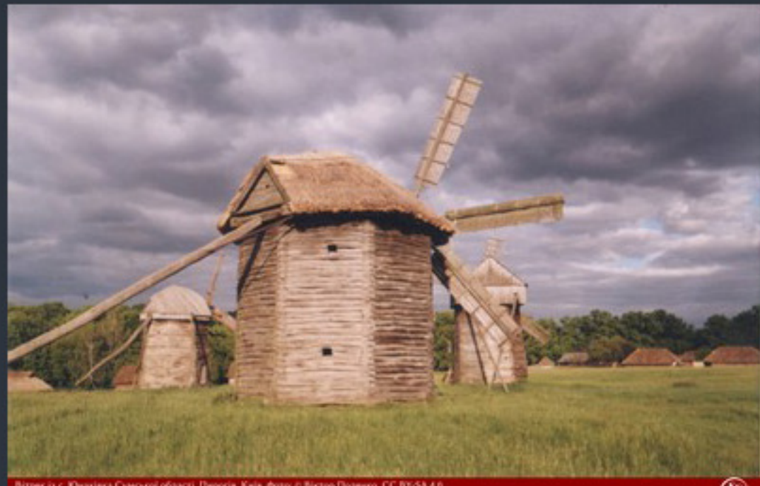
Вітряк II с. Жуванів Сумської області. Паростів, Київ. 6 червня 2006 року. Київ/Київ. Шт. шти «червон» вітряк