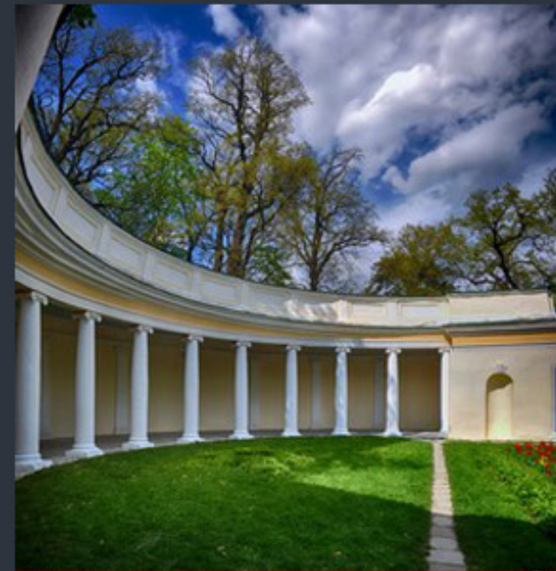
Кіровоградський парк «Олександрівський» Київська область. Фото: Віктор Поліщук «Вікі любить пам'ятки 2023» Фото: © Ростислав Мельничук, вільна ліцензія CC BY-SA 4.0