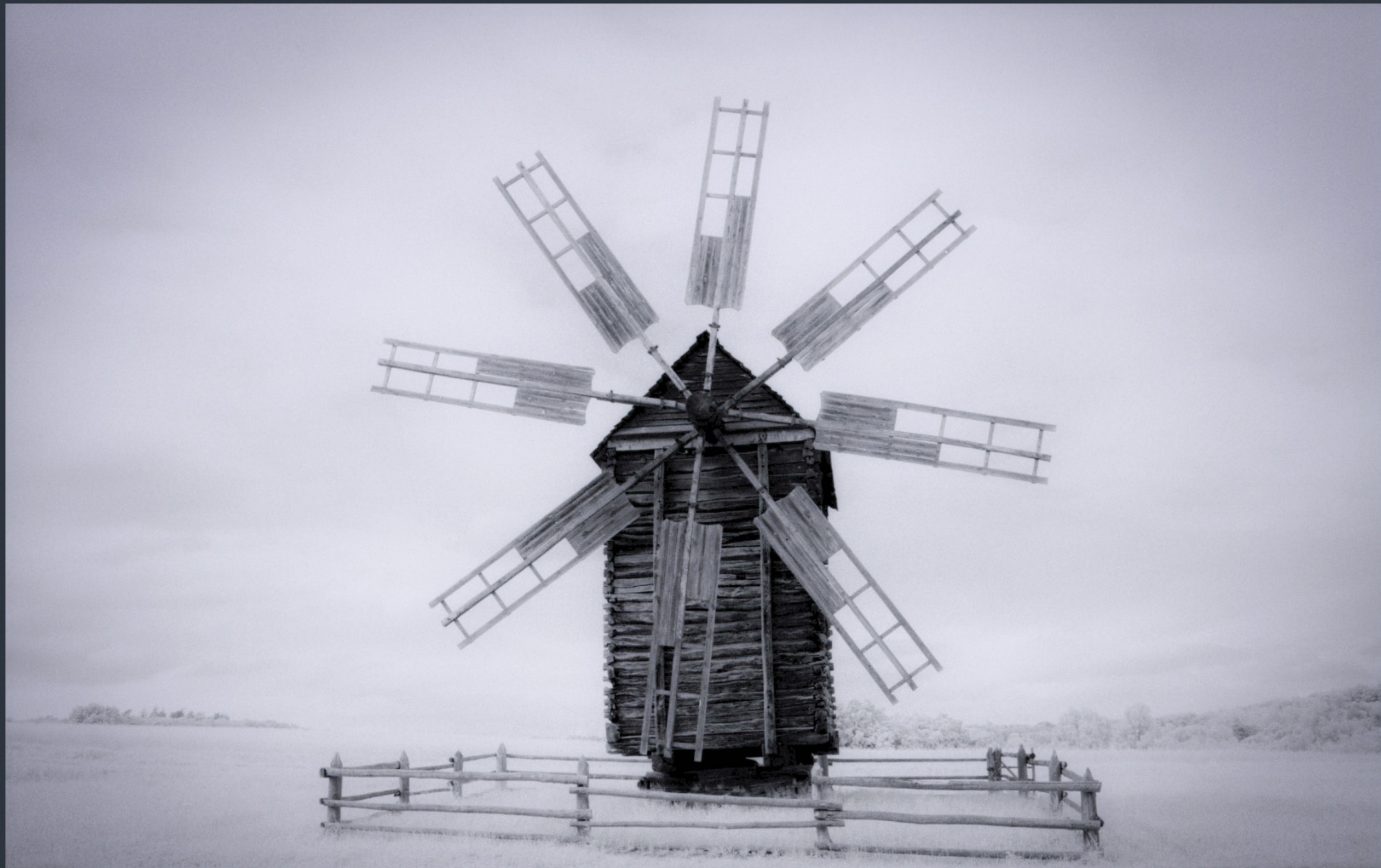
Вітряк із с. Кудряве Сумської області. Пирогів, Київ. 2023 рік. Інфрачервоний спектр. Minolta Dynax 5, Sony 35mm f/1.4G, Rollei Infrared 400