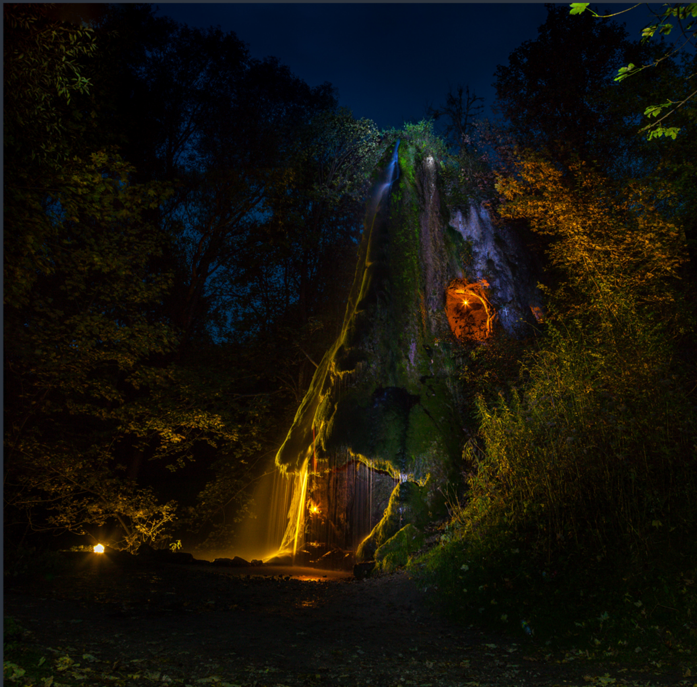
Скала з гротом та водоспадом. Маліївці. Найкраще фото Хмельницької області «Вікі любить пам'ятки 2023»

Хмельницька обл., Маліївці. Палацово-парковий ансамбль створено наприкінці XVIII ст. як резиденцію шляхтичів Орловських за участю архітектора Доменіко Мерліні, садівників Діонісія МакКлера і Д. Клігера. Збереглися палац, побудований 1788 р. у стилі класицизму, водонапірна вежа висотою 25 м, молочарня, кам'яний мур парку та внутрішнього саду (2 га), міст, джерело питної води з барельєфом лева та невеликим басейном, два ставки (0.3 та 0.5 га, на більшому – острівець), природні джерела. Особлива історична та релігійна цінність – скеля вапняку з 18-метровим штучним водоспадом та двоповерховим гротом.