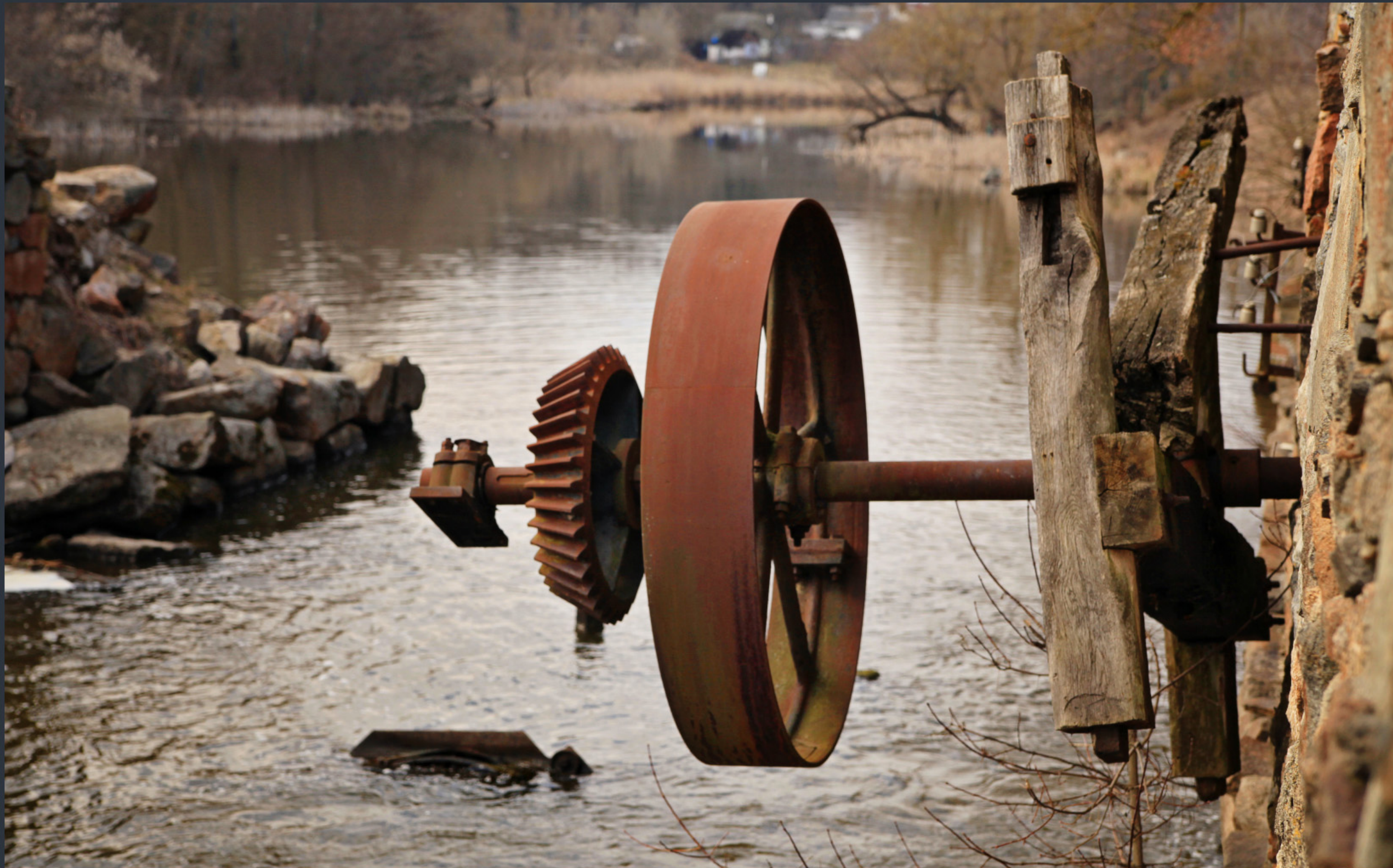
Водяний млин Абрамовича. Буки, Київська область. Спецномінація «Елементи екстер'єру» Фото: © Олександр Мальон, вільна ліцензія CC BY-SA 4.0