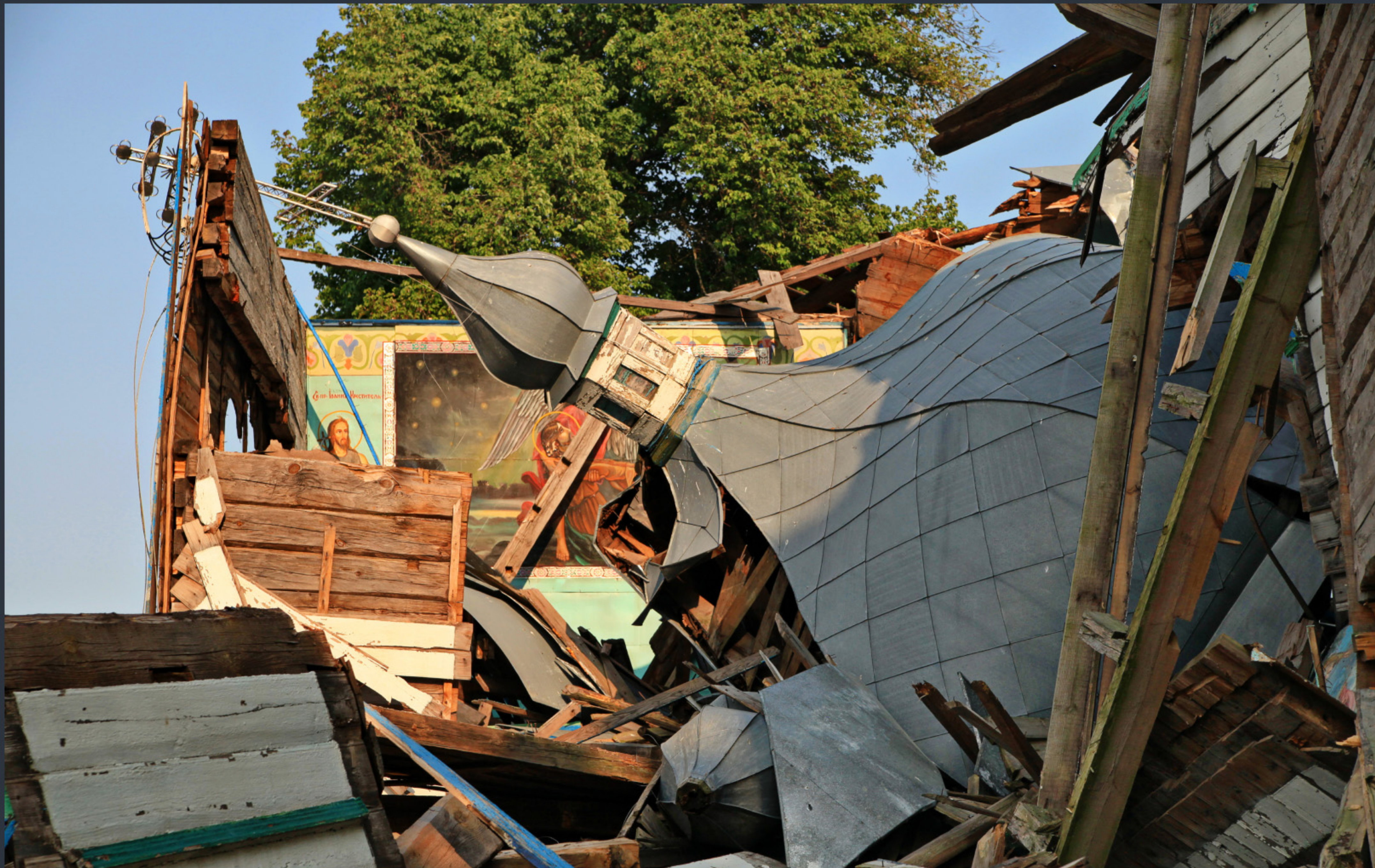
Церква Різдва Пресвятої Богородиці. В'язівка, Житомирська область. Спецномінація «Війна руйнує пам'ятки»