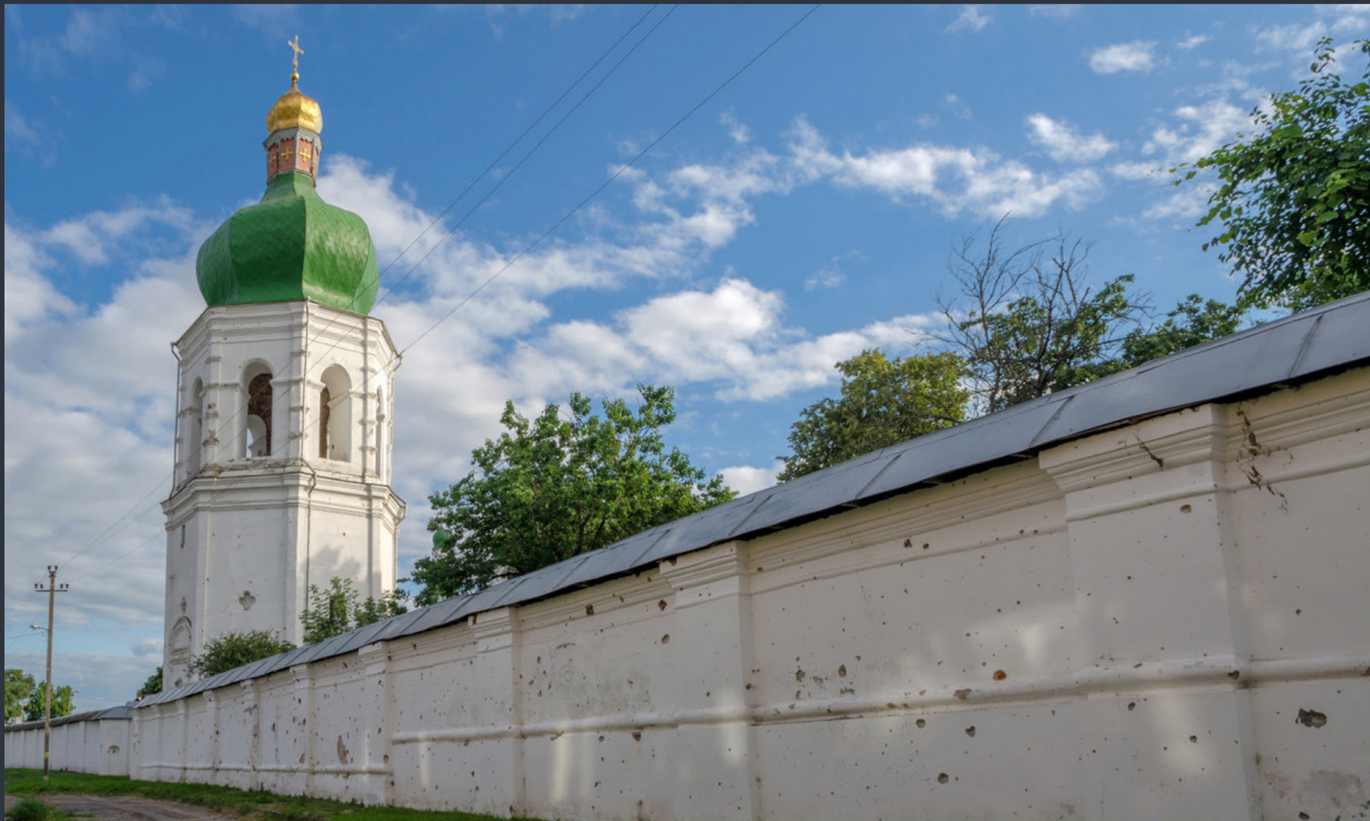
Комплекс споруд Єлецького монастиря. Чернігів. Спецномінація «Війна руйнує пам'ятки»