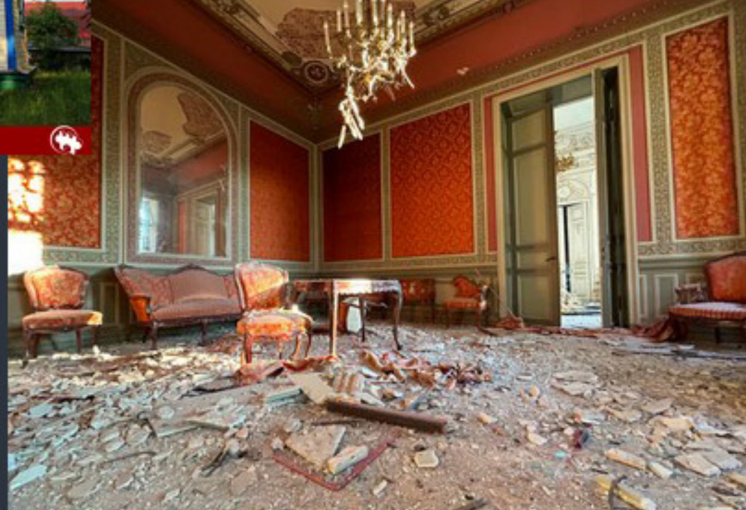
Будинок вільня. Одеса. Співомовляння «Вікі любить пам'ятки»