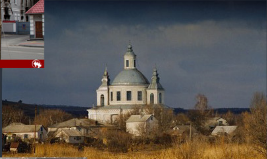
Фото Луганської області «Вікі любить пам'ятки 2023» CC BY-SA 4.0