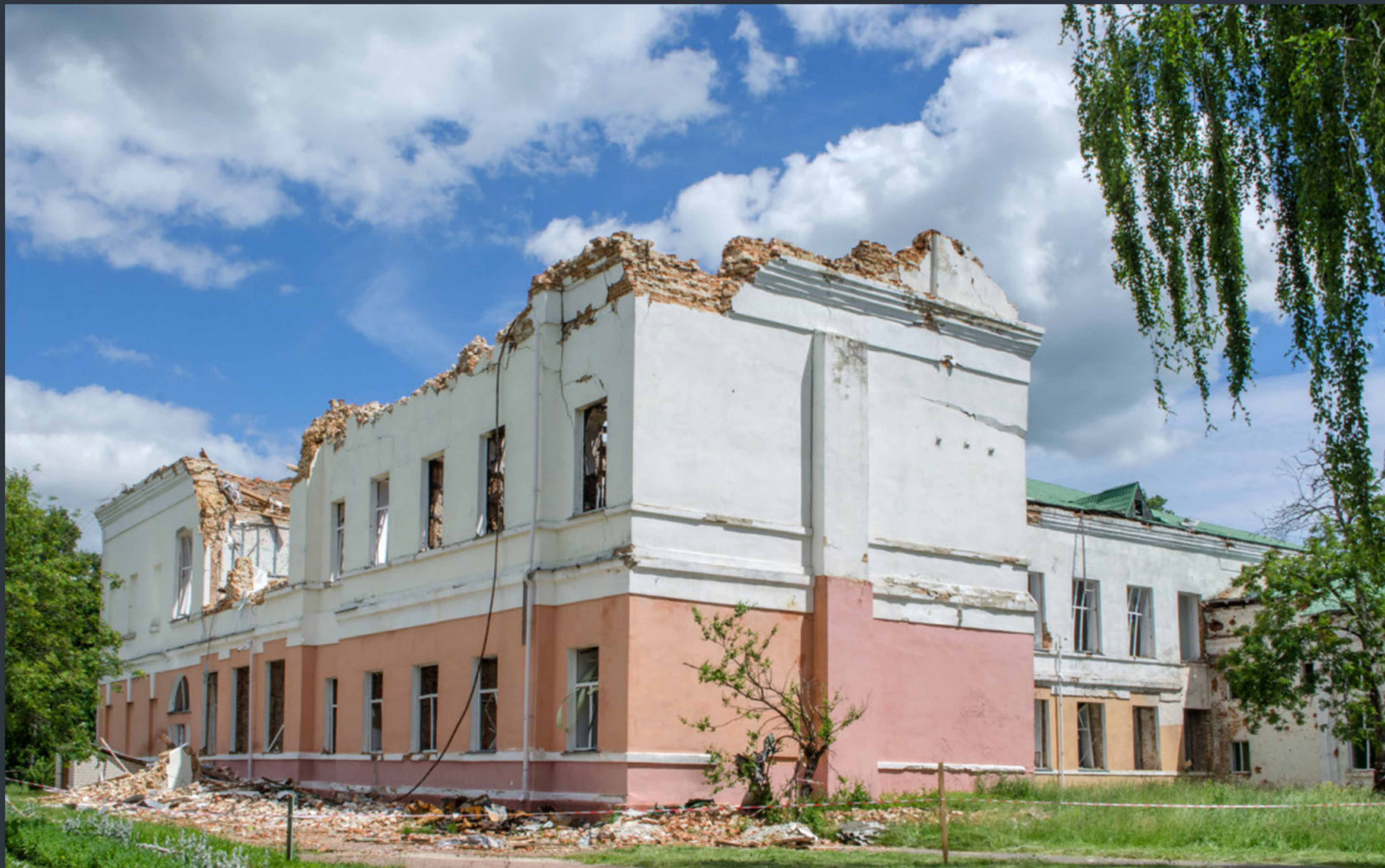
Будинок колишньої чоловічої гімназії. Новгород-Сіверський, Чернігівська область. Спецномінація «Війна руйнує пам'ятки»