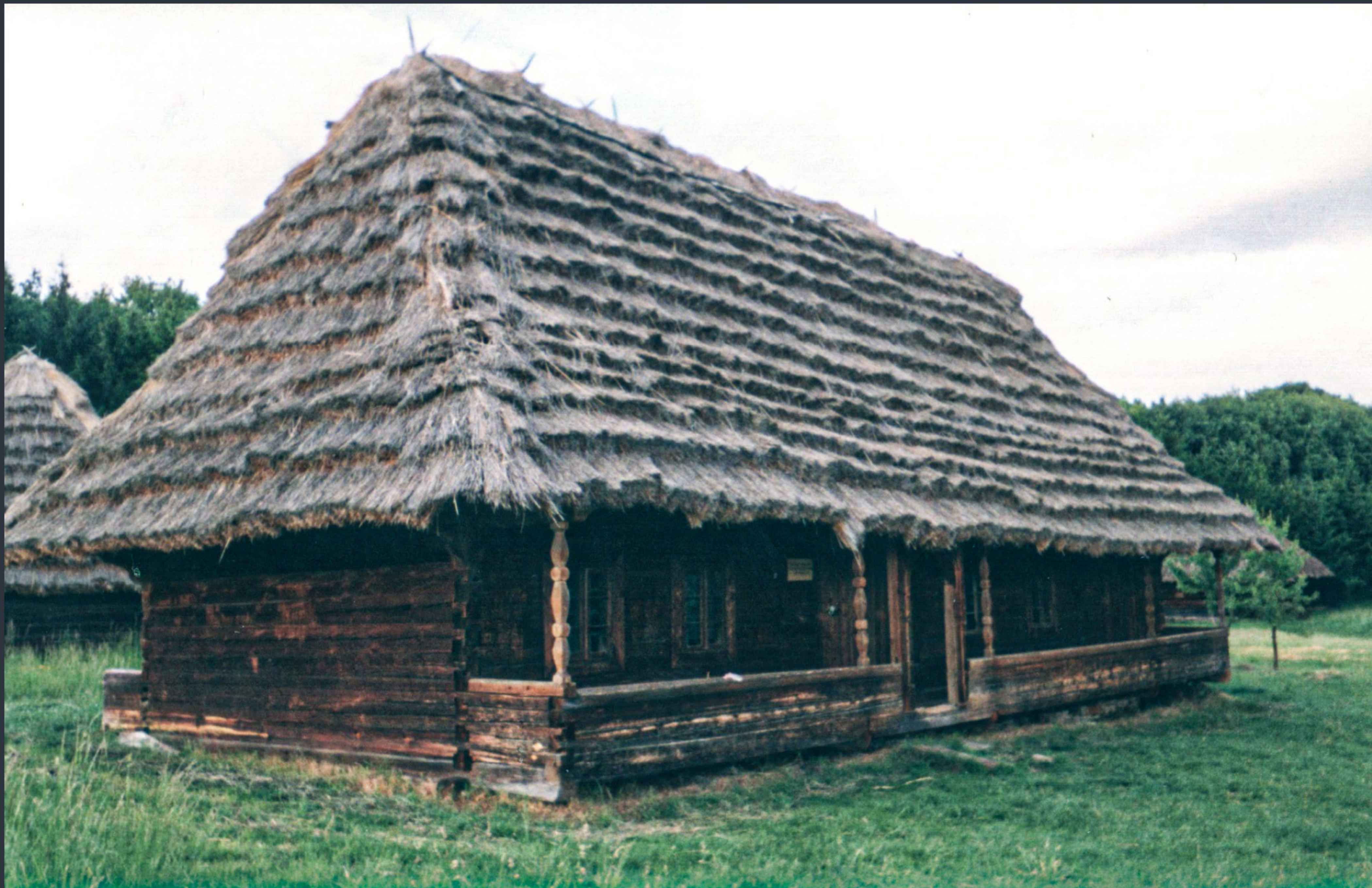
Хата з с. Тухолька Львівської області. Пирогів, Київ. 6 червня 2006 року. Kodak KB10. Пам'ятка згоріла у вересні 2006 року