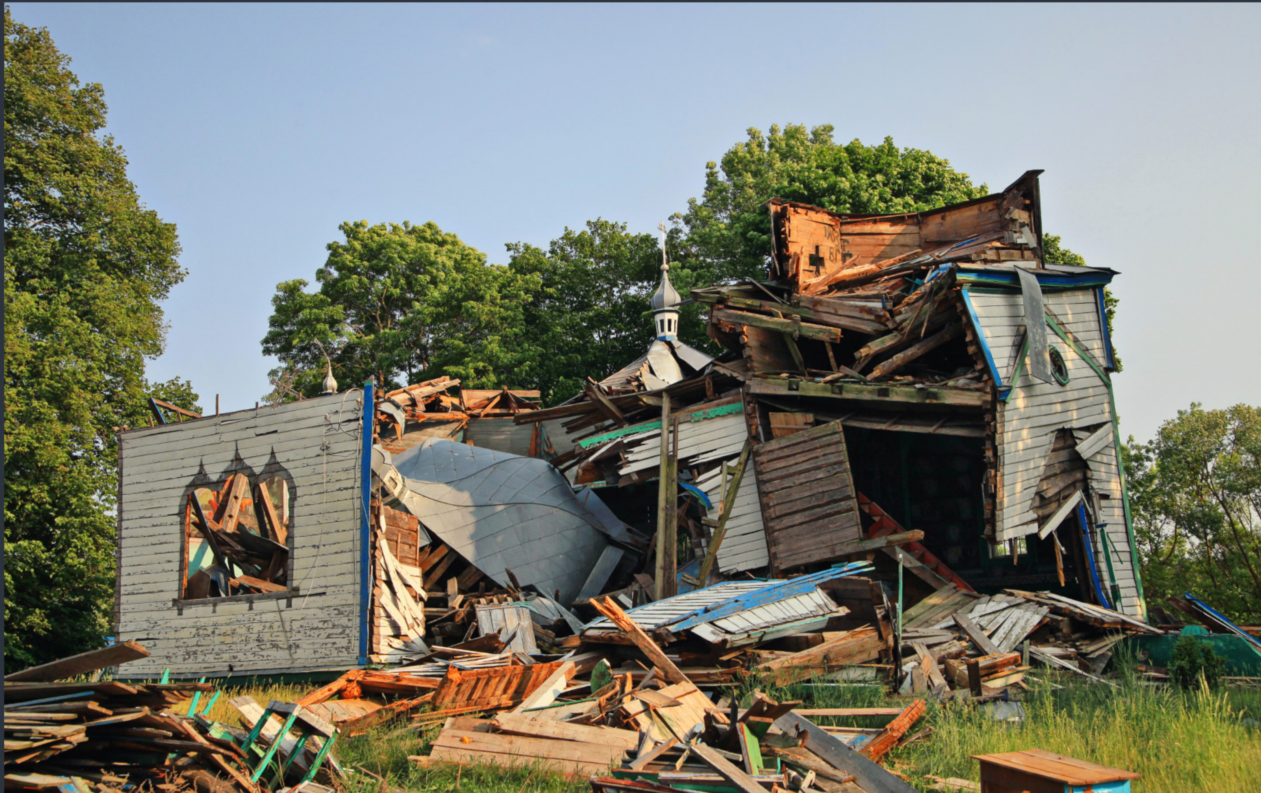
Церква Різдва Пресвятої Богородиці. В'язівка, Житомирська область. Спецномінація «Війна руйнує пам'ятки» Фото: © Олександр Мальон, вільна ліцензія CC BY-SA 4.0