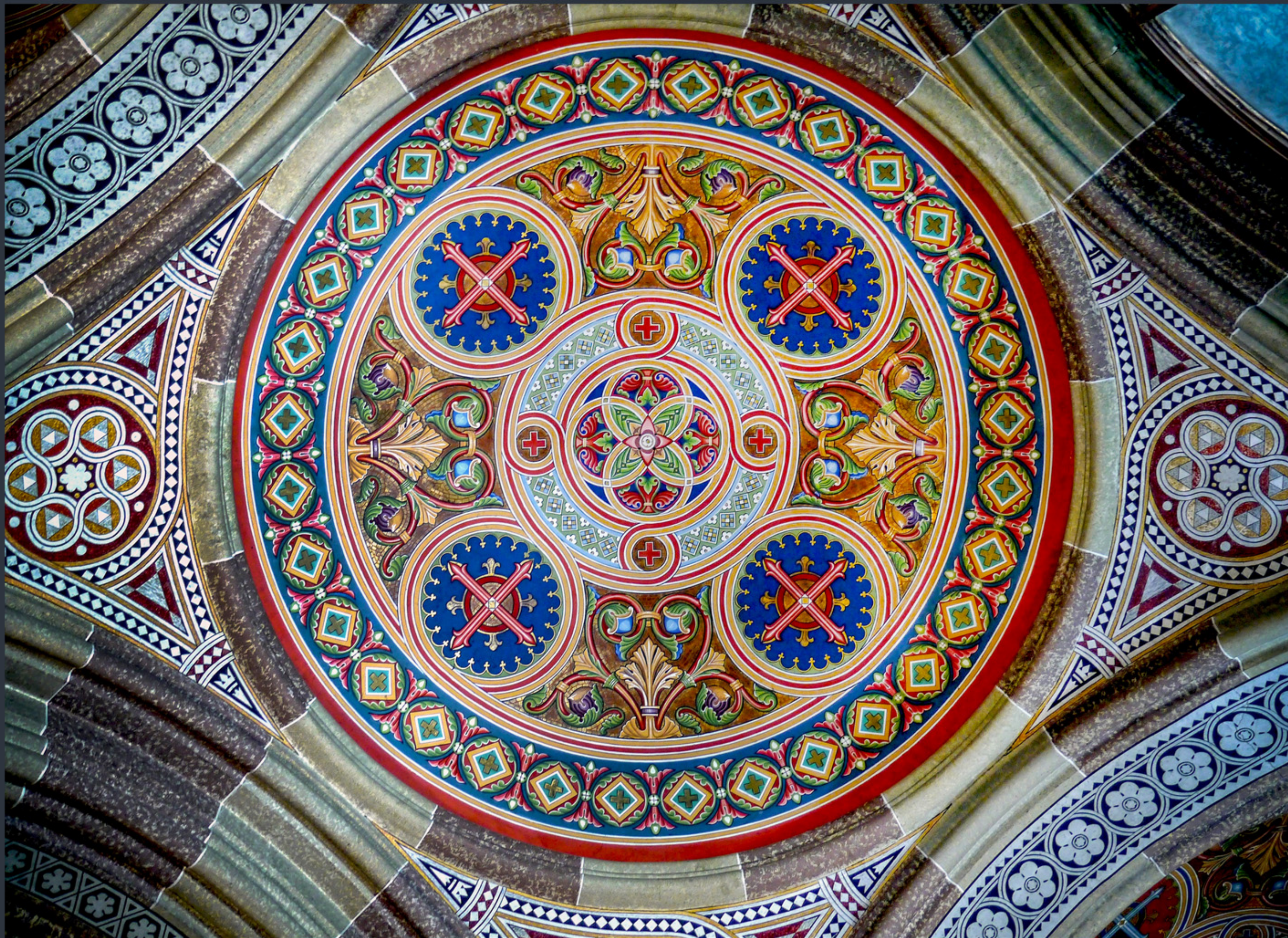
Склепіння бічної нави Семінарської (Трьох-Святительської) церкви. Найкраще фото Чернівецької області «Вікі любить пам'ятки 2023»