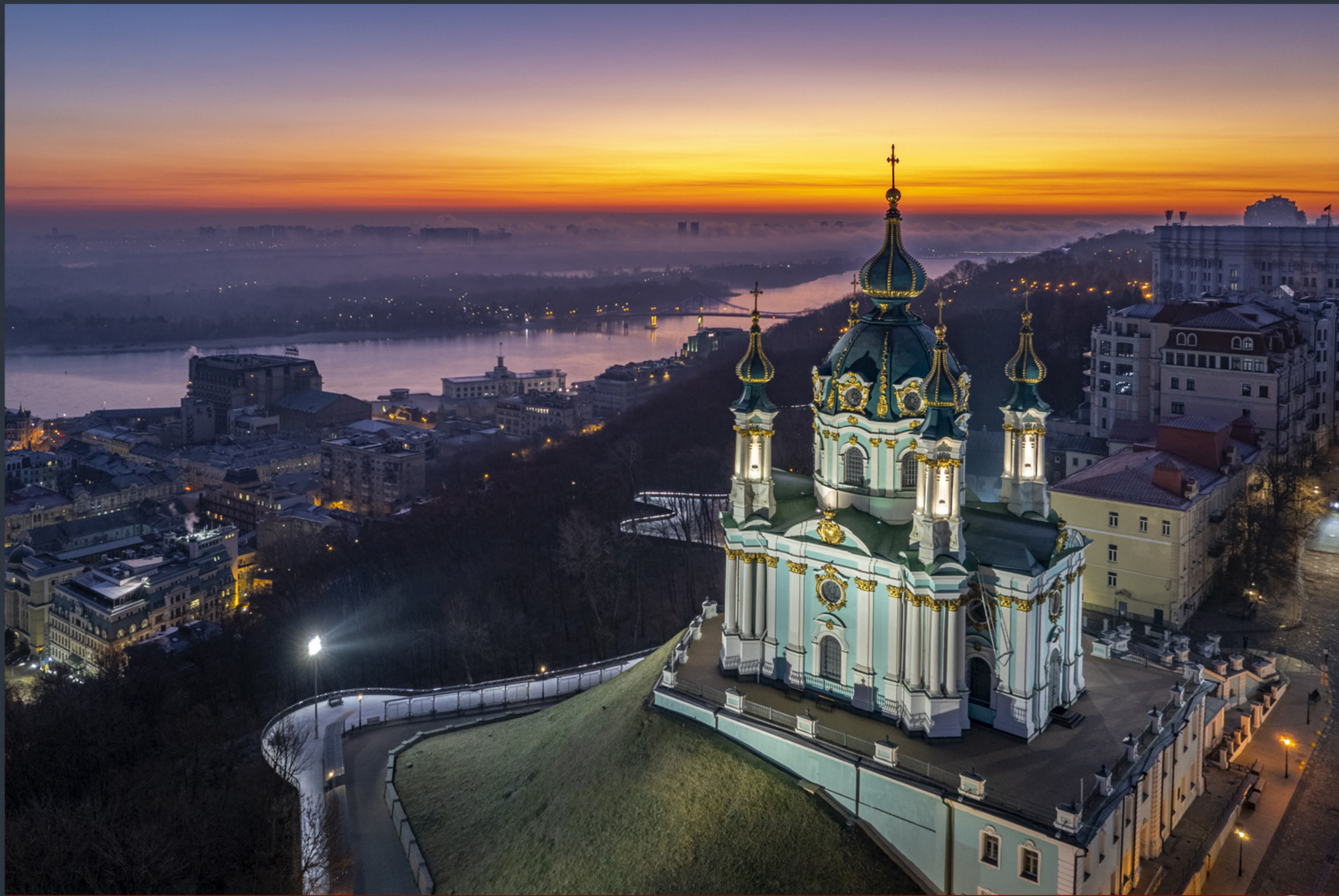
Андріївська церква. Найкраще фото Києва «Вікі любить пам'ятки 2023»