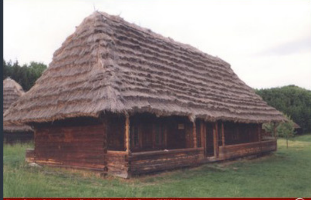
Хата з с. Тушківка Львівської області. Паростів, Київ. 6 червня 2006 року. Київ/Київ. Шт. шти «червон» вітряк