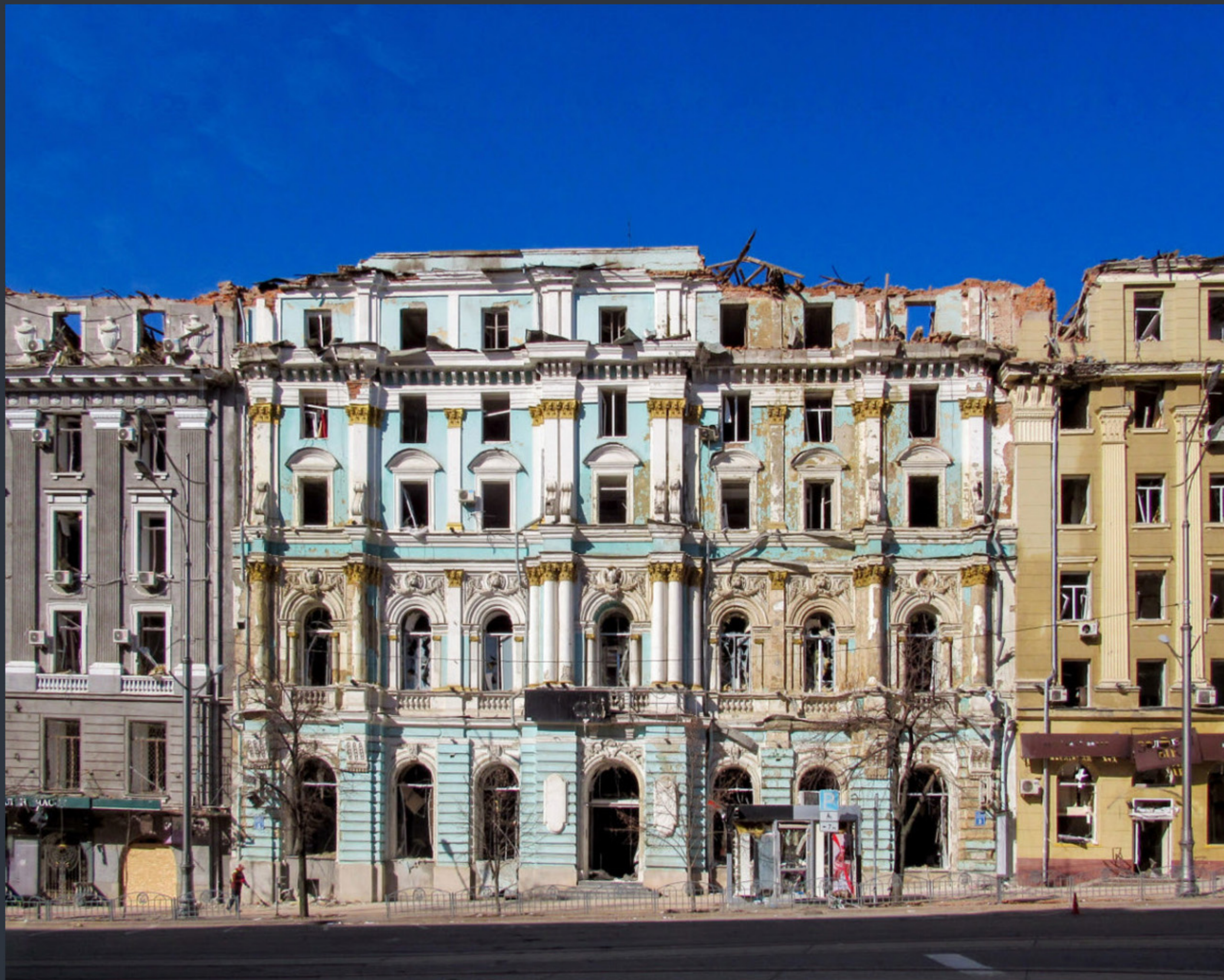
Магазин. Майдан Конституції, 3. Харків. Спецномінація «Війна руйнує пам'ятки»