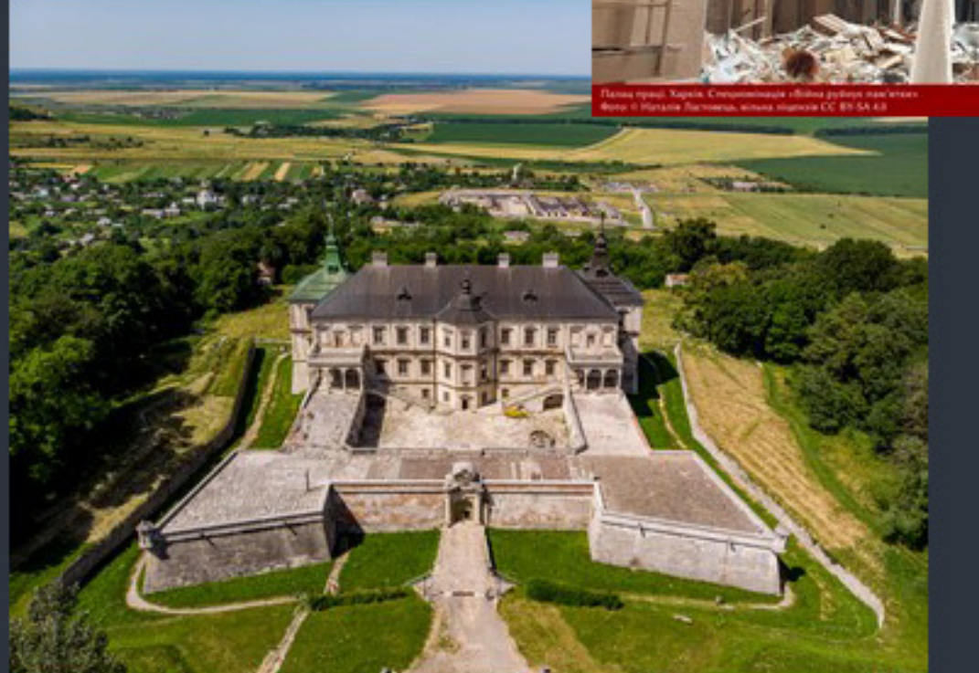
Замок Концпільський. Підгір'я. Найкраще фото Львівської області «Вікі любить пам'ятки 2023» Фото: © Роман Бекас, вільна ліцензія CC BY-SA 4.0