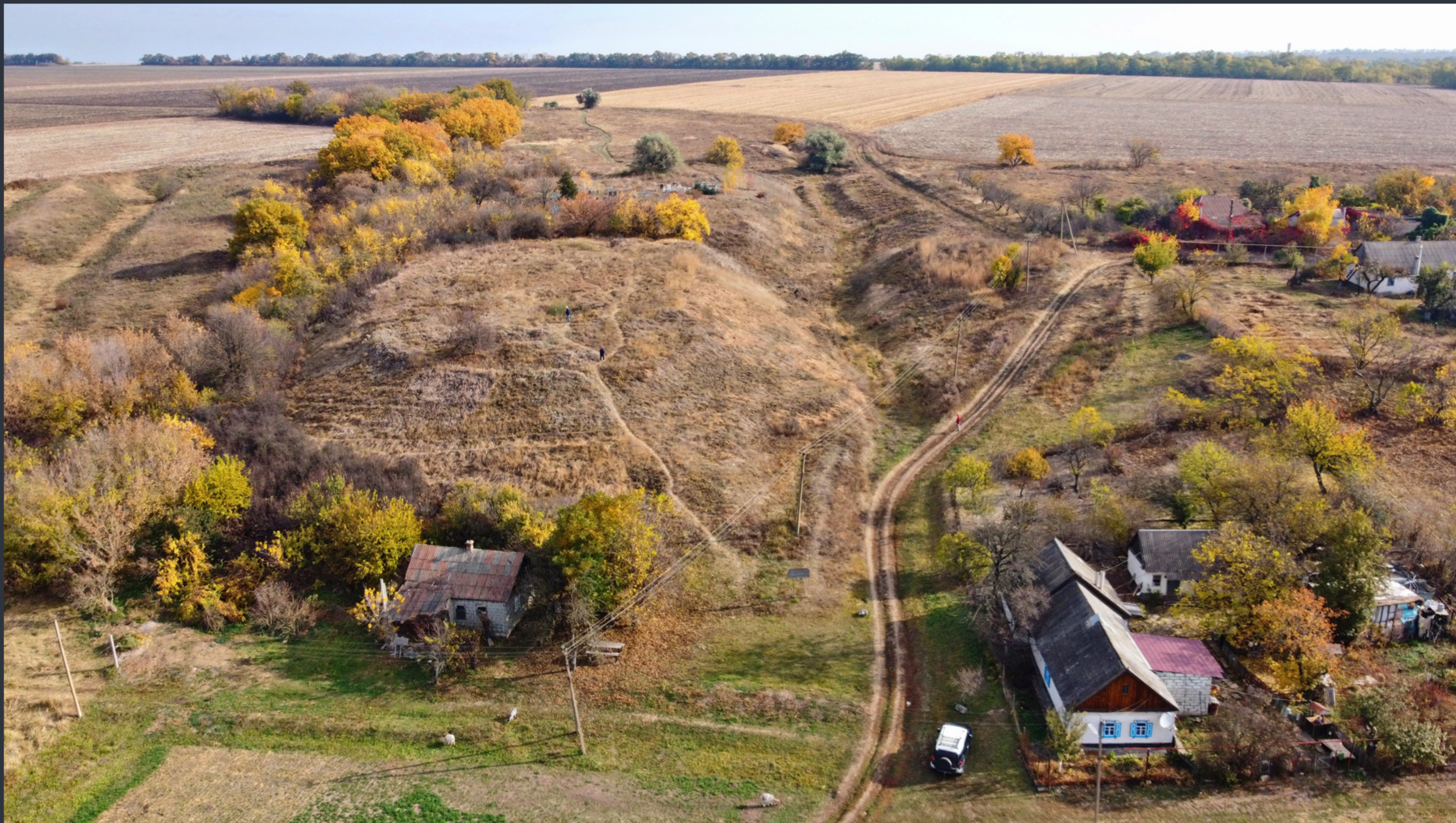
Городище Башмачка. Найкраще фото Дніпропетровської області «Вікі любить пам'ятки 2023» Фото: © Олександр Мальон, вільна ліцензія CC BY-SA 4.0