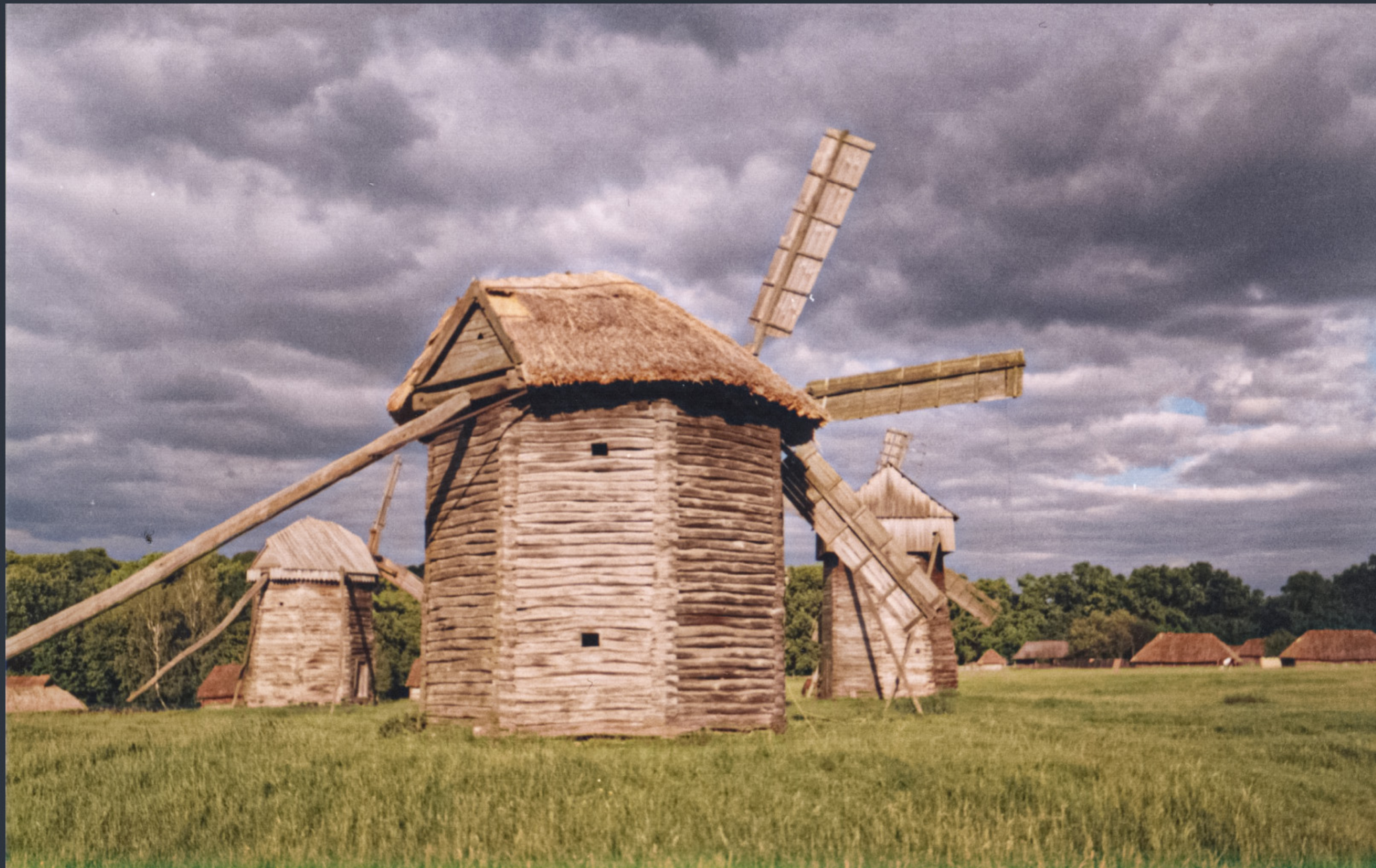
Вітряк із с. Юнаківка Сумської області. Пирогів, Київ. Фото: © Віктор Полянко, CC BY-SA 4.0 6 червня 2006 року. Kodak KB10. Ще цілі «крила» вітряка