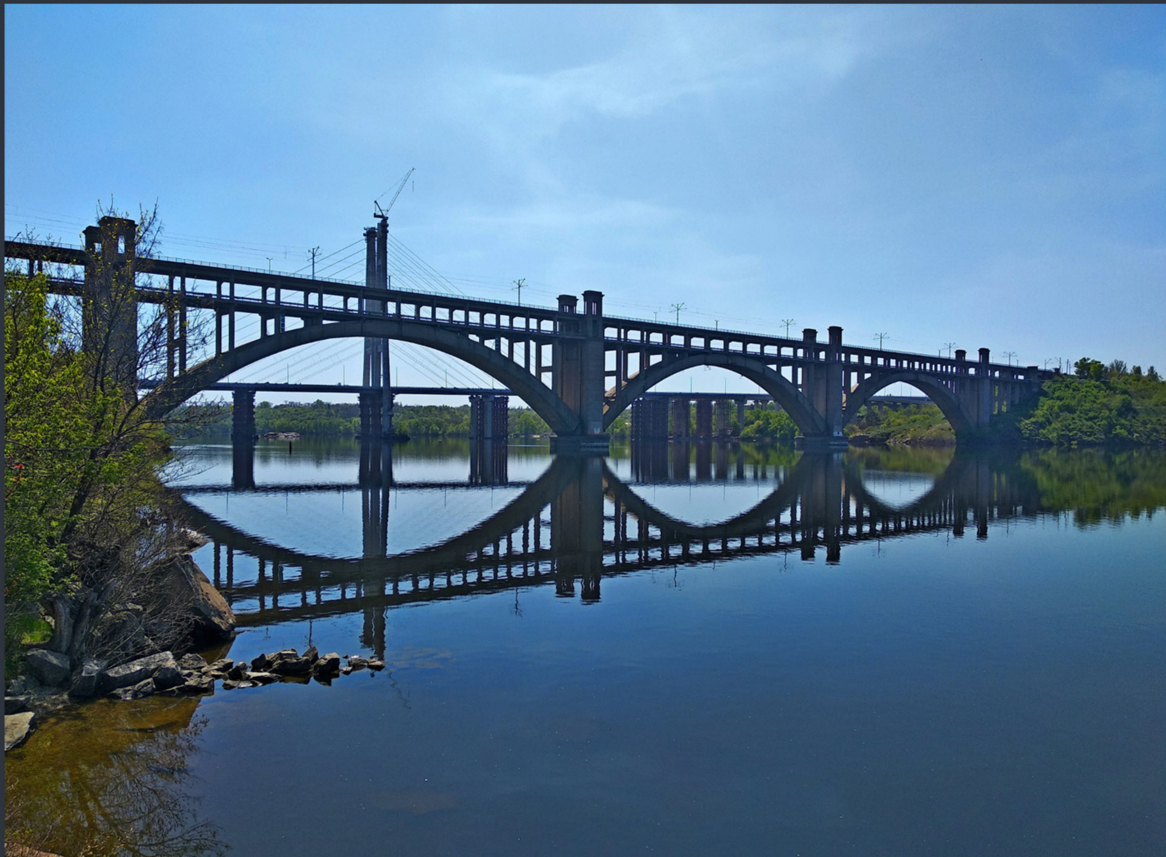
Міст Преображенського. Найкраще фото Запорізької області «Вікі любить пам'ятки 2023» Фото: © Федір Каїра, вільна ліцензія CC BY-SA 4.0