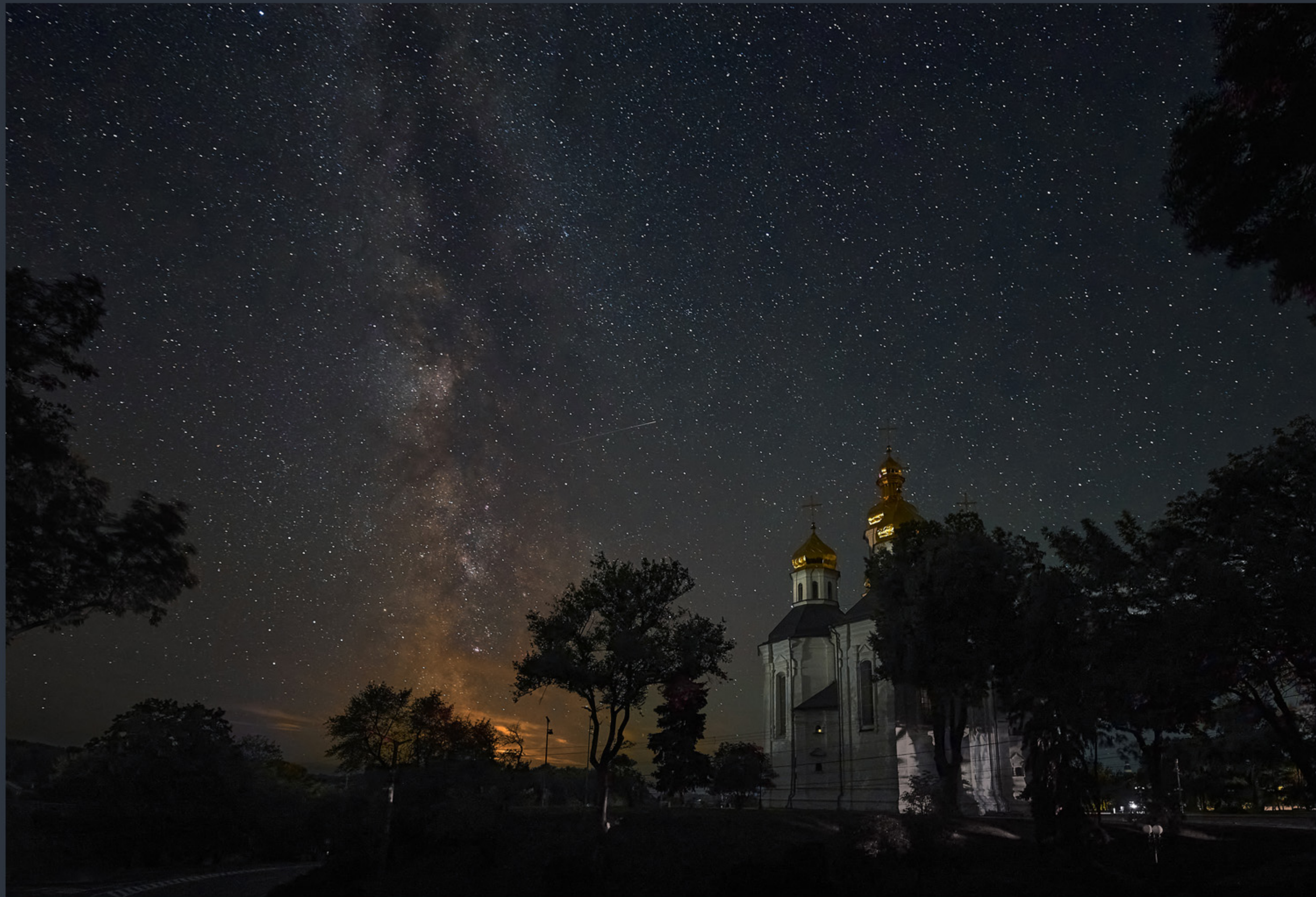
Катерининська церква. Найкраще фото Чернігівської області «Вікі любить пам'ятки 2023»