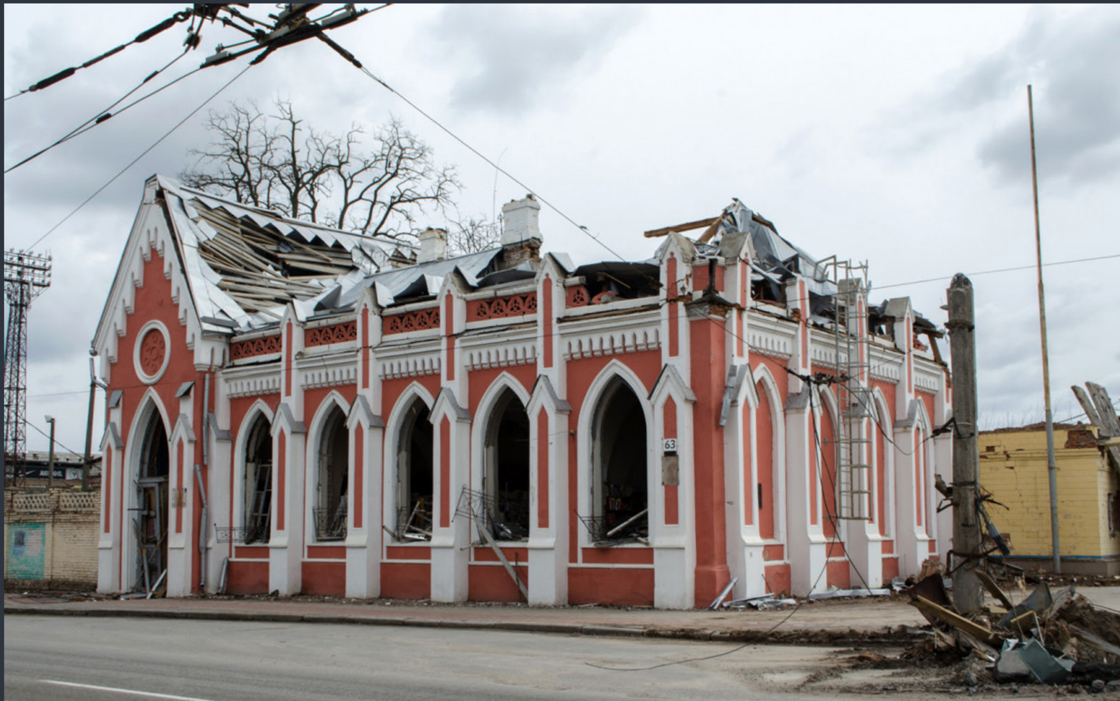
Будинок В. В. Тарновського. Чернігів. Спецномінація «Війна руйнує пам'ятки»