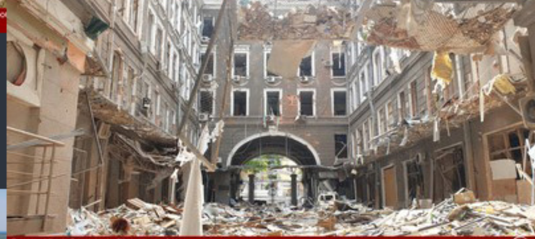
Рівненська область. Чернівці. Співомовляння «Вікі любить пам'ятки»