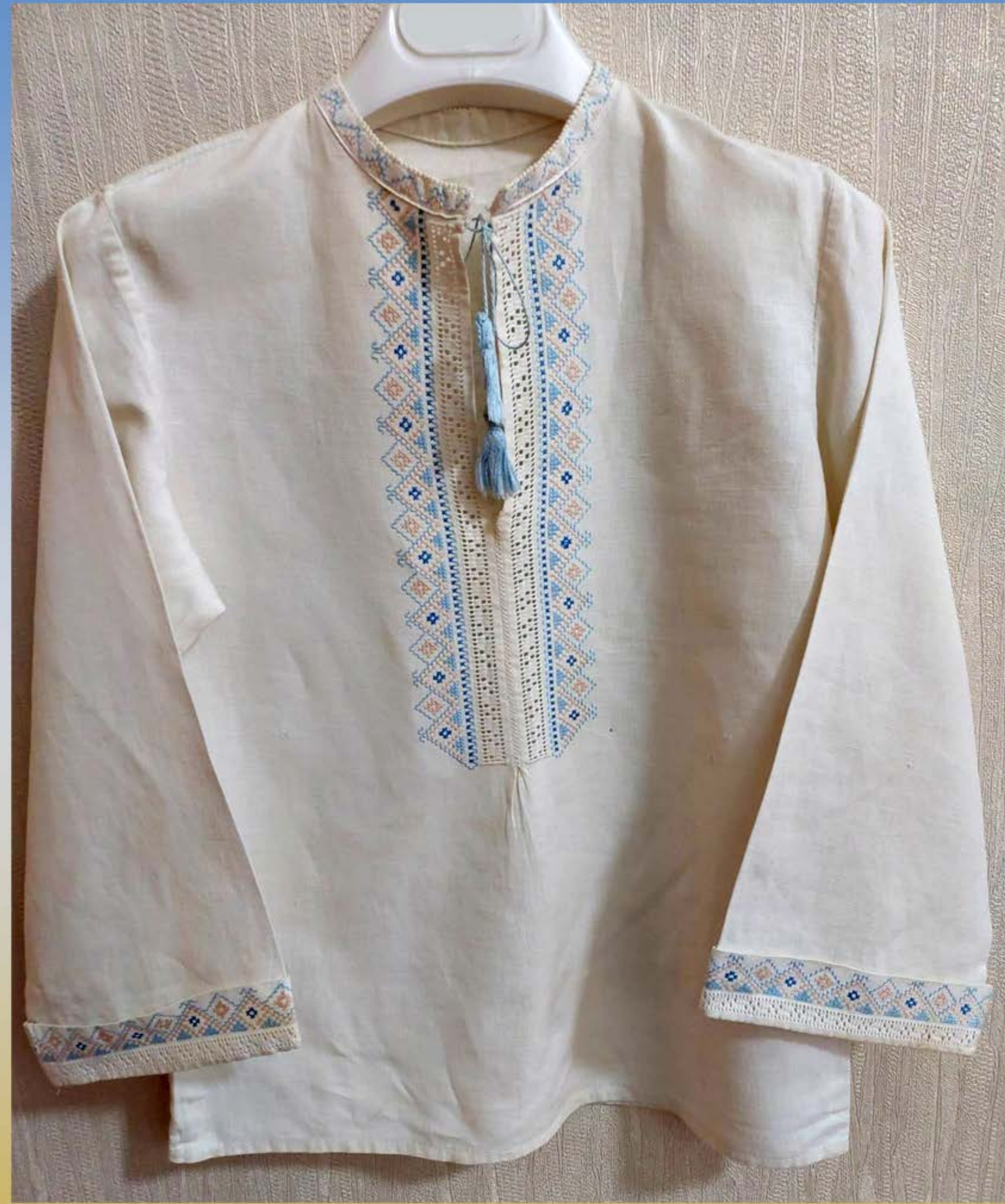
Сорочка для підлітка. 2000-ні рр. З родини Олени Щербак