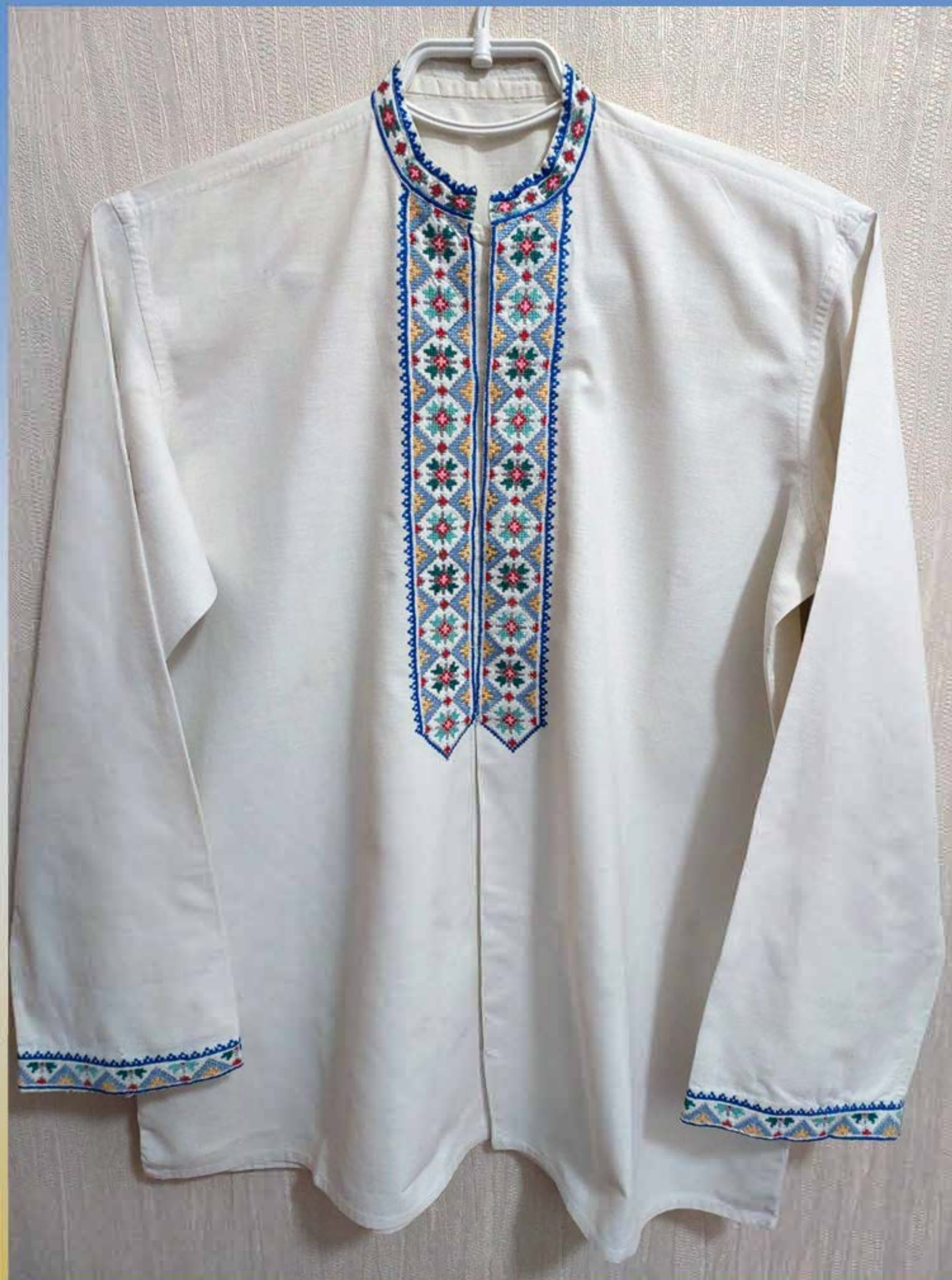
Сорочка для підлітка. 2000-ні рр. З родини Олени Щербак