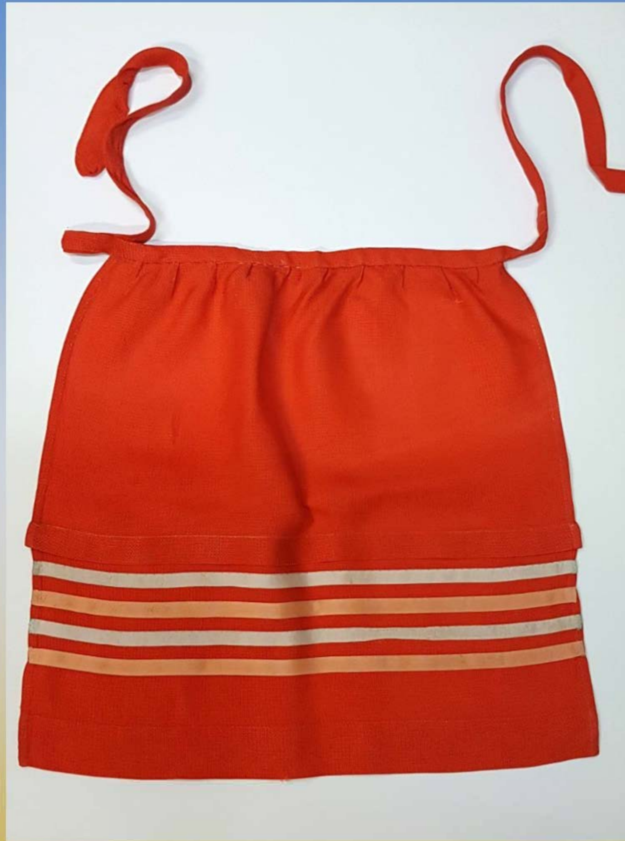
Фартушок для дівчинки. 1940-ві рр. З родини Ярослави Тонкошкур