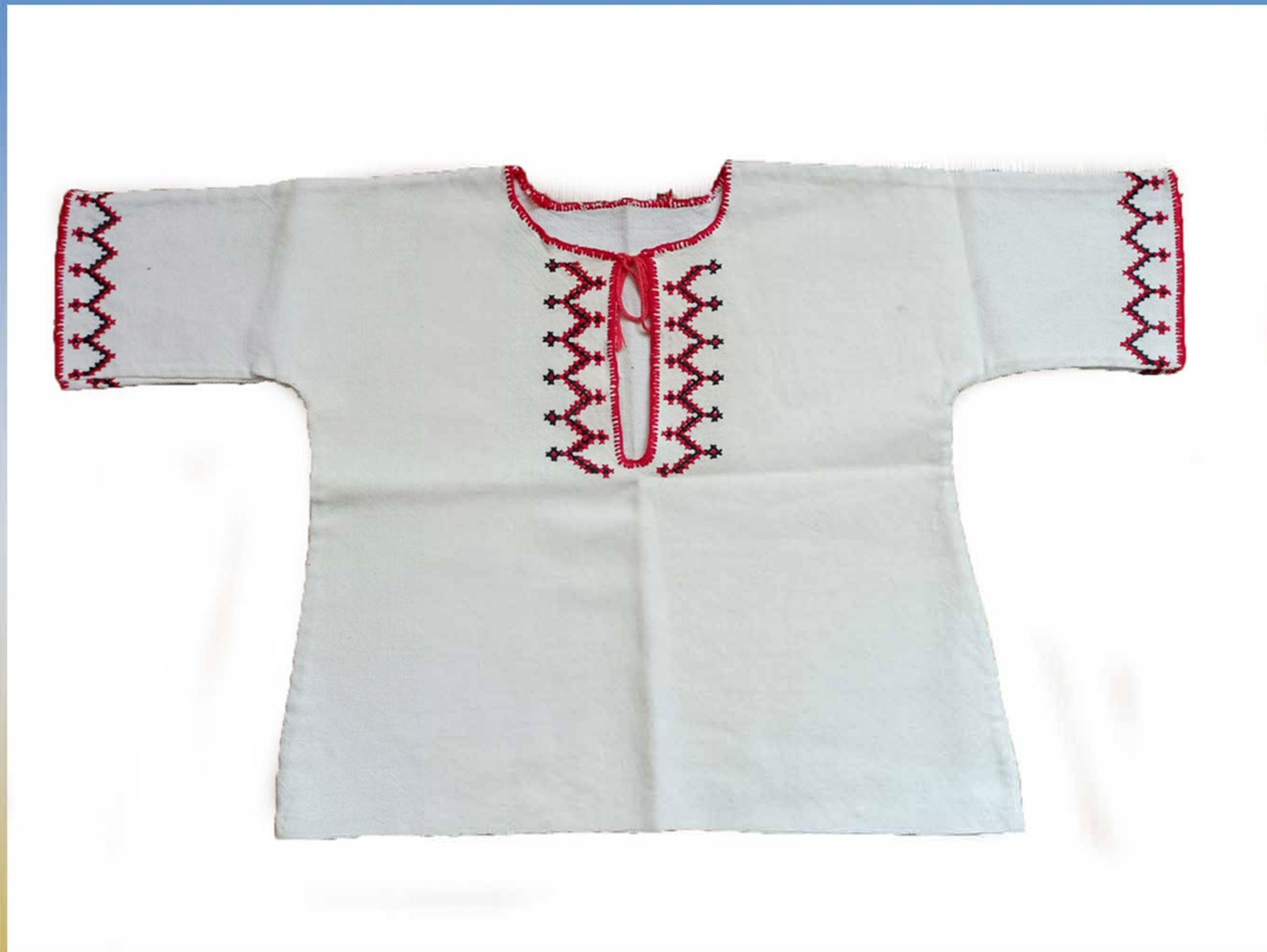
Сорочка для немовляти. Вишивала бабуся для новонародженого Дмитра Щербака. 1988 р. Передавалася у спадок. Носили 4 хлопчики (двоюрідні брати) у віці до півроку