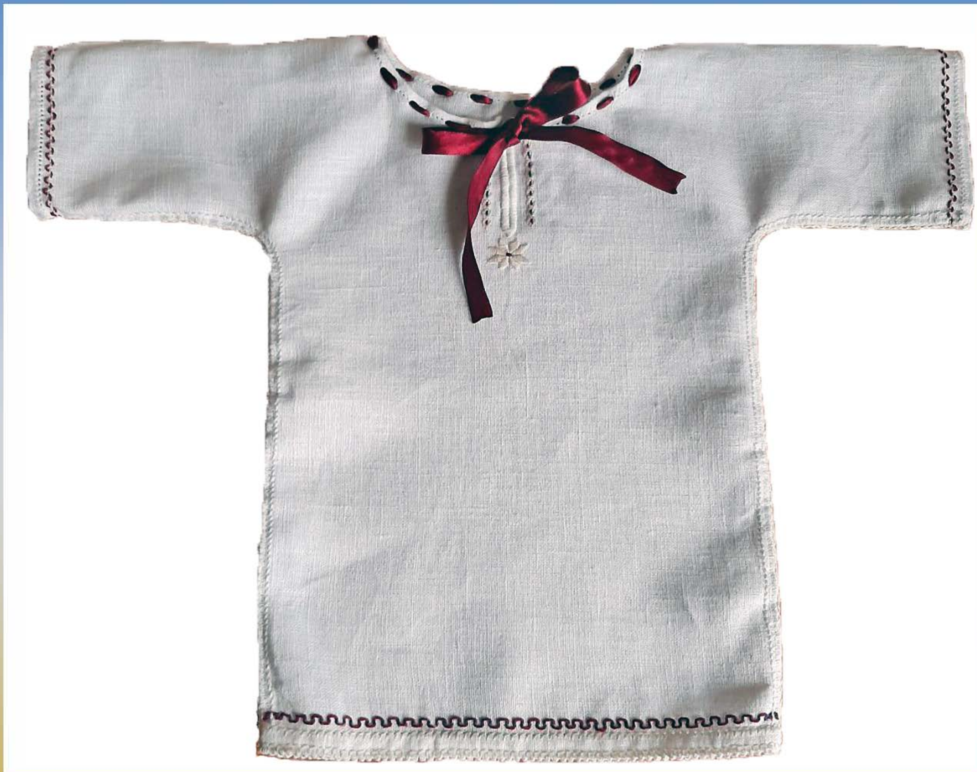
Дитяча сорочка-льоля. Відтворена за етнографічними зразками. Автор – Ірина Нестеренко