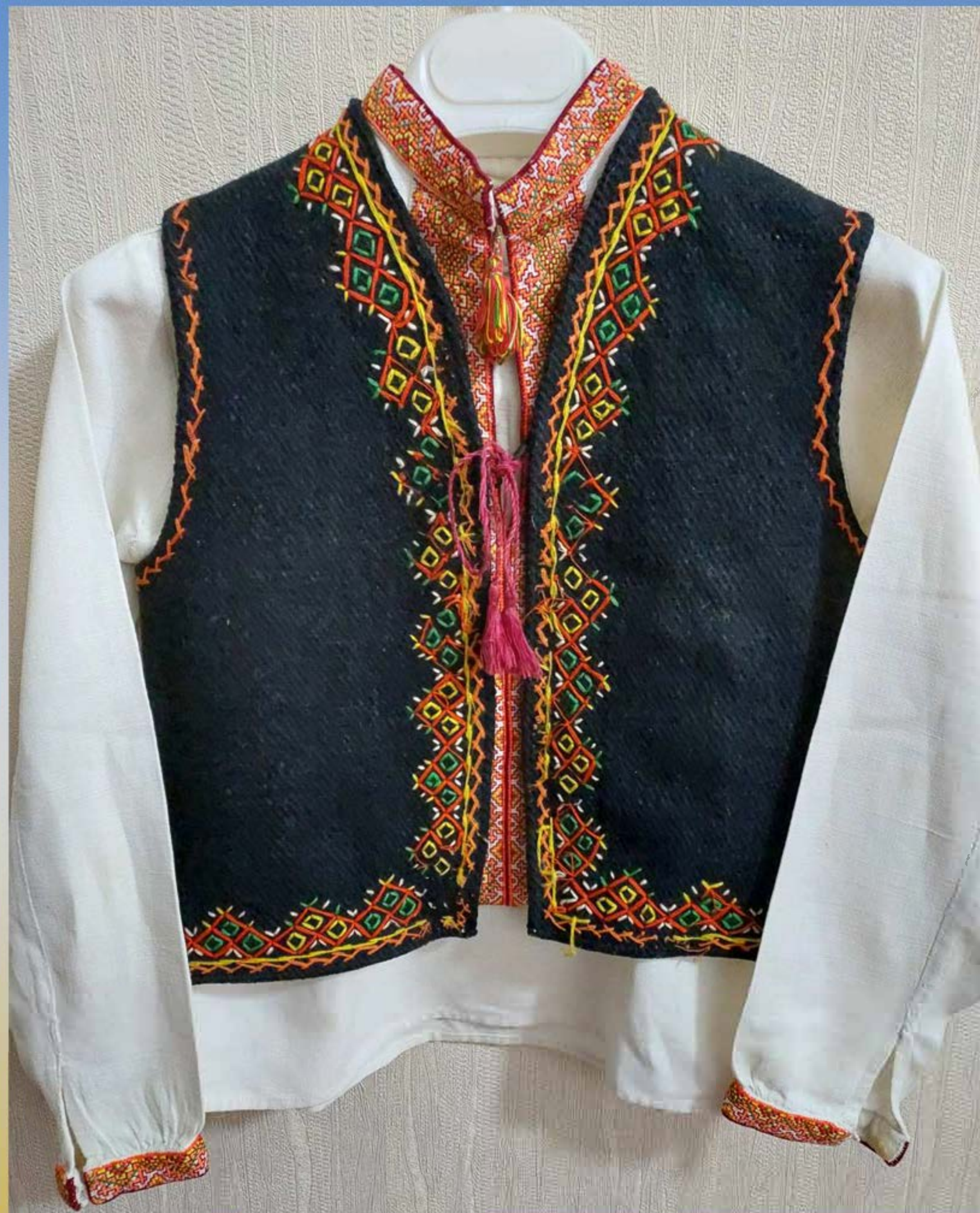
Сорочка для підлітка. 2010 р. Кептарик. 1990 р. Належить Миколі Лузану