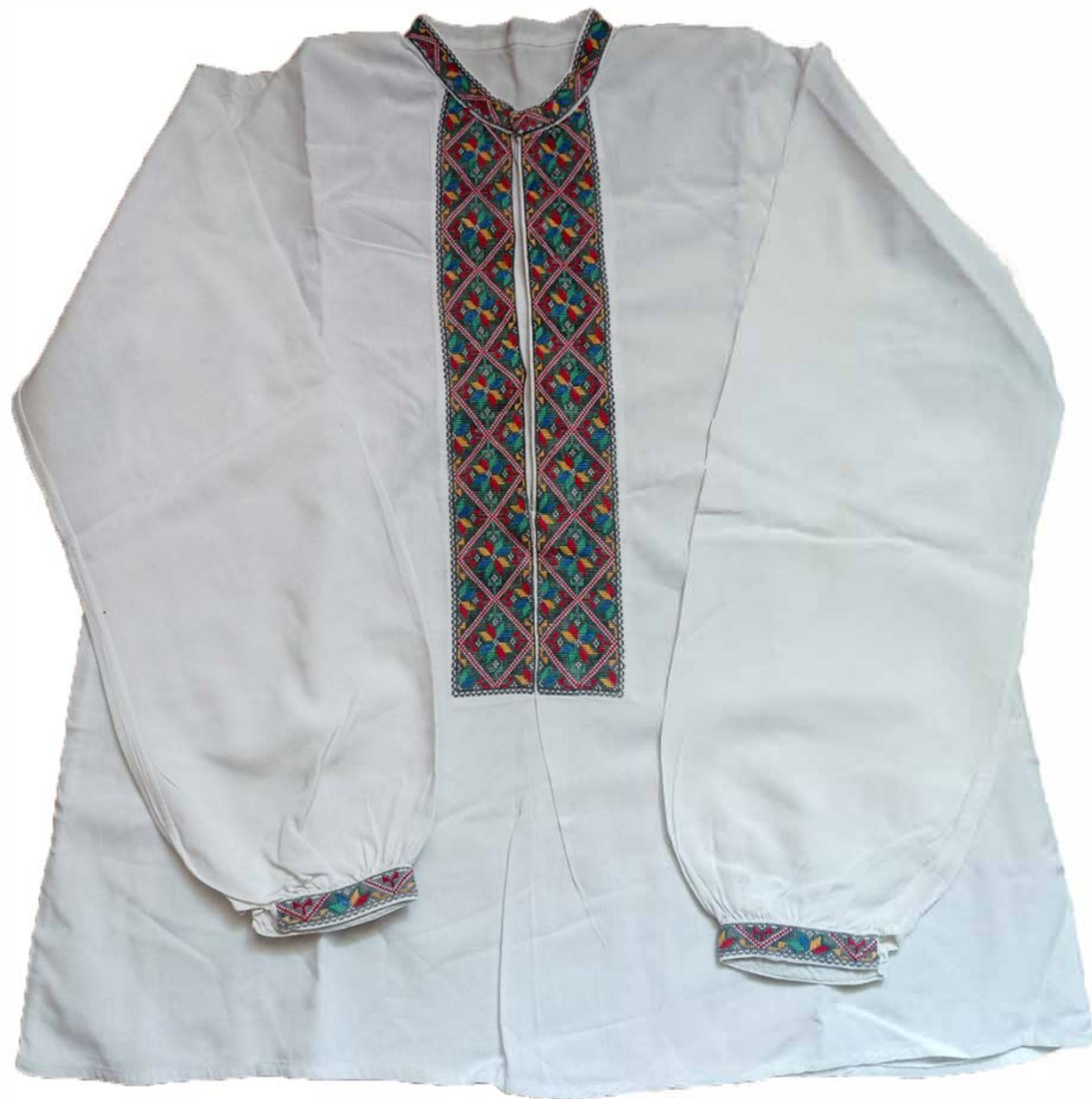
Сорочка для хлопчика 4-5 років. Належить Дмитру Щербаку