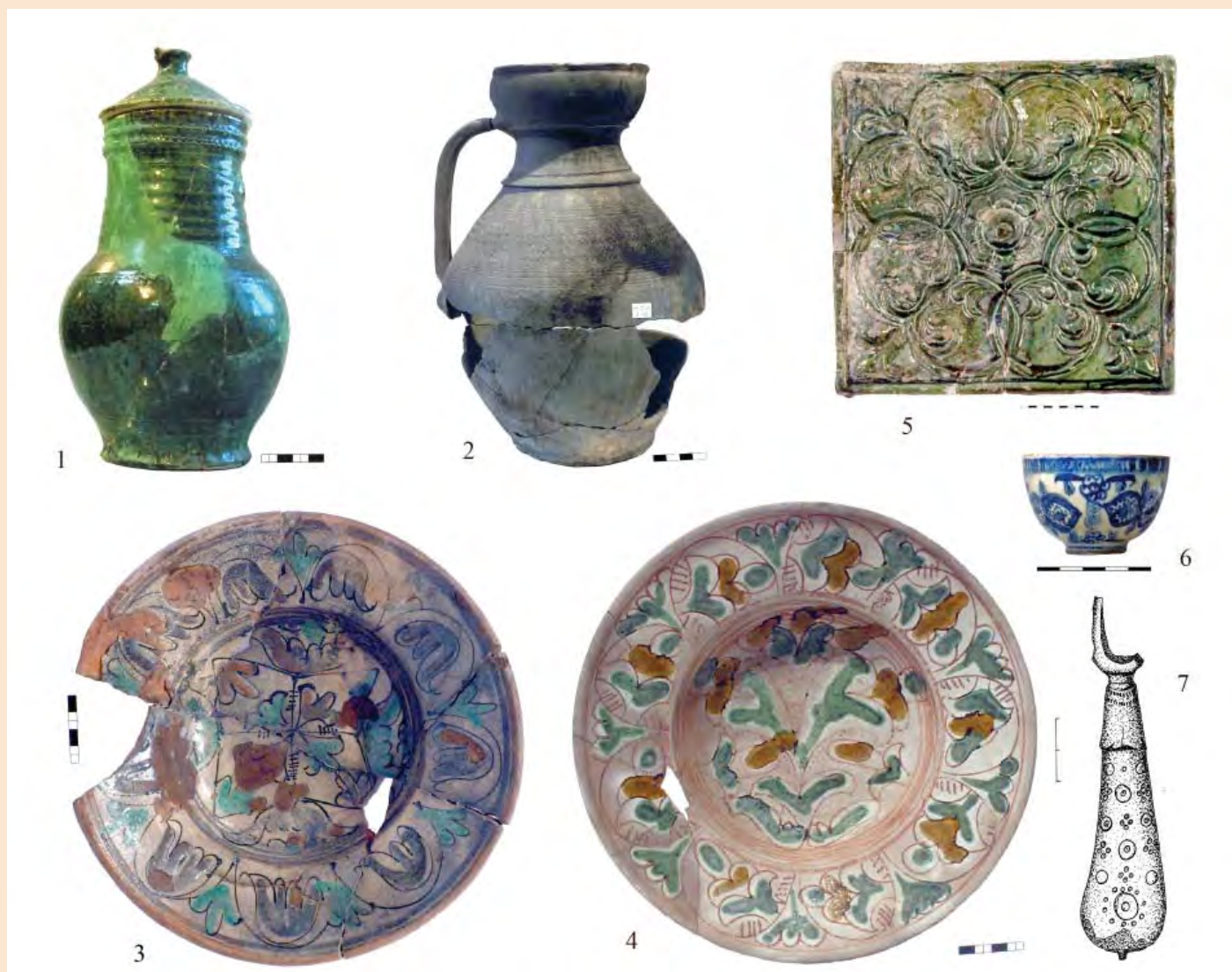
Іл. 4. Михайлівський Золотоверхий монастир. Керамічний посуд (1–4), кахля (5), фаянсова чашечка із Кютах'ї (6), залізна ви- делка з кістяною ручкою (7) із ями кінця XVII – першої половини XVIII ст.

Вітовта» (1392–1430) 1 . Яма 2 траншеї 2 (ділянка 3) – за празьким грошем чеканки Вацлава IV (1378–1419), карбованим після 1405–1407 років. Будівля та яма шурфу 2 (1997) датовані за литовським полугрошем Сигізмунда II Августа 1548 роком, а яма 1 траншеї 2 (1998) – за трьома литовськими денаріями Сигізмунда II Августа (1548–1572). Керамічний набір із цих об'єктів представлений численними формами посуду (у тому числі повного профілю) та кахлями. Знайдені також окремі вироби з металу та кістки (іл. 1: 2, 3, 6, 7; 2).