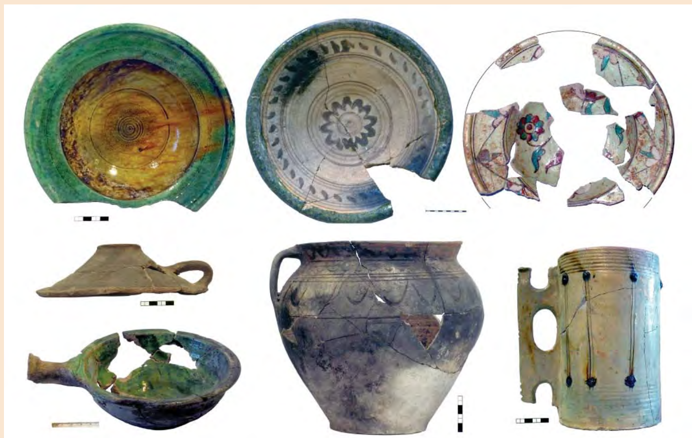
Іл. 3. Михайлівський Золотоверхий монастир. Керамічний посуд з об'єктів XVII ст.

Златоустівська і Троїцька церкви, Федорівський собор, храм на Клові, Георгіївський собор та ін.