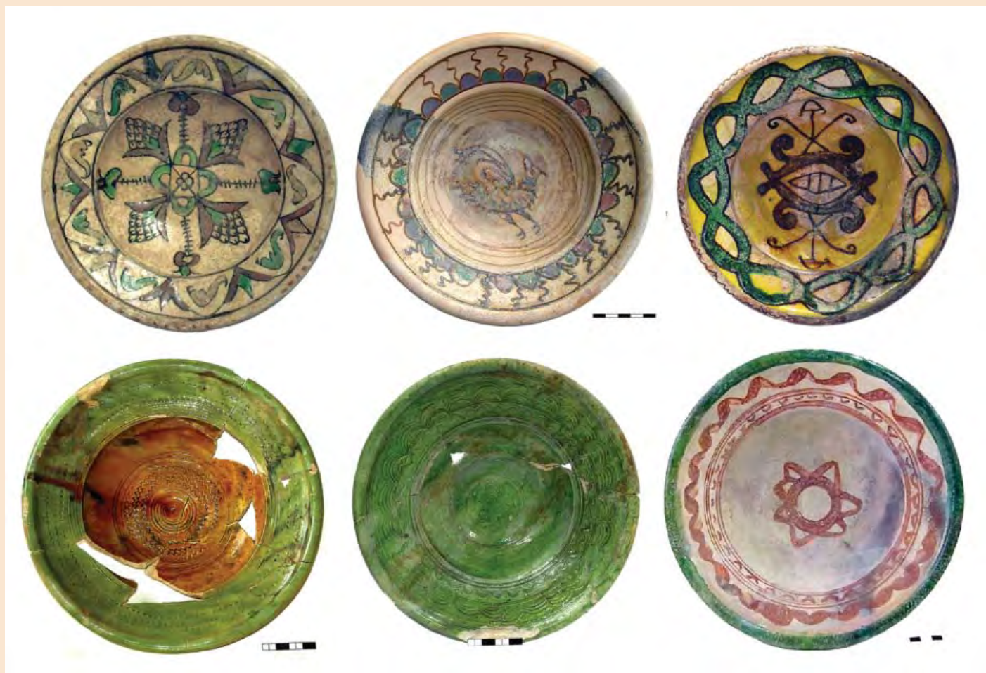
Іл. 7. Вознесенський монастир. Керамічні тарілки з об'єктів XVII – початку XVIII ст.

5, с. 169–171]. На території лаври (біля корпусів 4, 5 і 68) та біля печерської гауптвахти розкопано кілька будівель XV–XVI ст. також з керамічними формами повного профілю. Шар з литовським денарієм типу «колюмна-погонь» досліджено в церкві Феодосія Печерського [12; 13, с. 346]. Об'єкти XVII–XVIII ст. добре досліджені як на території самої лаври, так і біля неї. Це будівля (1989) біля церкви Спаса на Берестові, перекрита земляним валом – оборонною спорудою початку XVIII ст., льох і дві ями з траншеї на подвір'ї Воскресенської церкви (1987), що їх автори розкопок вважають пов'язаними з шинком, позначеним на плані 1638 року, кілька об'єктів біля Печерської гауптвахти, гончарне горно у Лаврському провулку [1; 2; 4; 6].