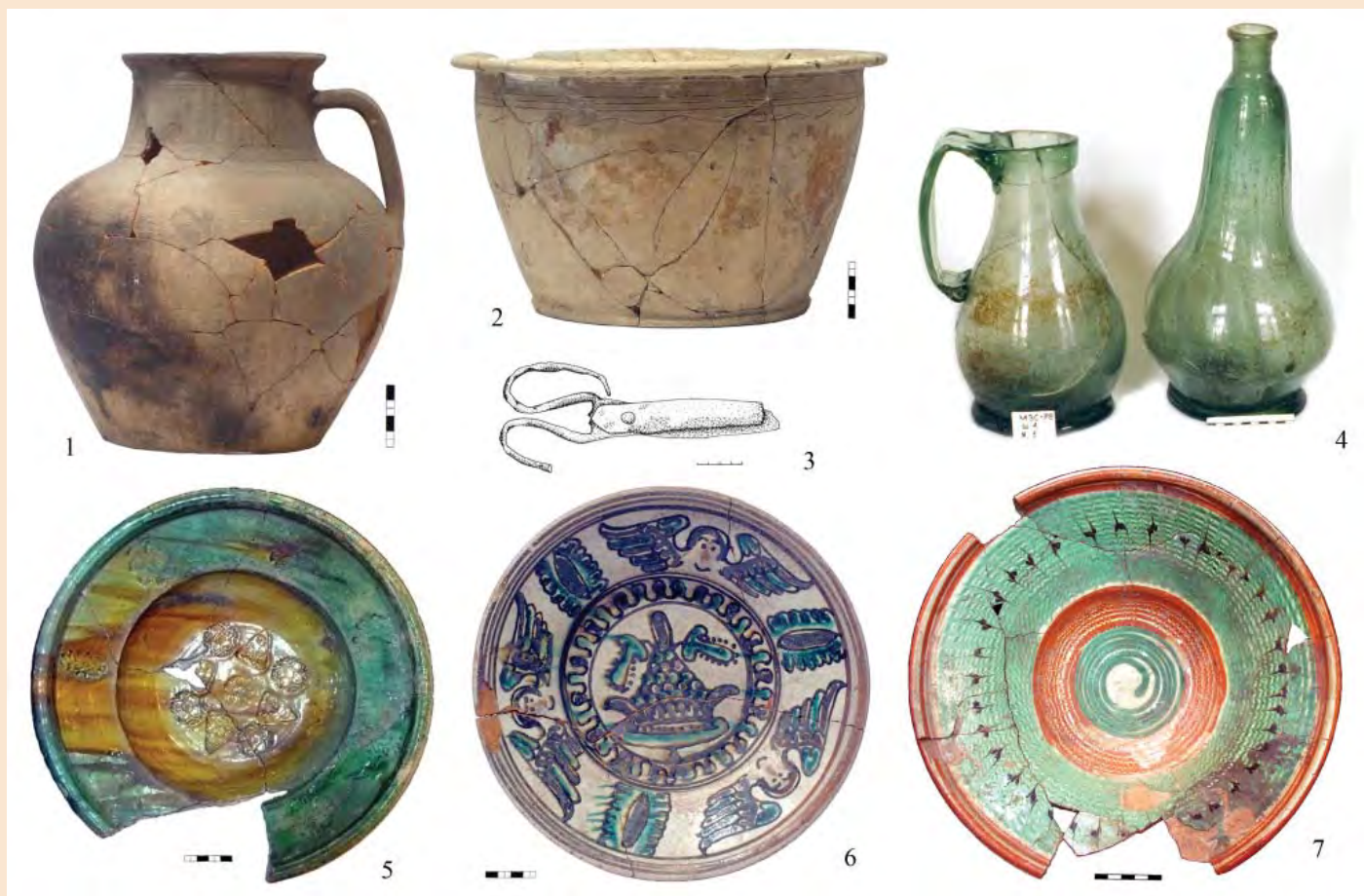
Іл. 5. Михайлівський Золотоверхий монастир. Керамічний (1, 2, 5–7) та скляний (4) посуд, залізні ножиці (3) із ями другої половини XVIII ст.

1674 років. Також яма 1 траншеї 18 містила дві коронні боратинки Яна II Казимира (1649–1668). Із зазначених об'єктів походить значна кількість керамічного та скляного матеріалу (іл. 3).