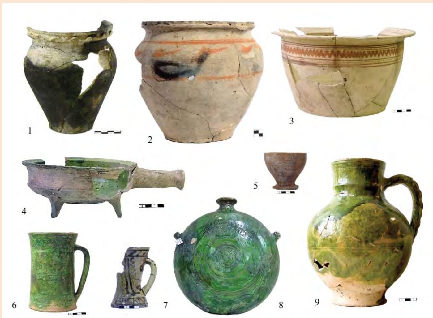
Іл. 6. Вознесенський монастир. Керамічний посуд з об'єктів XVI ст. (1) та XVII – початку XVIII ст. (2–9)

сотні фрагментів і цілі форми кераміки, а також інші цікаві артефакти, зокрема набір шахових кістяних фігурок, металеві хрестик і сережку тощо [7; 14] (іл. 6: 1). Хронологічний горизонт, який можна впевнено пов'язати з Вознесенським жіночим монастирем, розташовувався на площі внутрішнього двору Арсеналу під ярусом поховань. До нього відносяться близько 90 об'єктів різного розміру і призначення (будівлі, льохи, господарчі ями тощо). У більшості з них був знайдений нумізматичний матеріал XVII ст., який ще перебуває на стадії обробки. Ці об'єкти містили близько 20 тис. одиниць керамічного і скляного посуду та кахель, з яких великий відсоток цілих та повного профілю [15; 21]. (іл. 6: 2–9; 7; 8) Представлені також металеві, кістяні та скляні вироби – іконка, гребінці, наперстки, намистини, хрестик тощо. Подальше опрацювання цих матеріалів дасть змогу виділити більш вузькі хронологічні періоди в межах XVII – початку XVIII ст.